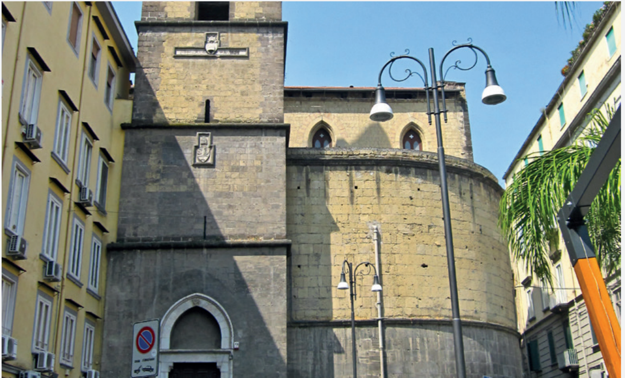
San Pietro a Majella Piazza Luigi Miraglia

Proprietà di Enti Religiosi o FEC (Fondo Edifici Culto del Ministero degli Interni)