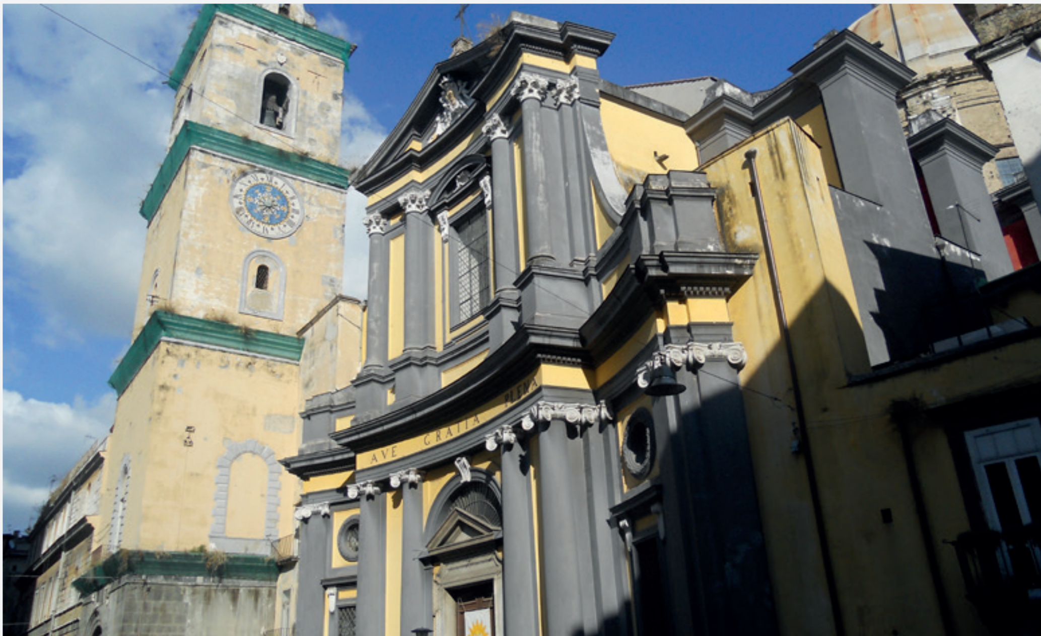
Ruota dell'Annunziata Via Annunziata