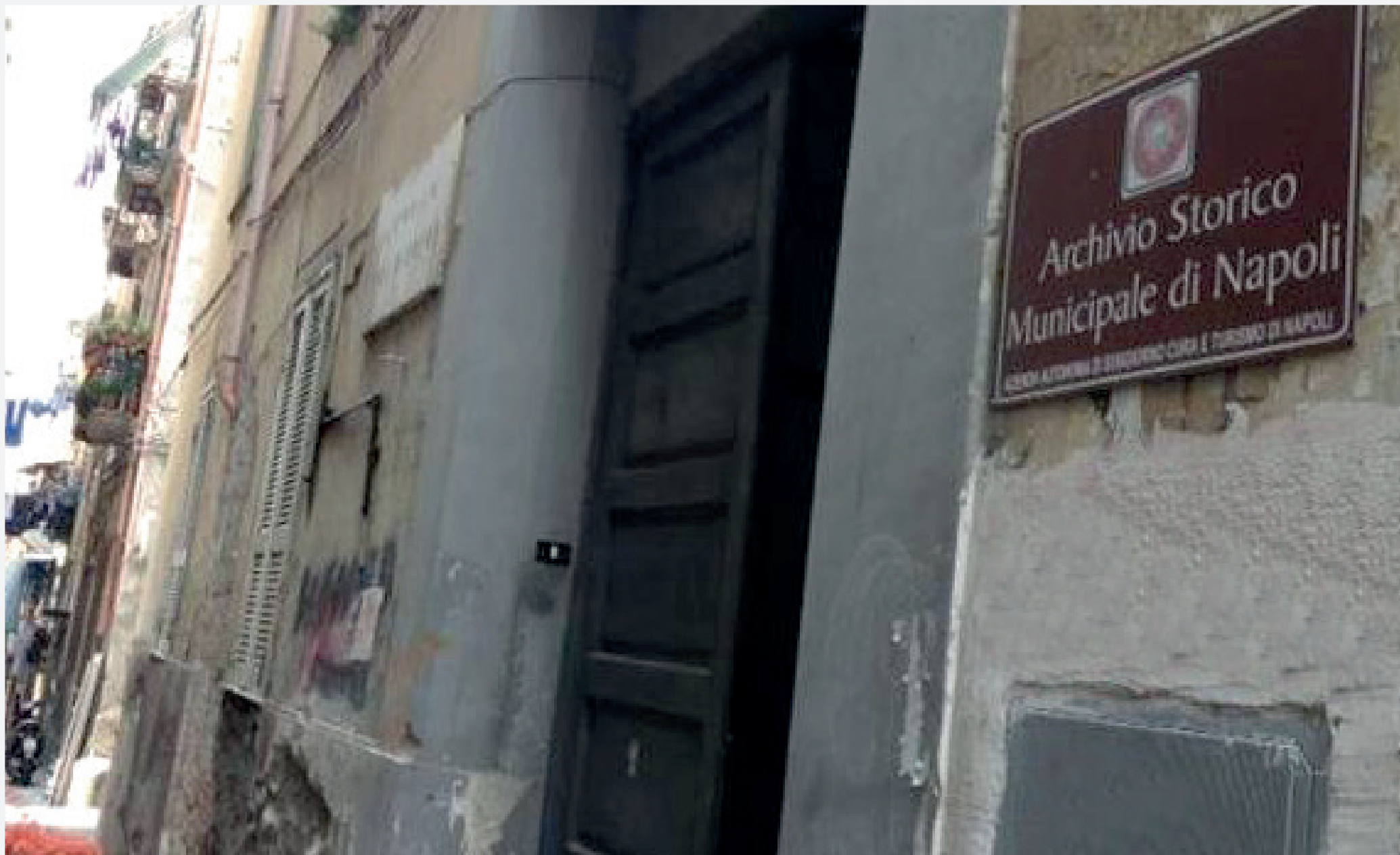
Archivio Storico Municipale Salita Pontenuovo