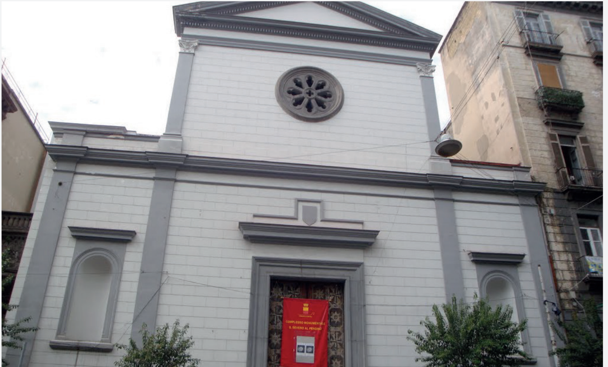
Chiesa di San Severo al Pendino Via Duomo