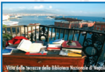
Vista della terrazza della Biblioteca Nazionale di Napoli

Coelmo spa - Agglomerato Industriale ASI 80011 Acerra (NA) - Italy Tel + 39 081 803971 int. 15 Fax + 39 081 8039724 - www.coelmo.it