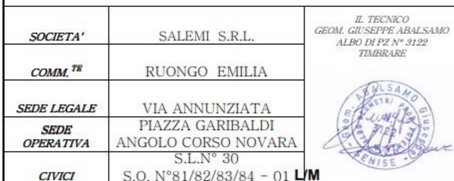
TAVOLA FORMATO A0 SCALA 1:50