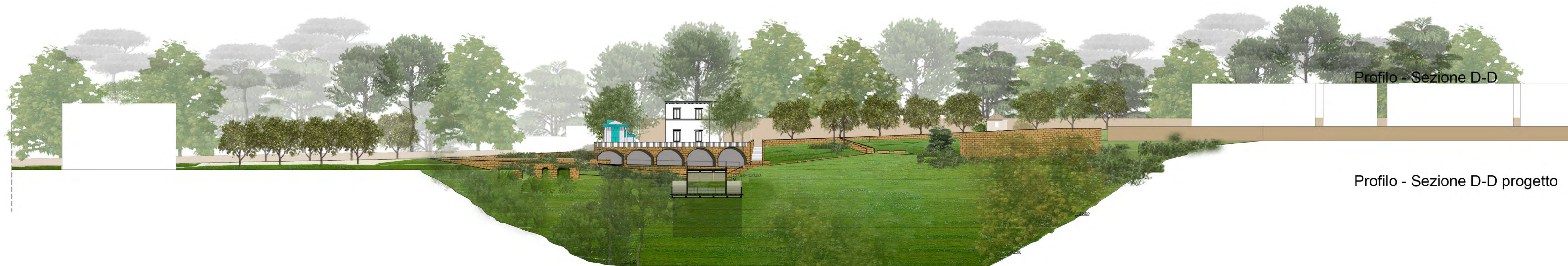
Profilo - Sezione D-D

Nota: Per una lettura di dati di dettaglio cfr.: Tavole 14 e 15