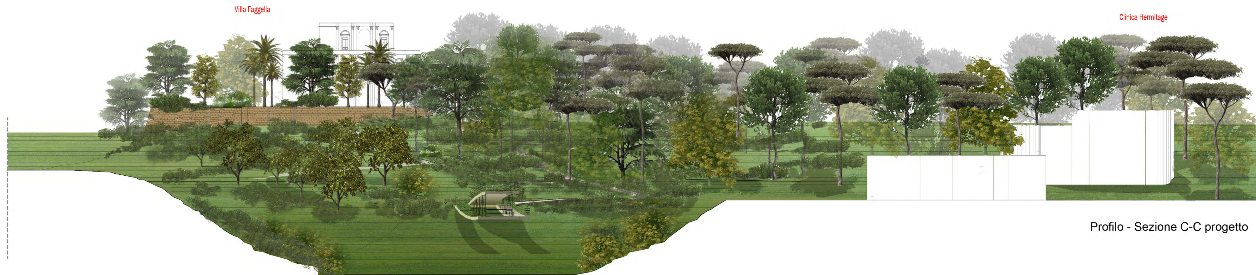
Profilo - Sezione C-C progetto