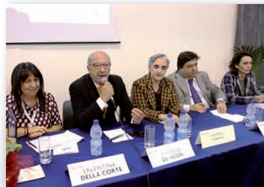
Il Presidente della Camera di Commercio ed il Console Americano