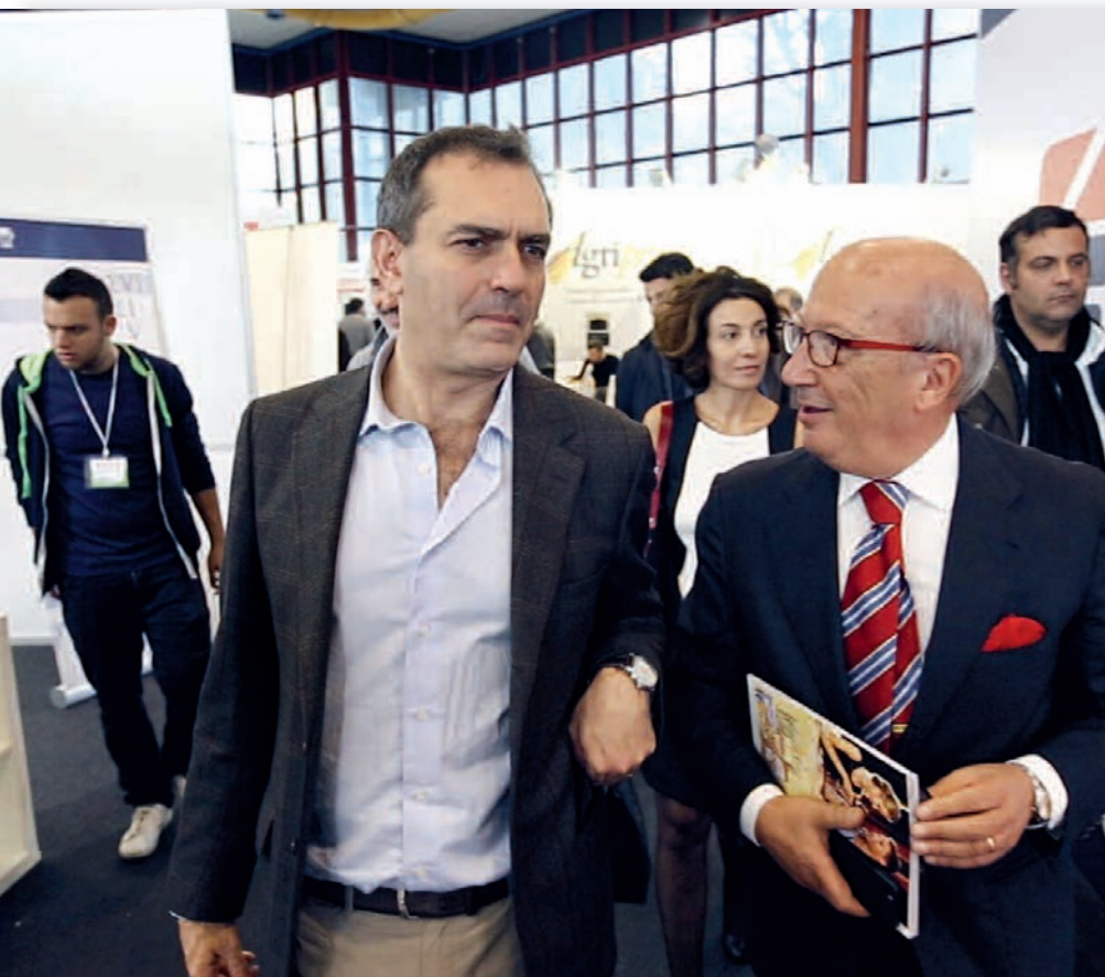
Il Sindaco di Napoli e il patron della manifestazione

COMUNE DI NAPOLI | REGIONE CAMPANIA | CAMERA DI COMMERCIO DI NAPOLI ICE – ISTITUTO PER IL COMMERCIO ESTERO | MINISTERO PER LE POLITICHE AGRICOLE