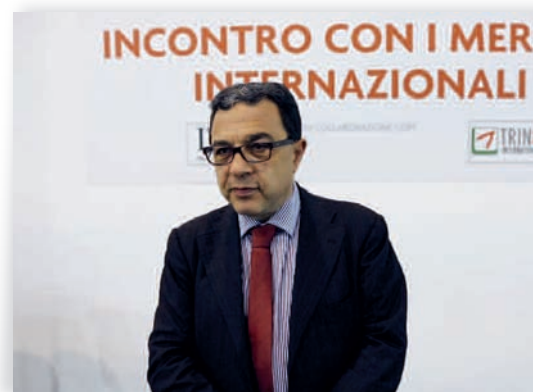
Il delegato del Ministero delle Politiche Agricole, Alimentari e Forestali