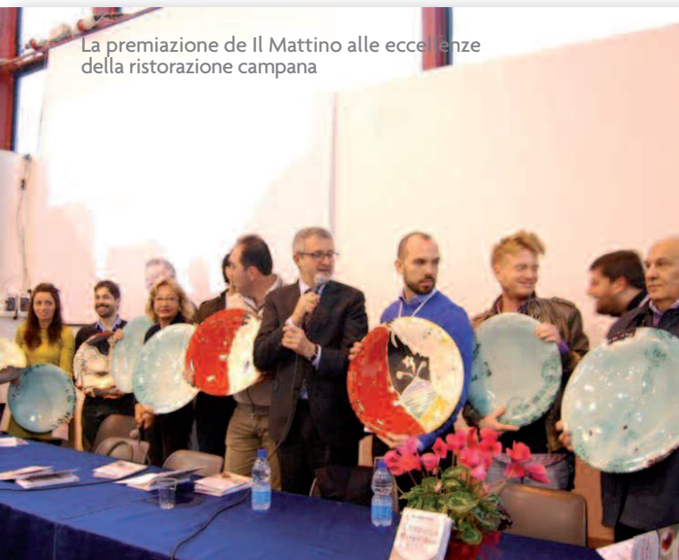
La premiazione de Il Mattino alle eccellenze della ristorazione campana

Il Mattino – Roma – Repubblica – Ansa – Italtpress Mixer Planet – WebitMag – Il Giornale del Turismo – Travelnostop – Turistinviaggio – Globetrotter Magazine – Ristorazione e Catering Green Planner Magazine – Saporinews – Club del Gusto – Itinerari nel Gusto – Wine History Vie del Gusto – Dentro Salerno – La Gazzetta di Salerno – Mezzogiorno e dintorni. SKYTG24 – CANALE 21 – CANALE 8 – TELEVOMERO