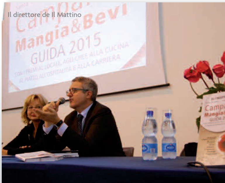
Il direttore de Il Mattino