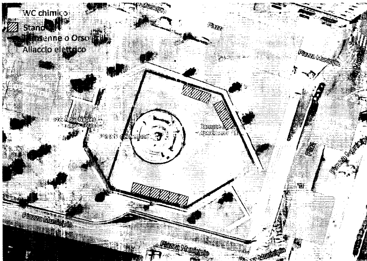
Figura 2-2: area villaggio giornata di sabato dalle 14:00 alle 18:00