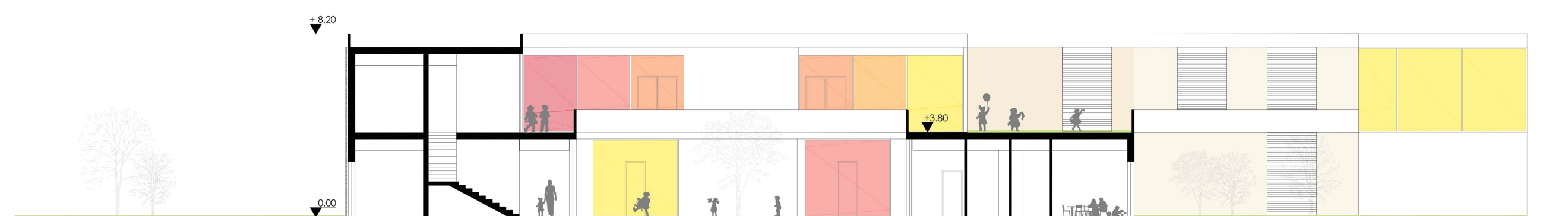
Sezione C - C'