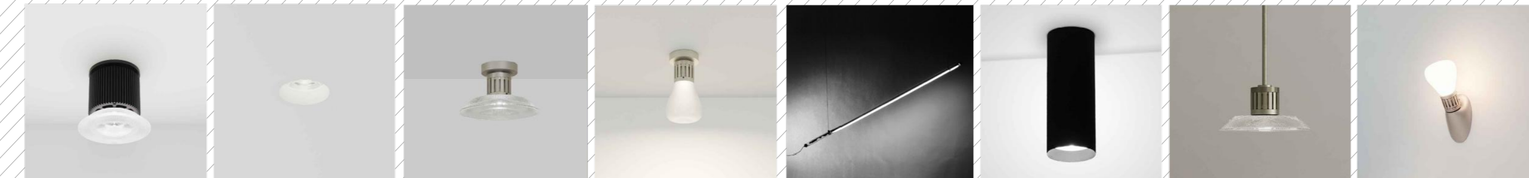
rif.a ampP fisso rif.b m1 micro scotoloto rif.c n55 soffitto amp 150 rif.c1 n55 soffitto hm01 rif.d,d1 bacchetta magica rif.f,f1 cilindro 58 rif.g n55 sospensione amp 150 rif.h n55 parete soffitto

ARCHITETTO GIUSEPPE VELLE Via Carlo Cassini 101 - 80138 Napoli Via Roma 17/A - 81022 Avellino