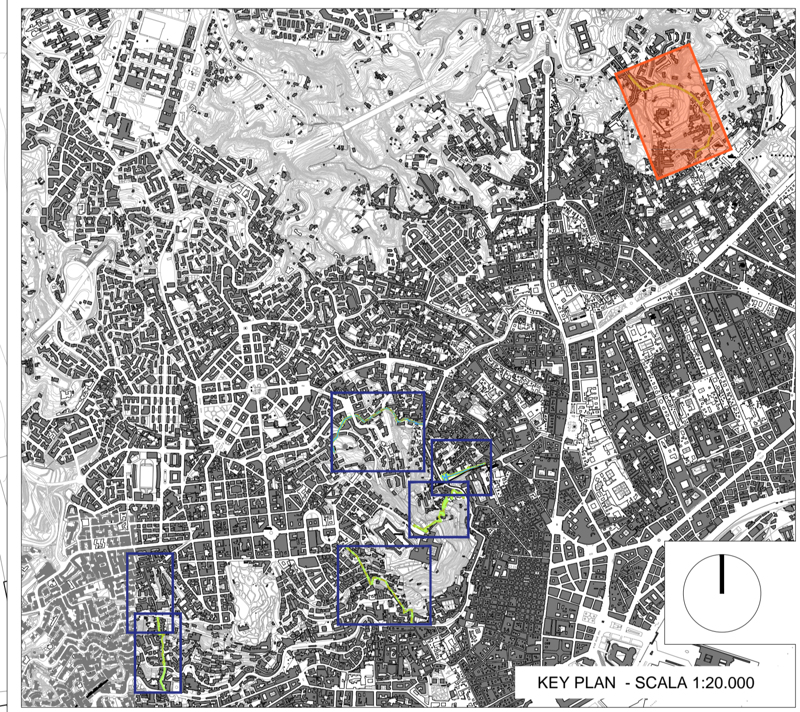
KEY PLAN - SCALA 1:20.000