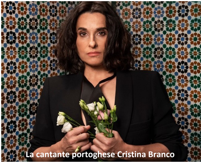
La cantante portoghese Cristina Branco

progetto inedito, realizzato per questa occasione, che riunisce grandi nomi della world music come Alfio Antico (tamburo a cornice), Luigi Lai (launeddas) e il pakistano Ashraf Sharif Khan (sitar).