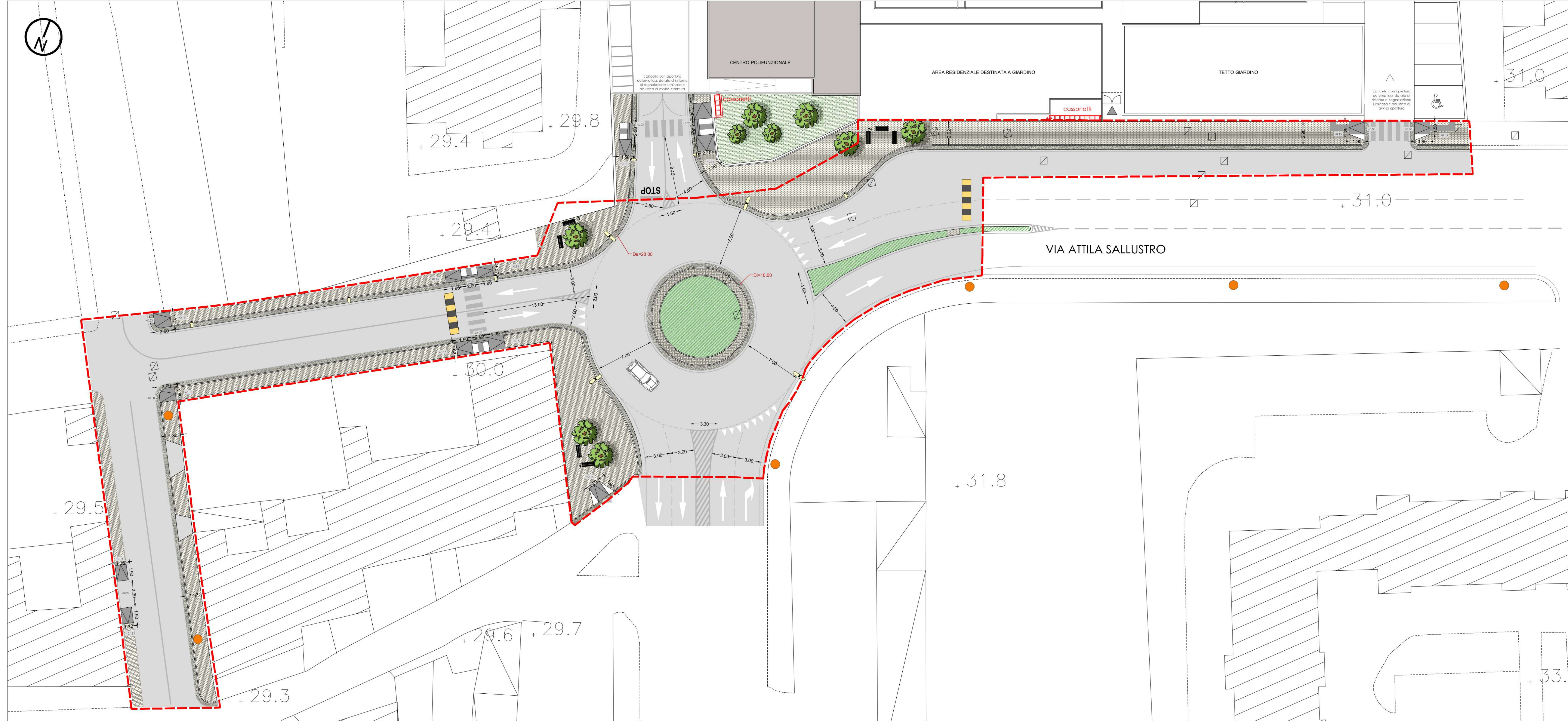
Planimetria generale degli interventi

SUPERFICIE TOTALE URBANIZZAZIONI PRIMARIE = 2.638,00 MQ