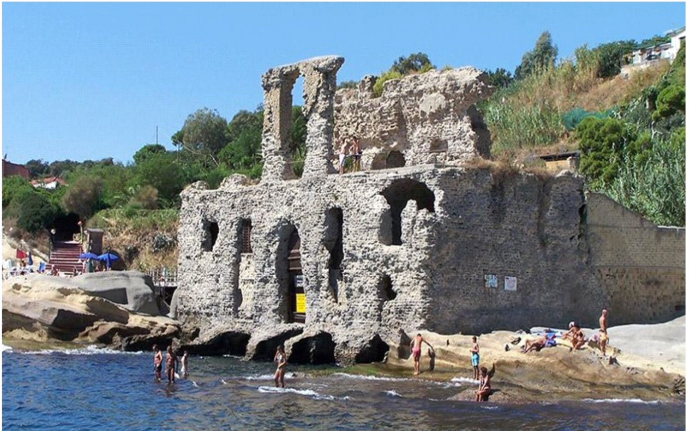
Palazzo degli Spiriti - Marechiaro - Sito archeologico.

La pioggia è stata pari a 23 mm , 10 mm in meno della media stagionale e tutta concentrata nel temporale del giorno 14 .