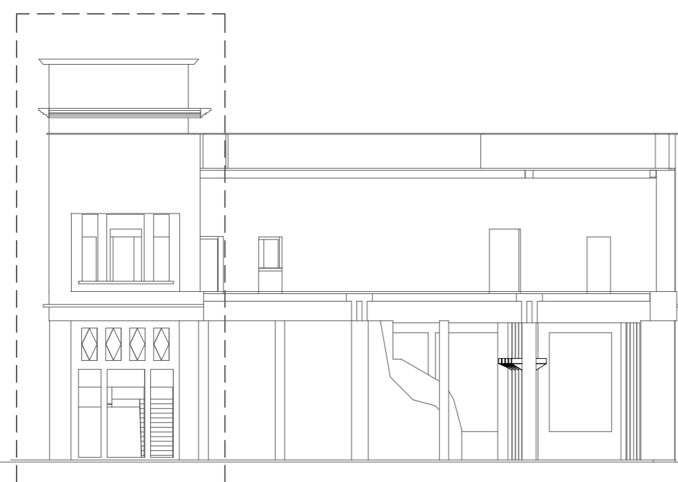
Prospetto B-B' scala 1:200