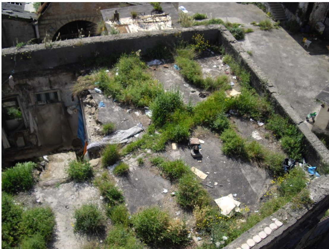
Foto 4 tav.G02B Vista dall'alto della palazzina lato uffici in parte con tetto crollato