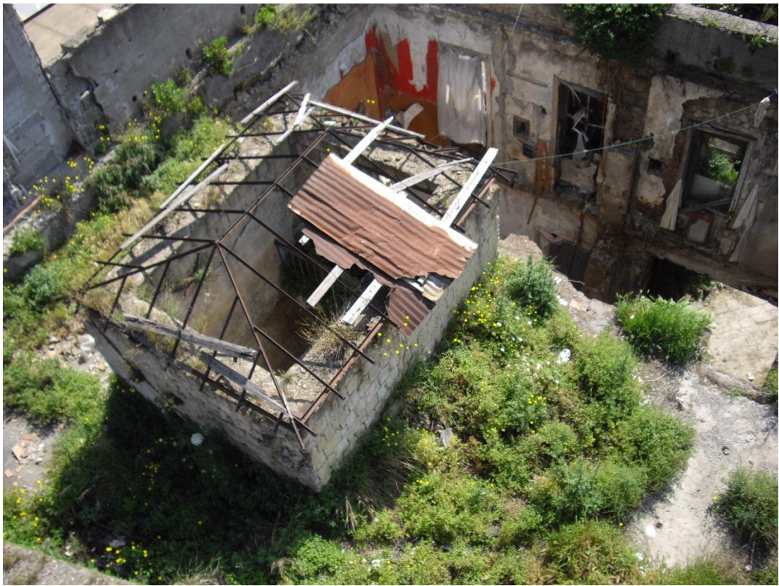
Foto 1 tav.G02B Vista dall'alto della palazzina lato uffici in parte con tetto crollato