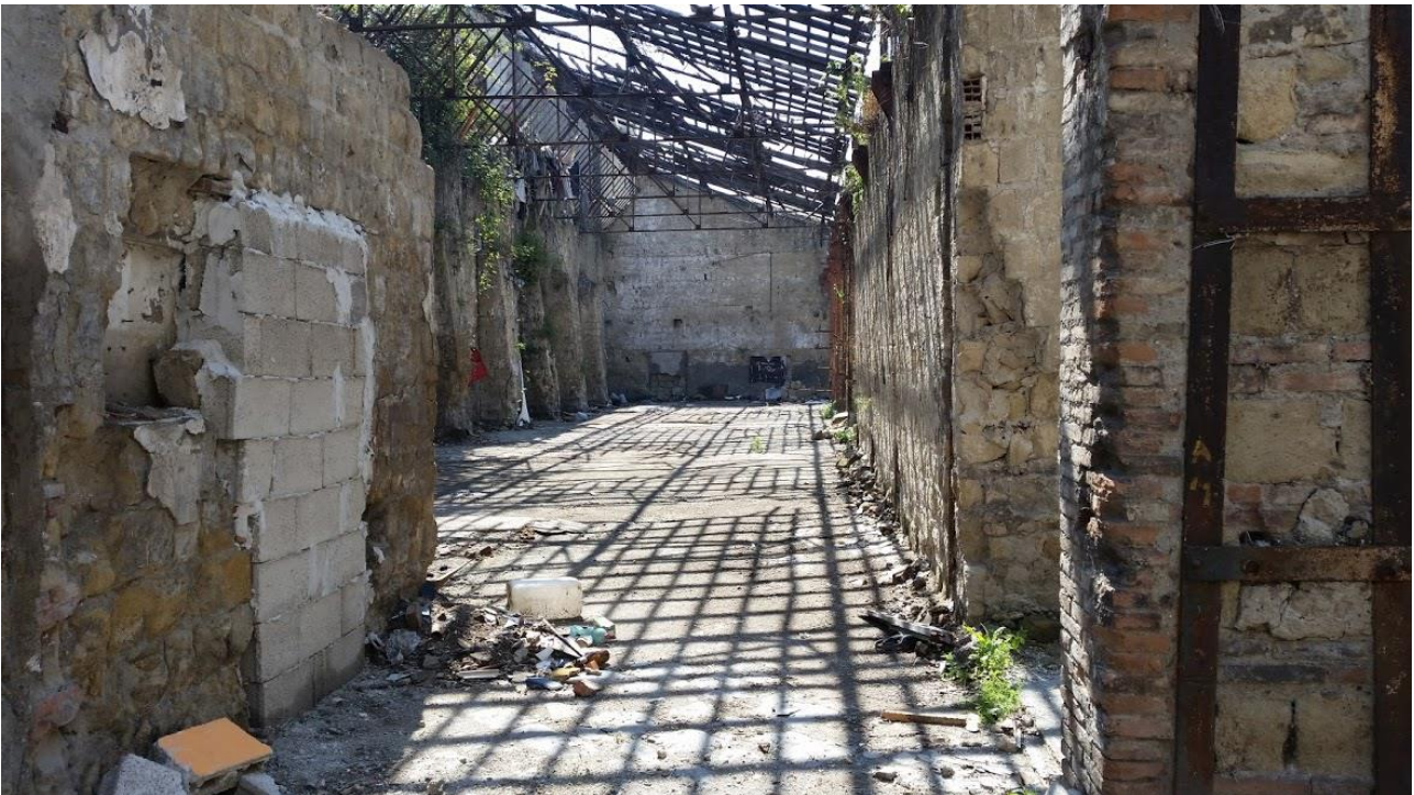
Foto 8 tav.G02A Vista capannone lato sinistro