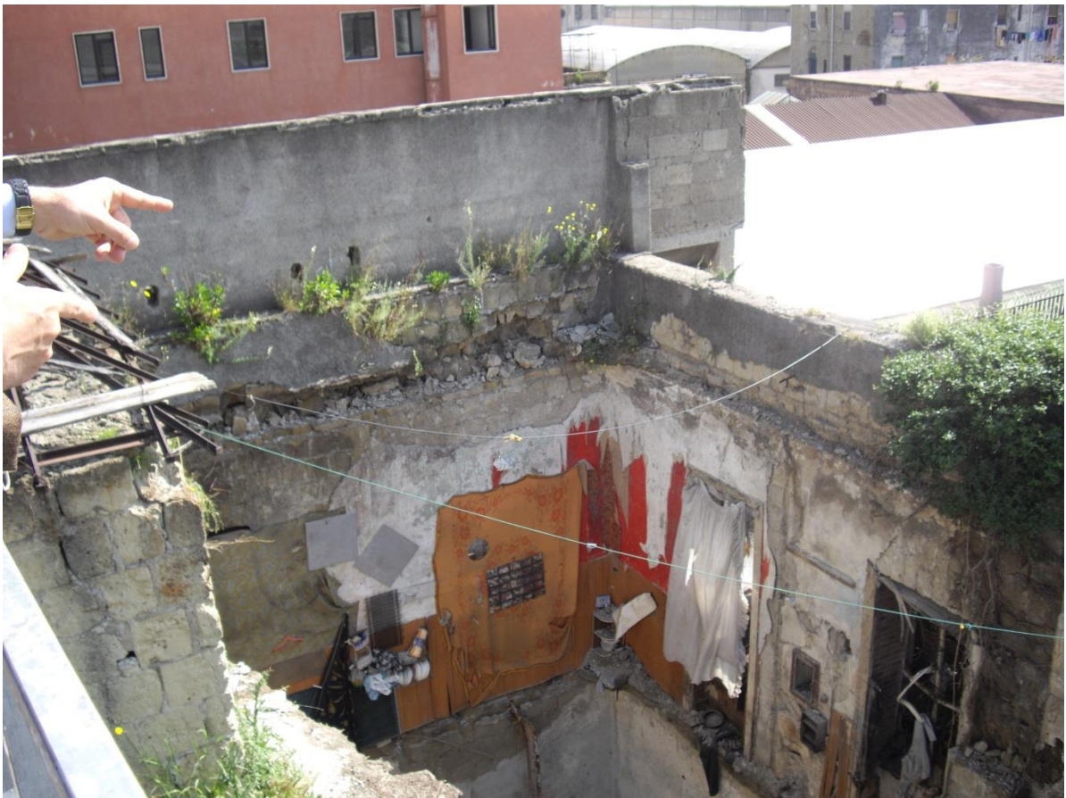
Foto 2 tav.G02B Vista dall'alto della palazzina lato uffici in parte con tetto crollato