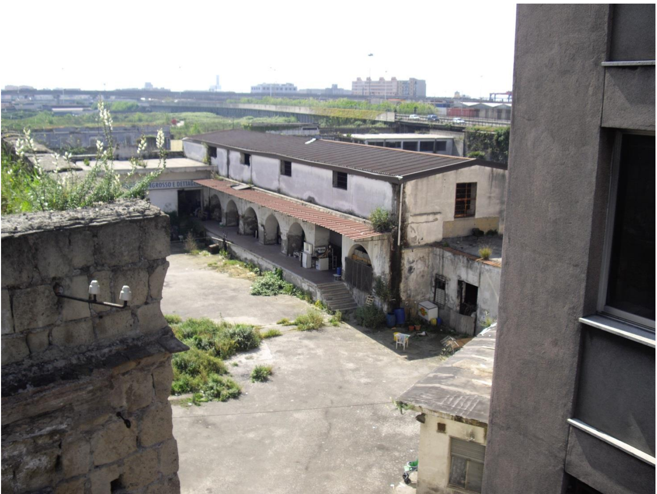
Foto 5 tav.G02B Vista dall'alto