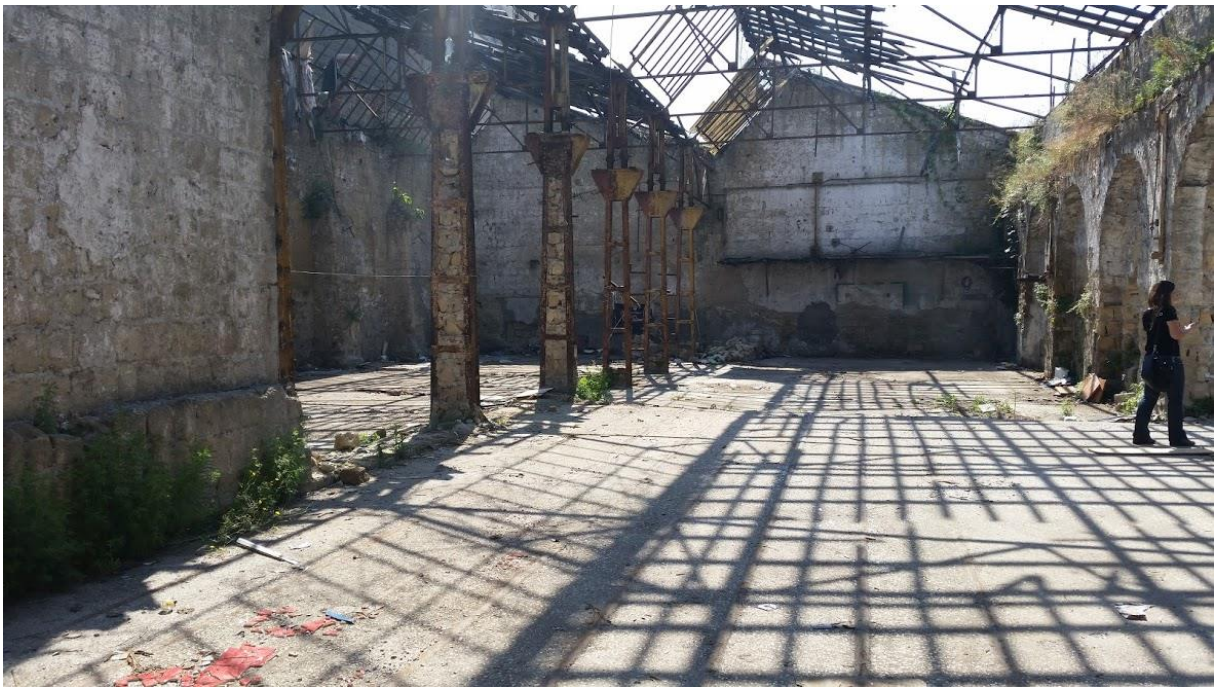
Foto 7 tav.G02A Vista capannone lato destro