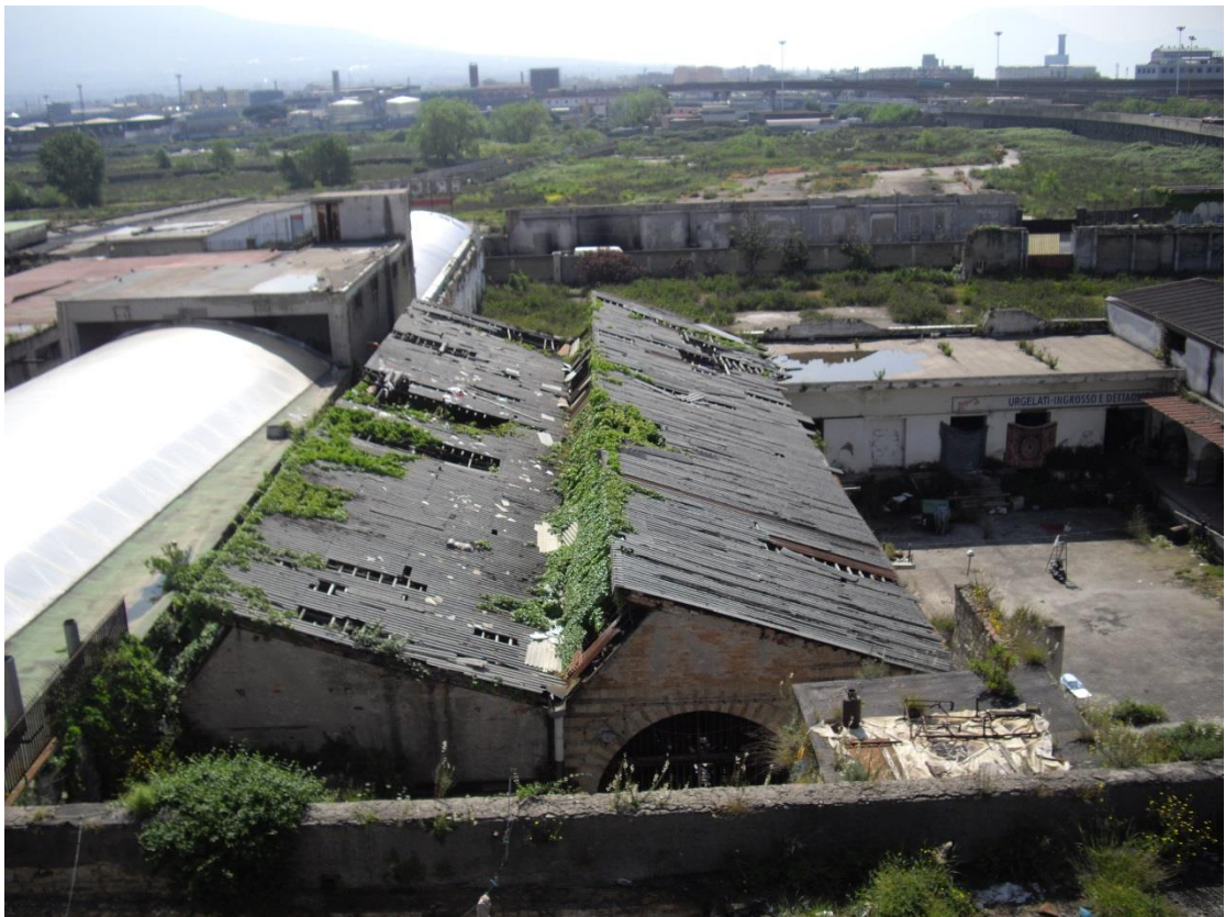
Foto 3 tav.G02B Vista della copertura dei capannoni anno 2010