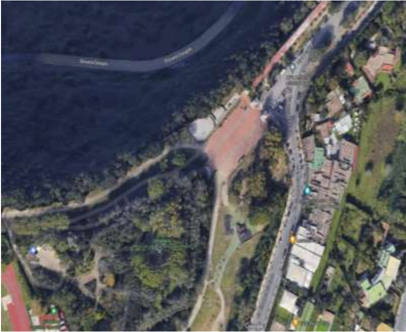
Area di Ingresso al Parco Virgiliano con ubicazione del Portale di Ingresso

Servizio Progettazione e Gestione Grandi Parchi Urbani