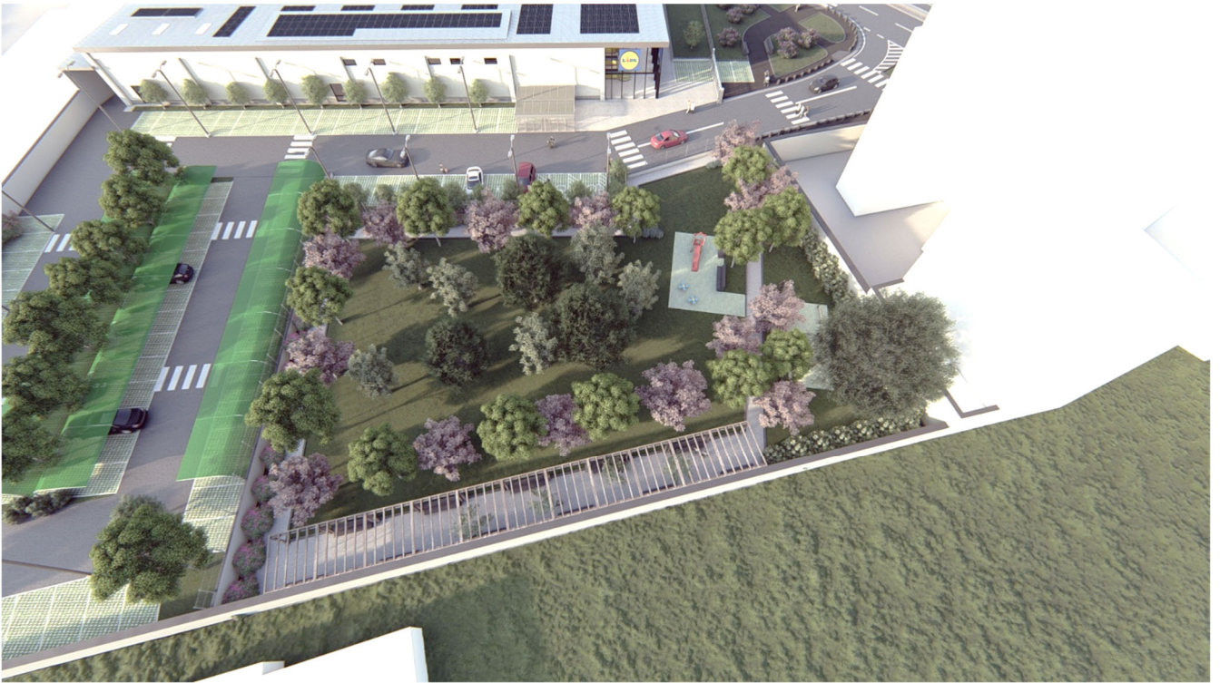
Vista a volo d'uccello del giardino attrezzato