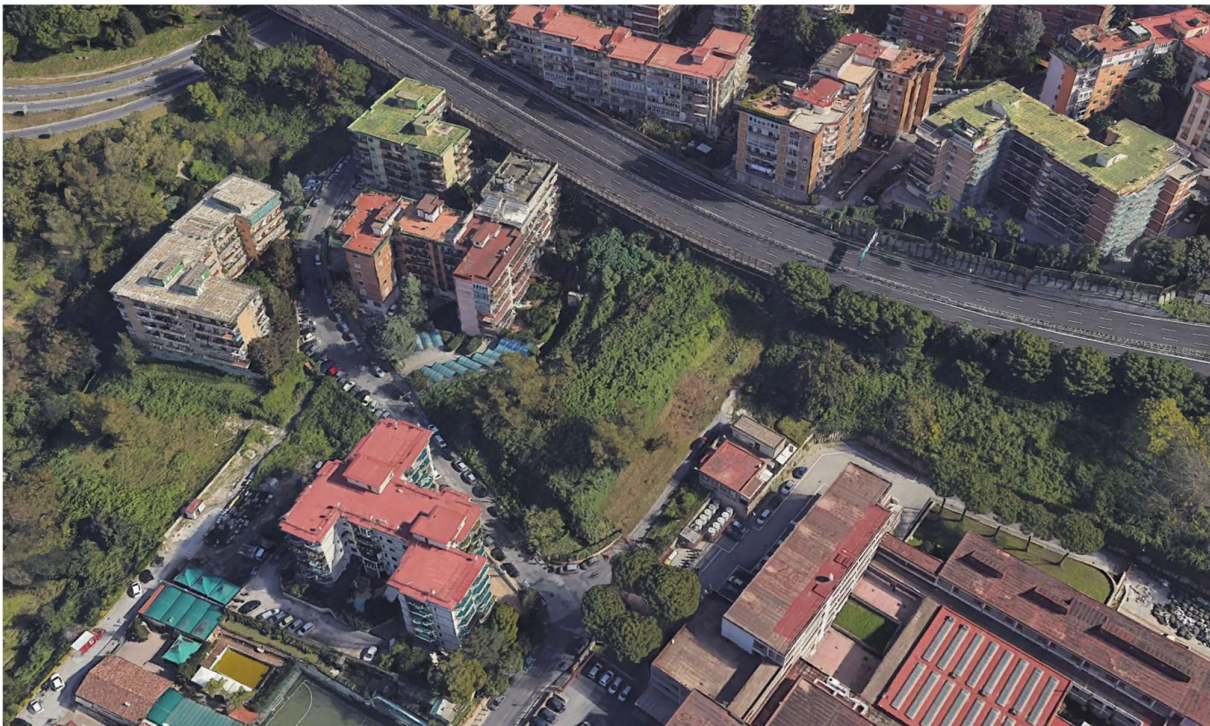
VISTA DI PROGETTO 07 – FOTOINSERIMENTO A SCALA URBANA CON COMPARAZIONE DELLO STATO DEI LUOGHI