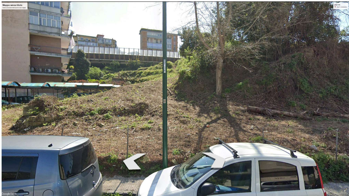
VISTA DI PROGETTO 05 – FOTOINSERIMENTO PROSPETTO PRINCIPALE SU VIA SAN DOMENICO CON COMPARAZIONE DELLO STATO DEI LUOGHI