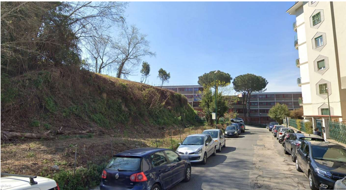
VISTA DI PROGETTO 04 – FOTOINSERIMENTO PROSPETTO PRINCIPALE SU VIA SAN DOMENICO CON COMPARAZIONE DELLO STATO DEI LUOGHI