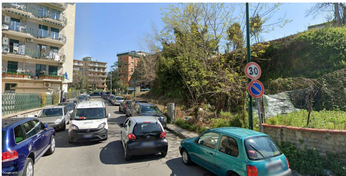
VISTA DI PROGETTO 01 – FOTOINSERIMENTO PROSPETTO PRINCIPALE SU VIA SAN DOMENICO CON COMPARAZIONE CON LO STATO DEI LUOGHI