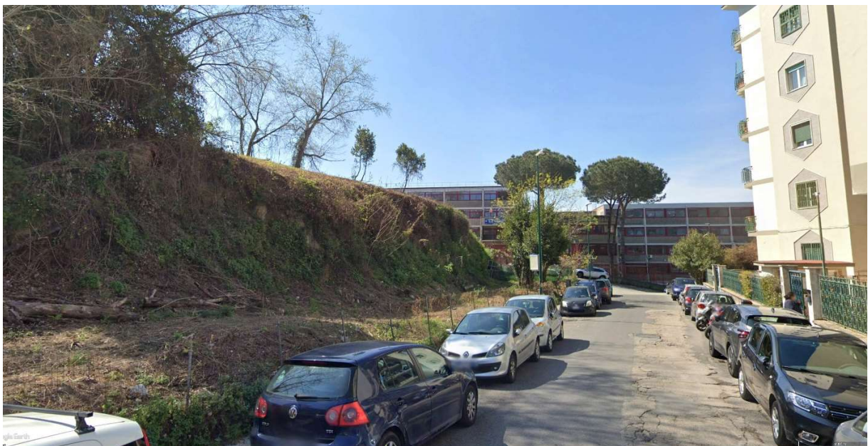
VISTA DI PROGETTO 02 – FOTOINSERIMENTO PROSPETTO PRINCIPALE SU VIA SAN DOMENICO DOMENICO CON COMPARAZIONE CON LO STATO DEI LUOGHI