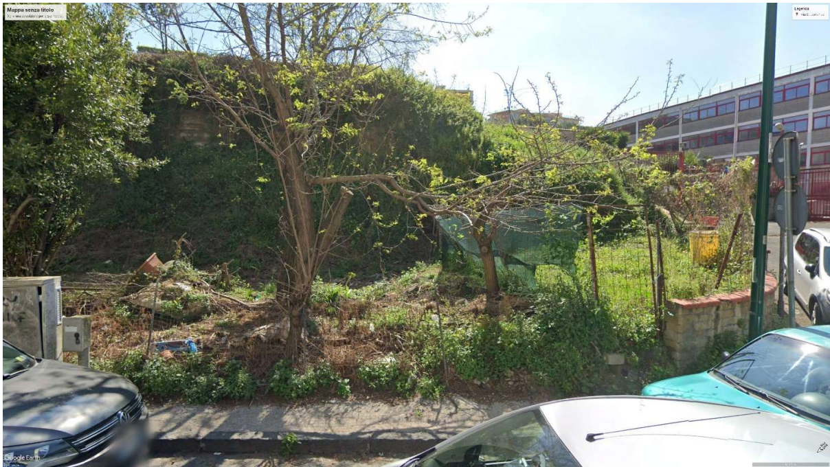
VISTA DI PROGETTO 06– FOTOINSERIMENTO A SCALA URBANA CON COMPARAZIONE DELLO STATO DEI LUOGHI