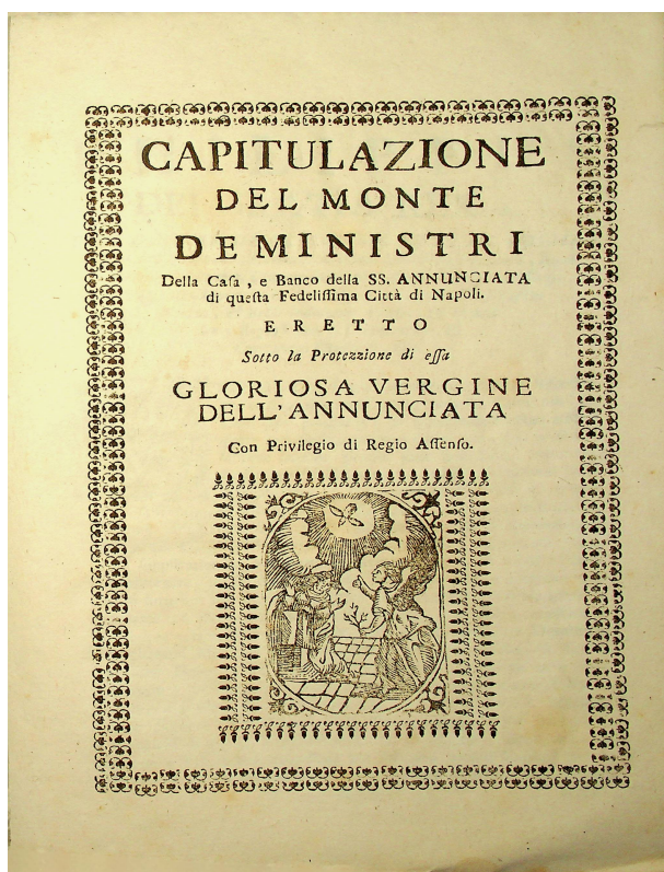
Immagine 01: Capitolazione del Monte dei Ministri

Nel 1663 alcuni impiegati della Casa Santa e del Banco di Ave Gratia Plena decisero di costituire un Monte il cui scopo era quello di soccorrere gli associati in caso di malattia, vecchiaia, carcerazione e altro, oltre a garantire, in caso di morte, la sepoltura con funerali sfarzosi 1 .