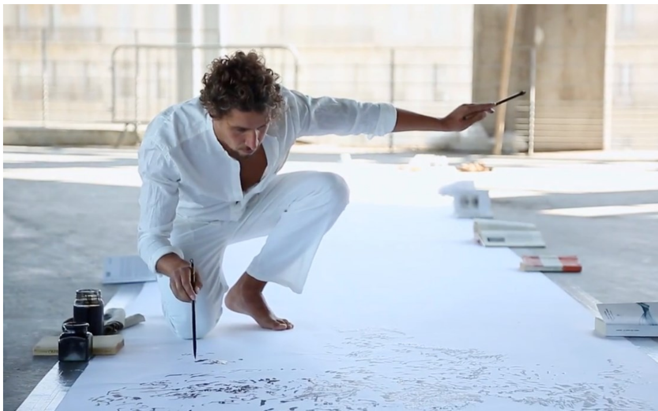
International Drawing Exhibition, Paredolie , Marseille, France, 2018

I suoi lavori sono stati presentati in musei, fondazioni e spazi espositivi tra cui il MEP (Maison Européenne de la Photographie), Espace Topographie de L'Art - Paris, Analix Forever Gallery - Geneva, Weisser Elefant Gallery - Berlin, Pareidolie Salone Internazionale del Disegno - Marsiglia, Care of DOCVA - Milan, Merz Foundation - Turin, Madre Museum and Palazzo delle Arti - Naples, Station Beirut - Beirut, Castello Svevo - Bari.