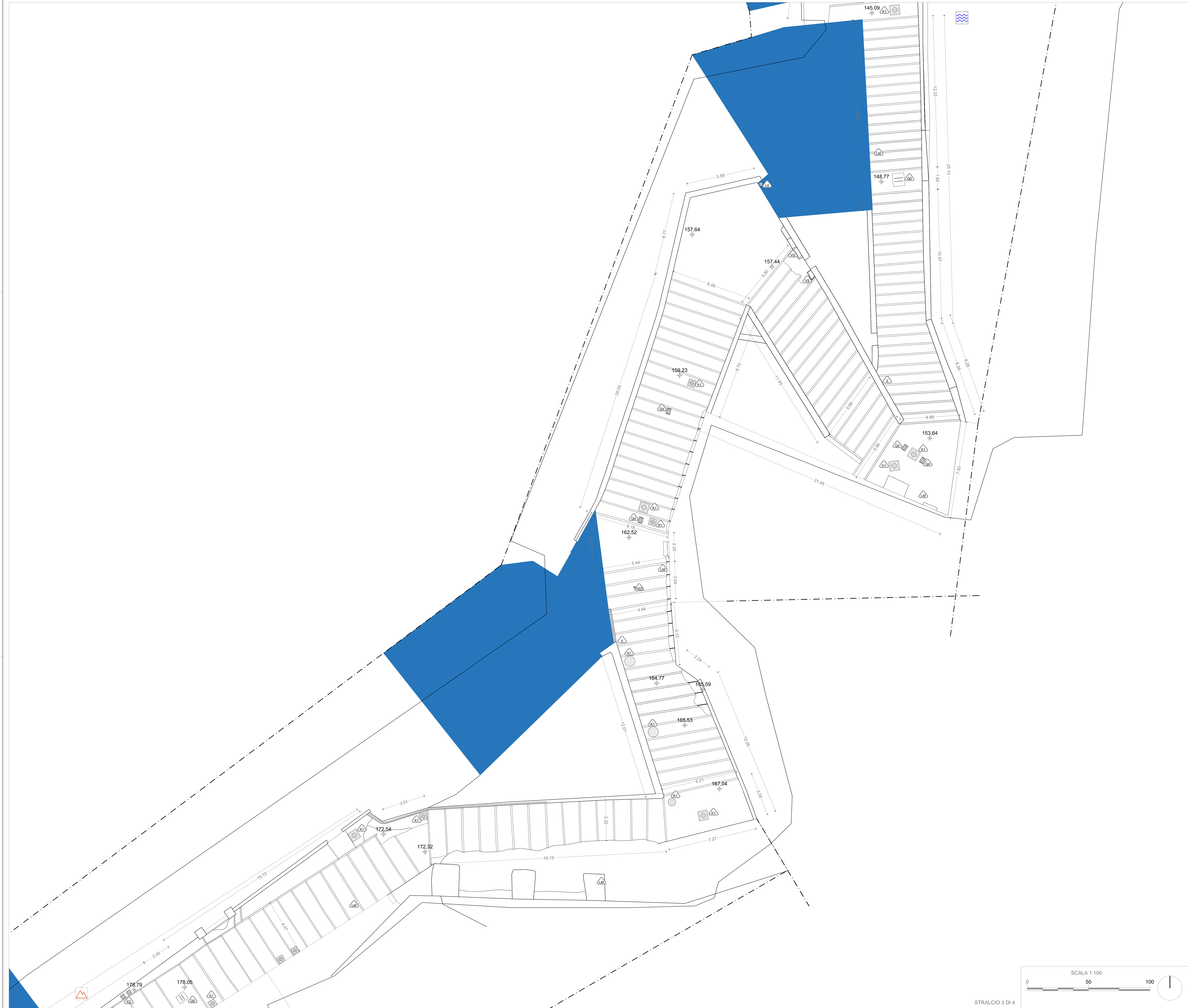
STRALCIO 3 DI 4