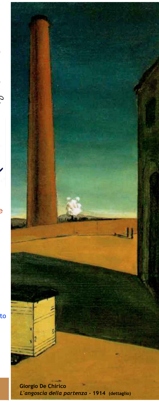
Giorgio De Chirico L'angoscia della partenza - 1914 (dettaglio)