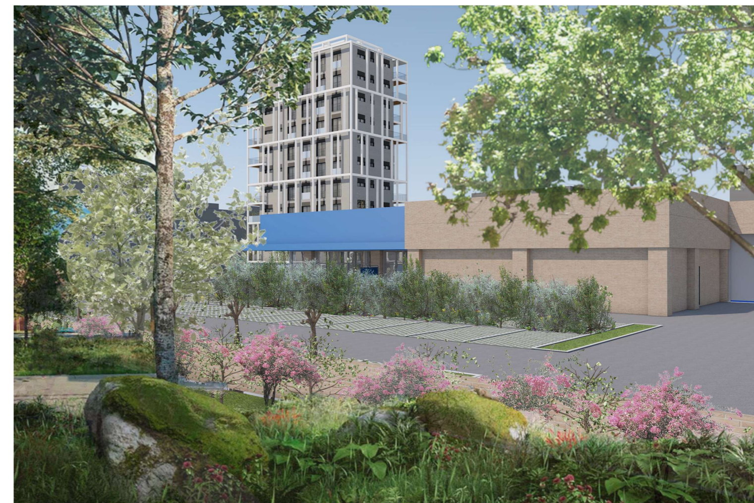
Vista dell'area d'intervento dalla foresta urbana