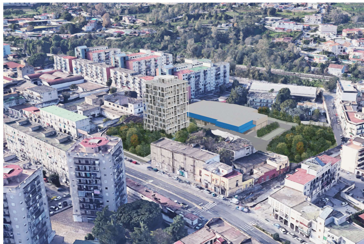
Vista a volo d'uccello da Via della stadera