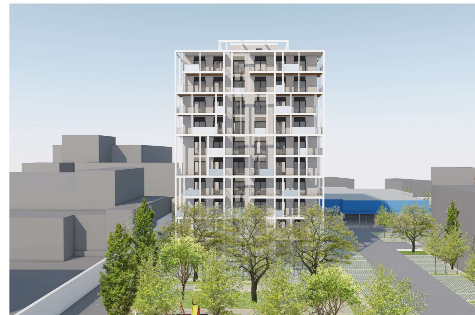
Prospetto principale edificio residenziale da Via della stadera