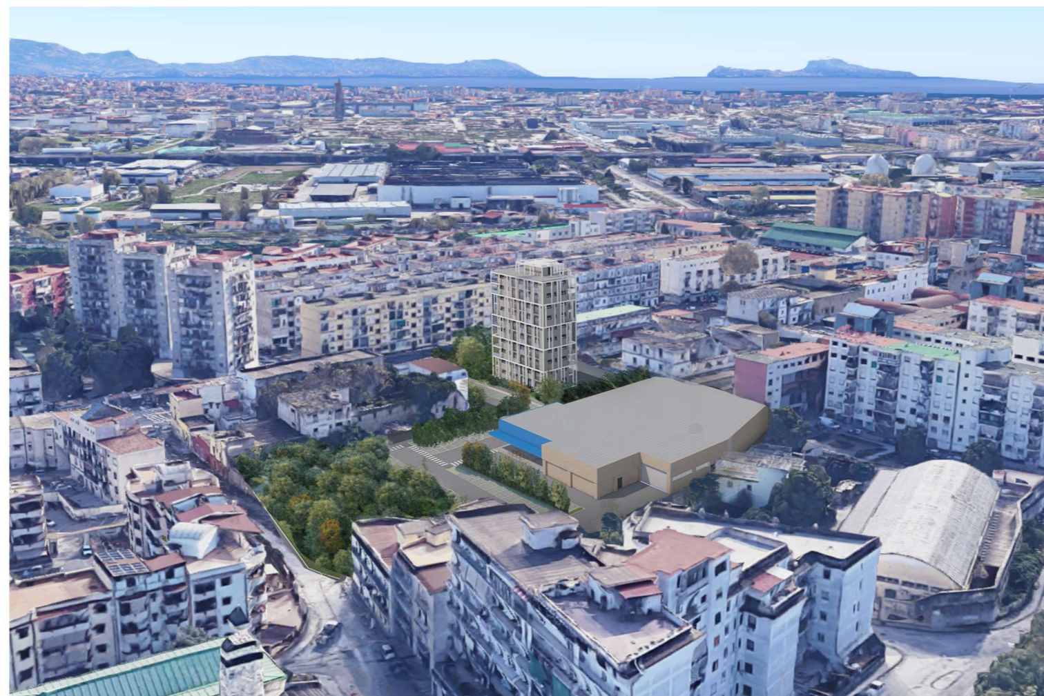
Vista a volo d'uccello da Via cupa del principe