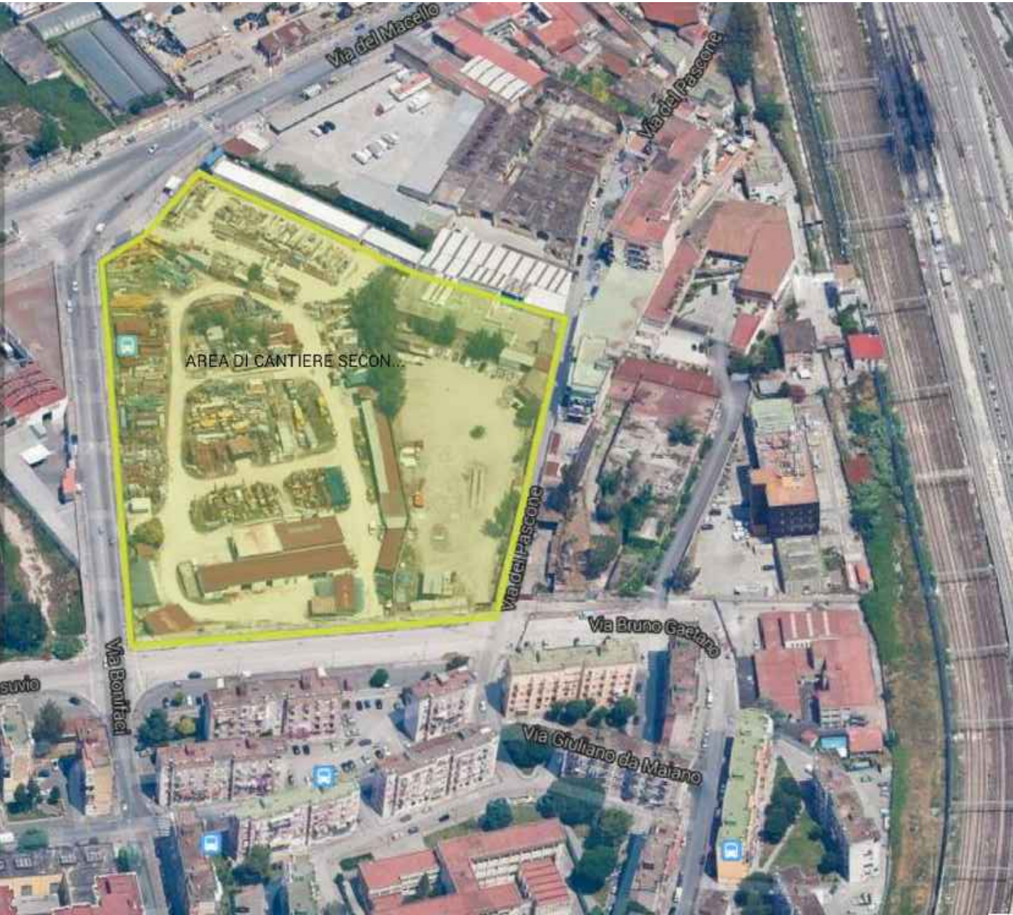
AREA DI CANTIERE SECONDARIO IN VIA DEL MACELLO