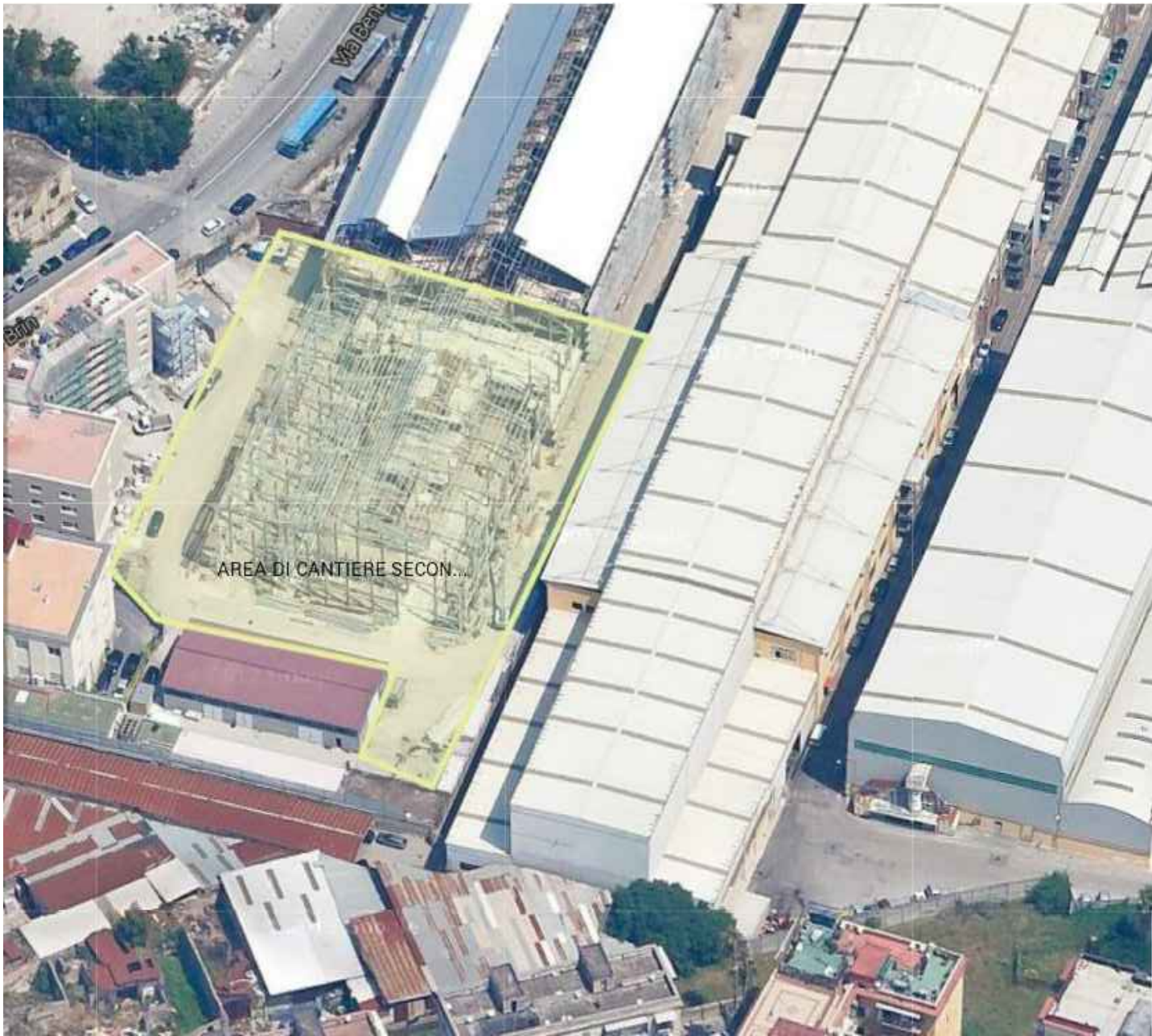
AREA DI CANTIERE SECONDARIO IN VIA B. BRIN