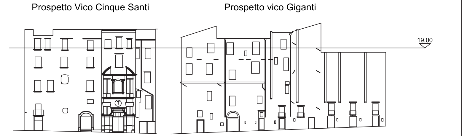
NAVIGATORE (Scala 1:500)