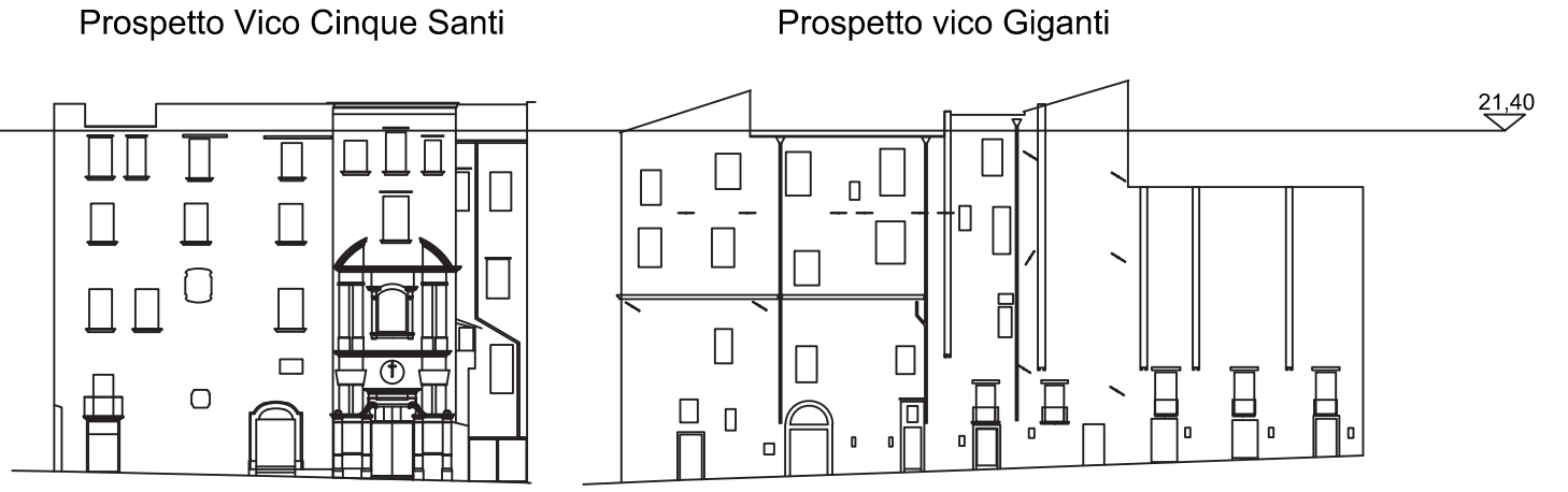
NAVIGATORE (Scala 1:500)