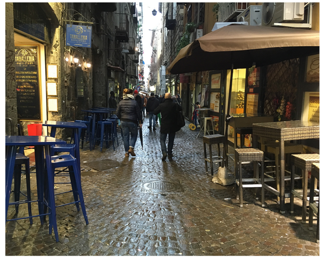
Via San Biagio dei Librai, occupazioni di suolo con elementi di arredo non omogenei.