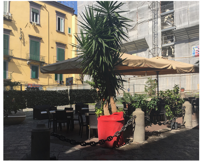
Piazza dei Girolamini, installazione che invade il sagrato della Chiesa dei Gerolomini