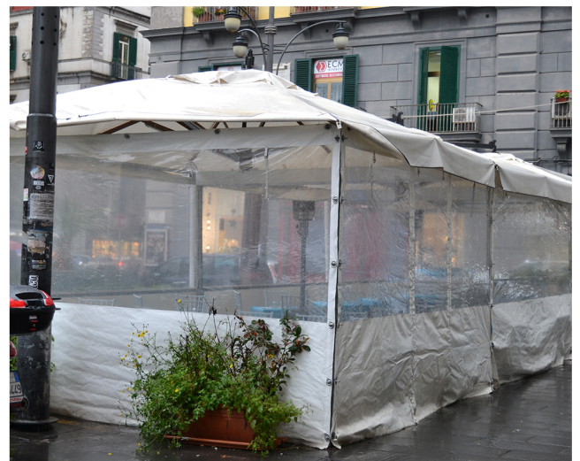
Piazza Dante, chiusura del dehor con teli in PVC