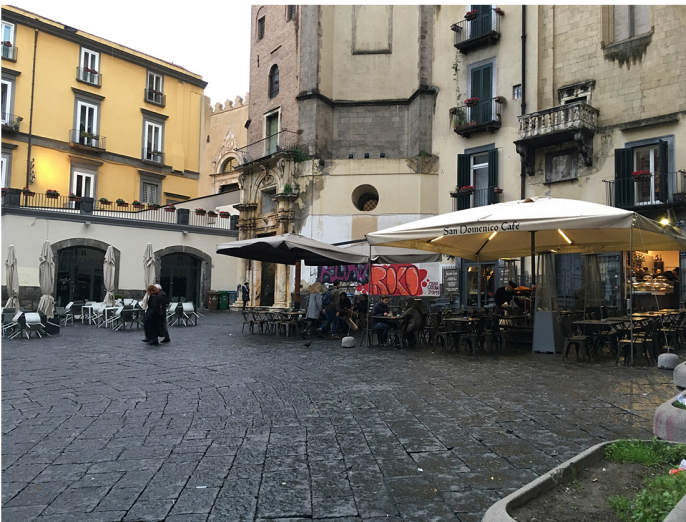
Piazza San Domenico Maggiore, dehors diversi per tipologia di arredo