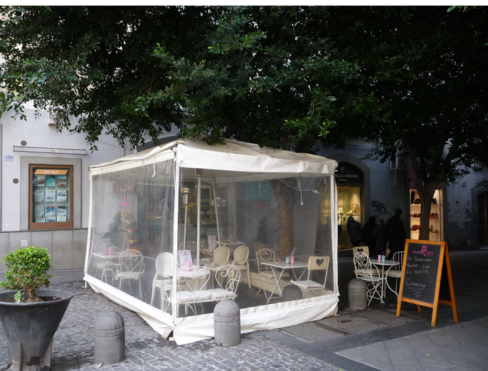
Via Chiaia, chiusura del dehor con teli in PVC