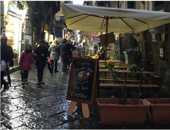
Via Maddaloni, dehor che ostruisce la percezione dello scorcio iniziale di Spaccanapoli