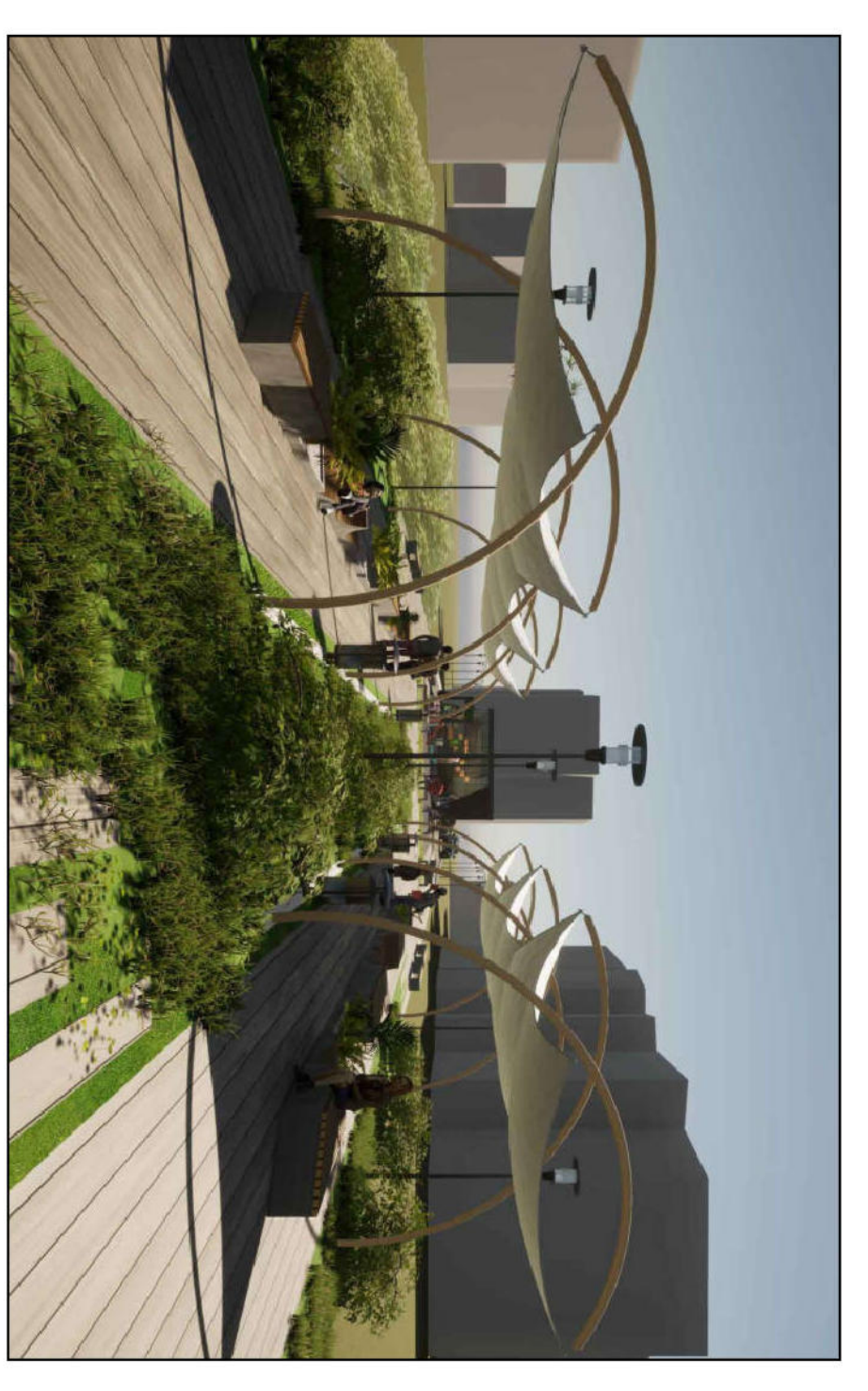
- METRO LINE FIVE PARK -

Planimetria di inquadramento - Scala 1:1'000 Area dedicata al progetto "Metro line five park" Area dedicata al progetto per la realizzazione di area mercatale