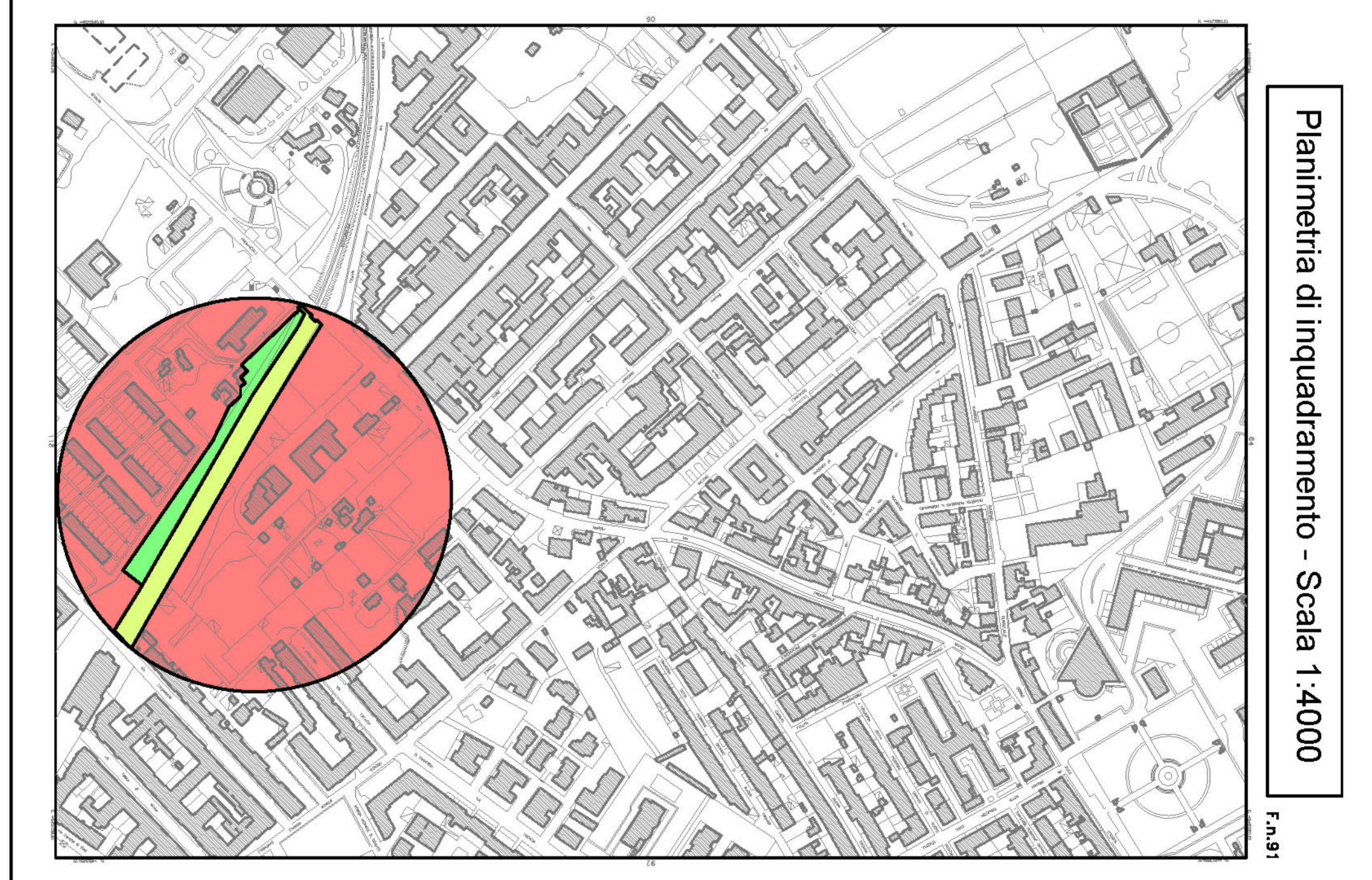
Planimetria di inquadramento - Scala 1:4'000