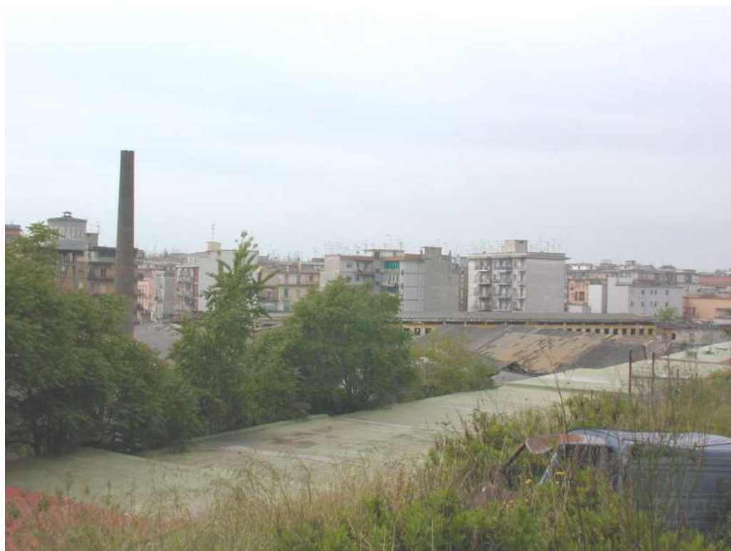
IL FABBRICATO DI VIA RAMPE DEL CAMPO VISTO DA VIA DON BOSCO