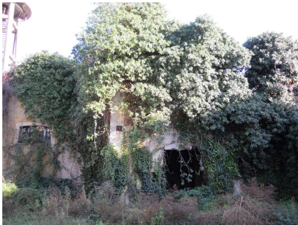
E—Corpi di fabbrica a destra dell'ingresso