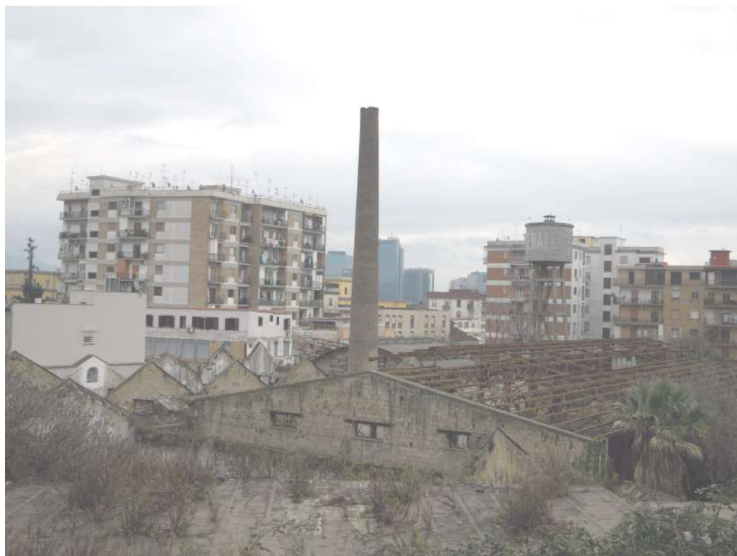
VISTA DA VIA DON BOSCO