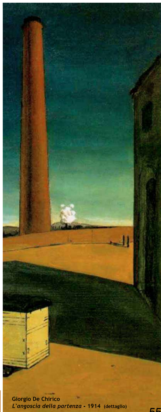
Giorgio De Chirico L'angoscia della partenza - 1914 (dettaglio)

Il progetto di rigenerazione della fabbrica supera il tempo che segna le cose e la delusione dell'abbandono e costruisce, in questa parte della città, una nuova bellezza.