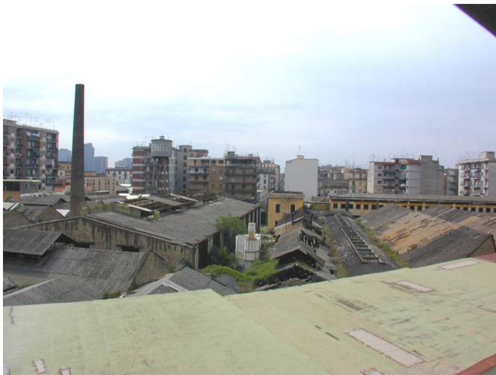
VISTA DA VIA DON BOSCO