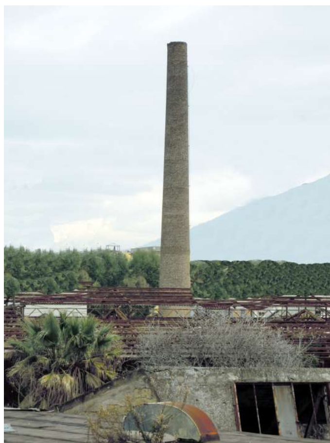
La grande ciminiera in mattoni