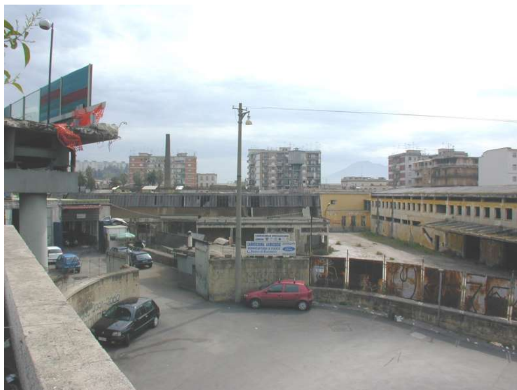
VISTA DA RAMPE DEL CAMPO