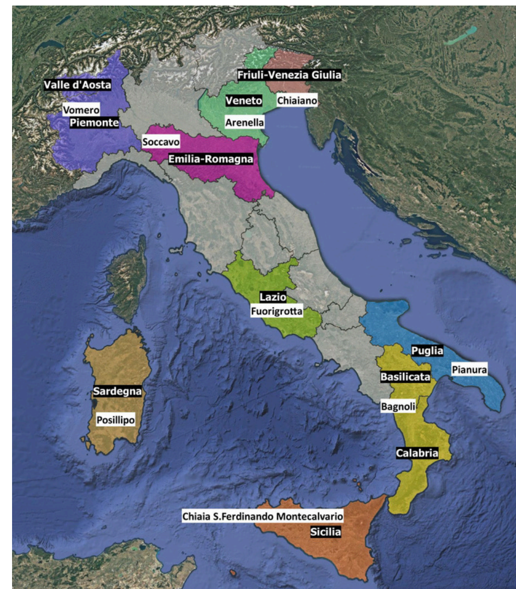
Mappa gemellaggi Quartieri/Regioni

Sono compresi in zona rossa anche i comuni di Pozzuoli, Bacoli, Monte di Procida e Quarto, parte dei Comuni di Giugliano in Campania e di Marano di Napoli.