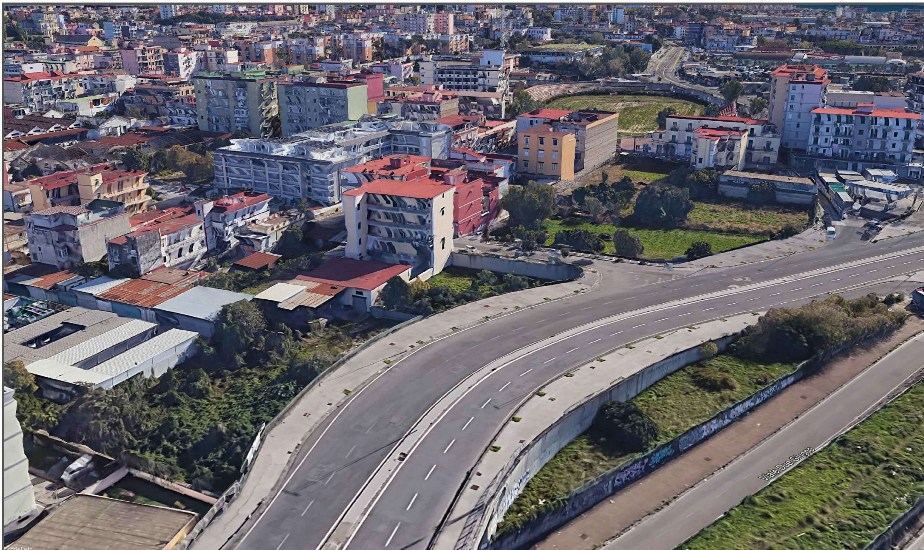
VISTA A VOLO D'UCCELLO LATO NORD - AREA D'INTERVENTO -