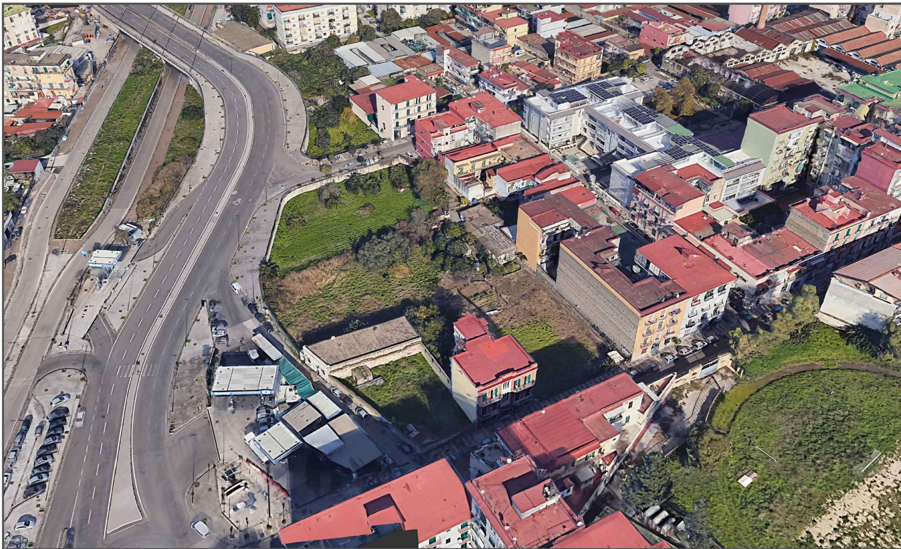
VISTA A VOLO D'UCCELLO LATO SUD - AREA D'INTERVENTO -