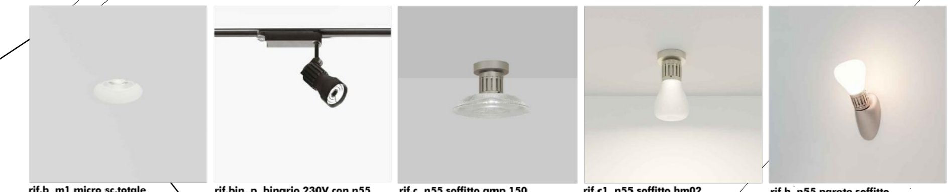
ref.b. m1 micro sc.totale ref.bin.p. binario 330V con n55 ref.c. n55 soffitto amp 150 ref.c1 n55 soffitto hm02 ref.h. n55 parete soffitto

COORDINATORE DELLA PROGETTAZIONE ARCHITETTO GIUSEPPE VELE