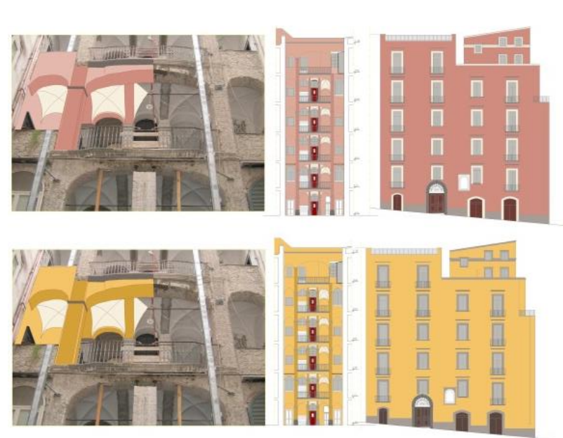
Condominio di Salita Stella 21, 80135 - Napoli.