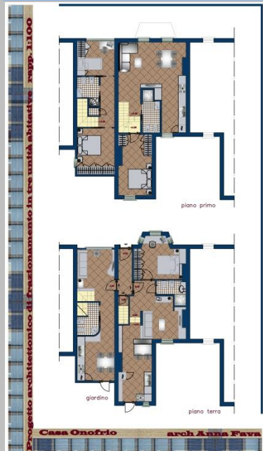
Una casa a Londra