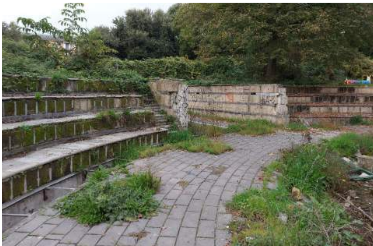
Parco - Cono ottico 7