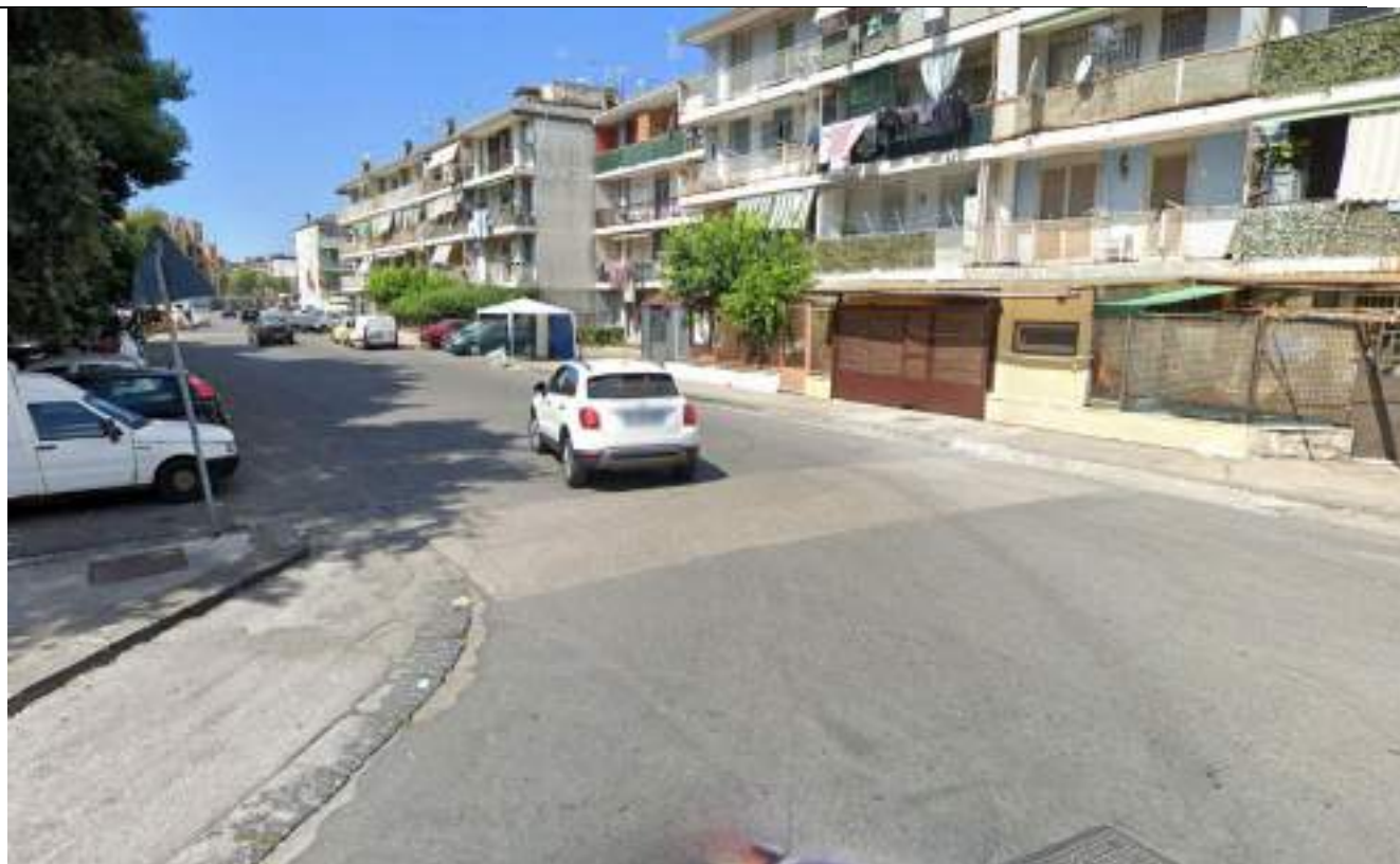
Cono Ottico 7- Vista strada a nord del Parco