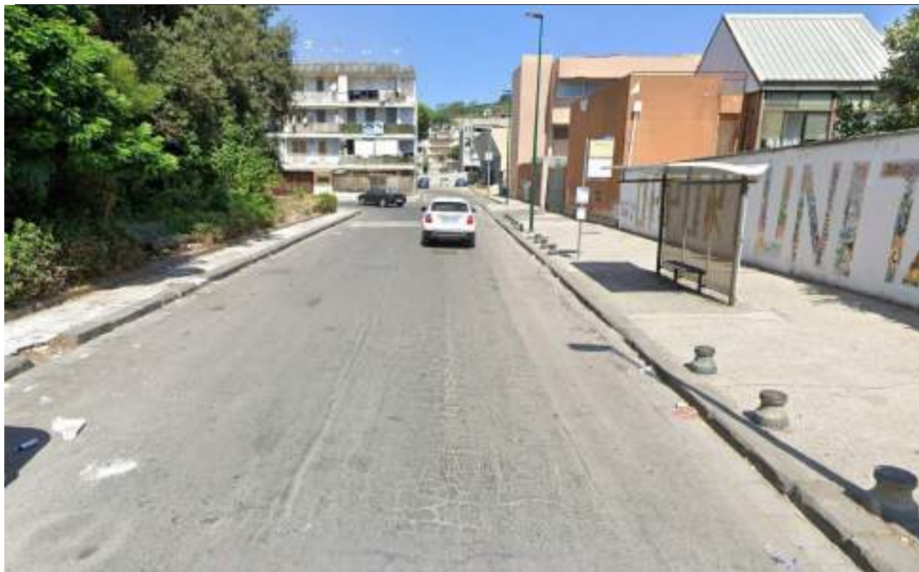
Cono Ottico 9 - Vista fermata bus lato est del Parco