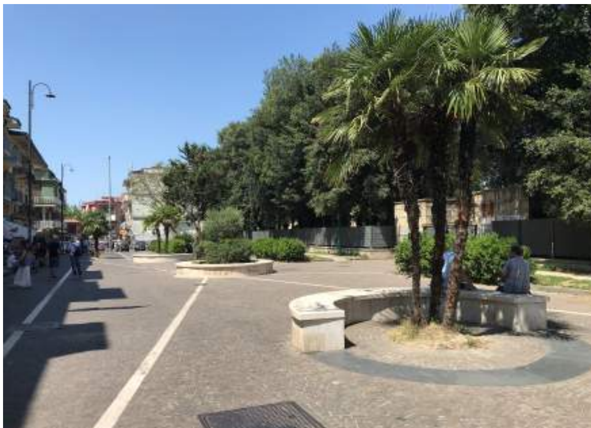
Cono Ottico 20 - Vista piazzetta a sud del Parco