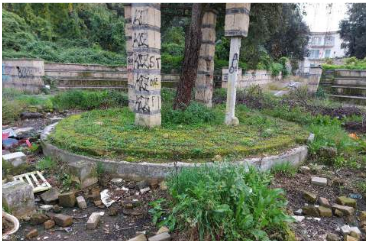
Parco - Cono ottico 8 – Dettaglio arena centrale