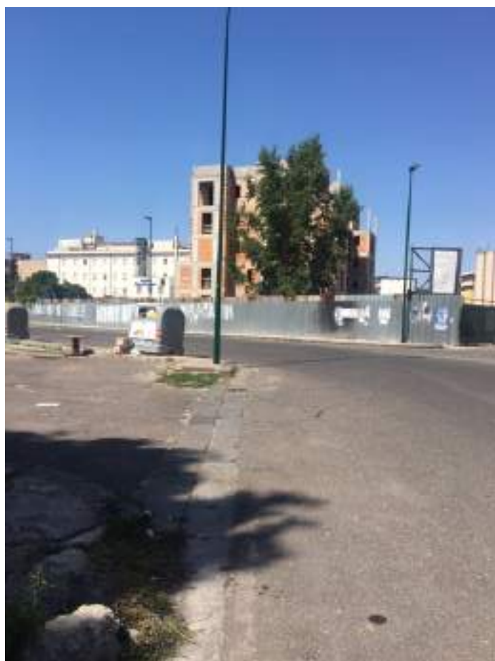
Cono Ottico 4 - Vista strada nord del Parco