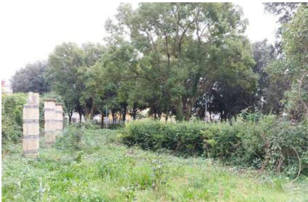
Parco - Cono ottico 1