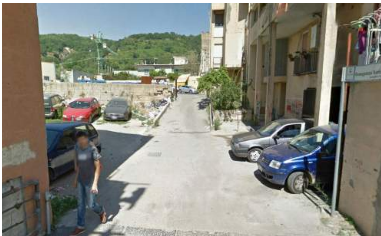
Cono Ottico 16 - Vista tratto finale viabilità est