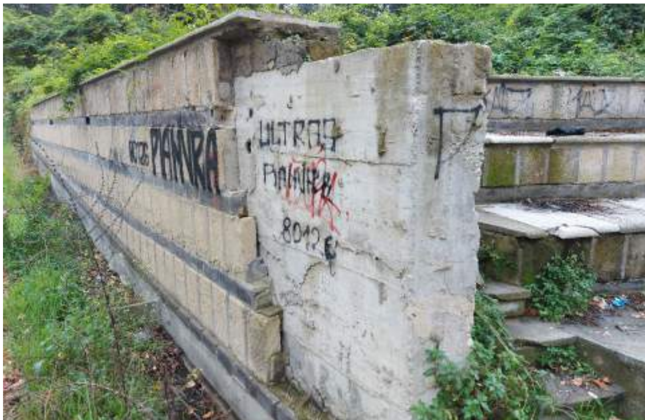
Parco - Cono ottico 5 – Dettaglio distacco rivestimento