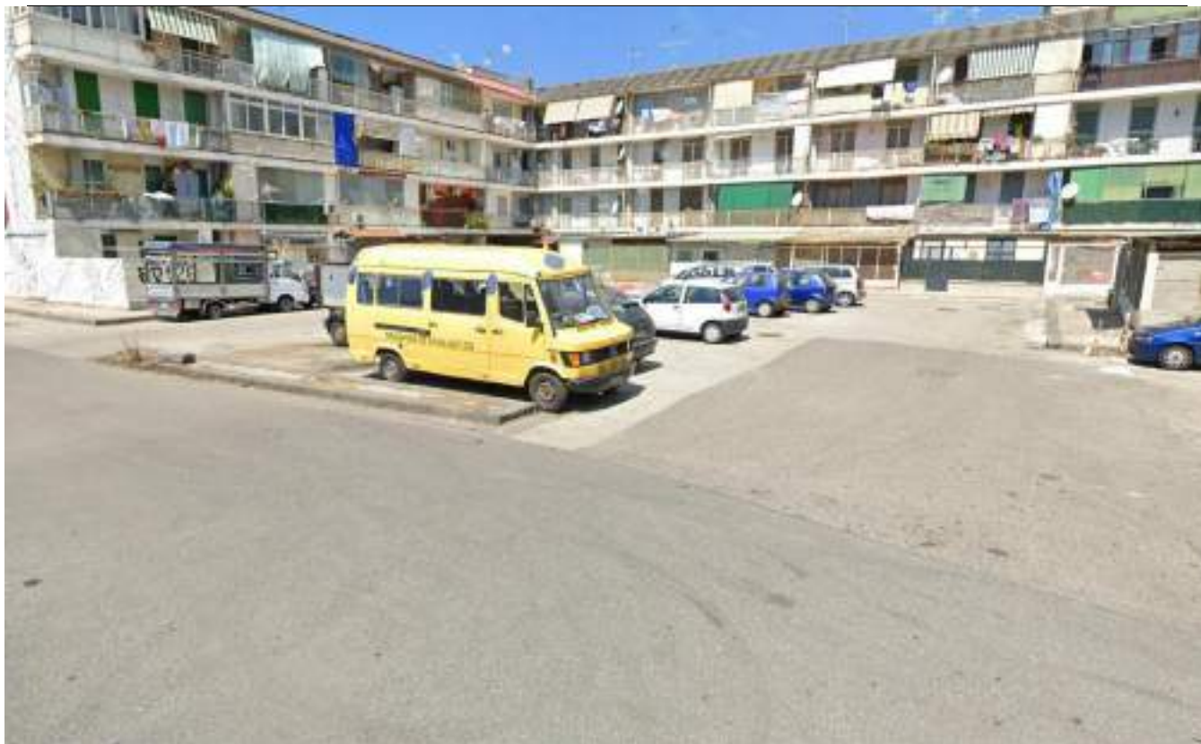
Cono Ottico 5 - Vista area parcheggio lato nord del Parco