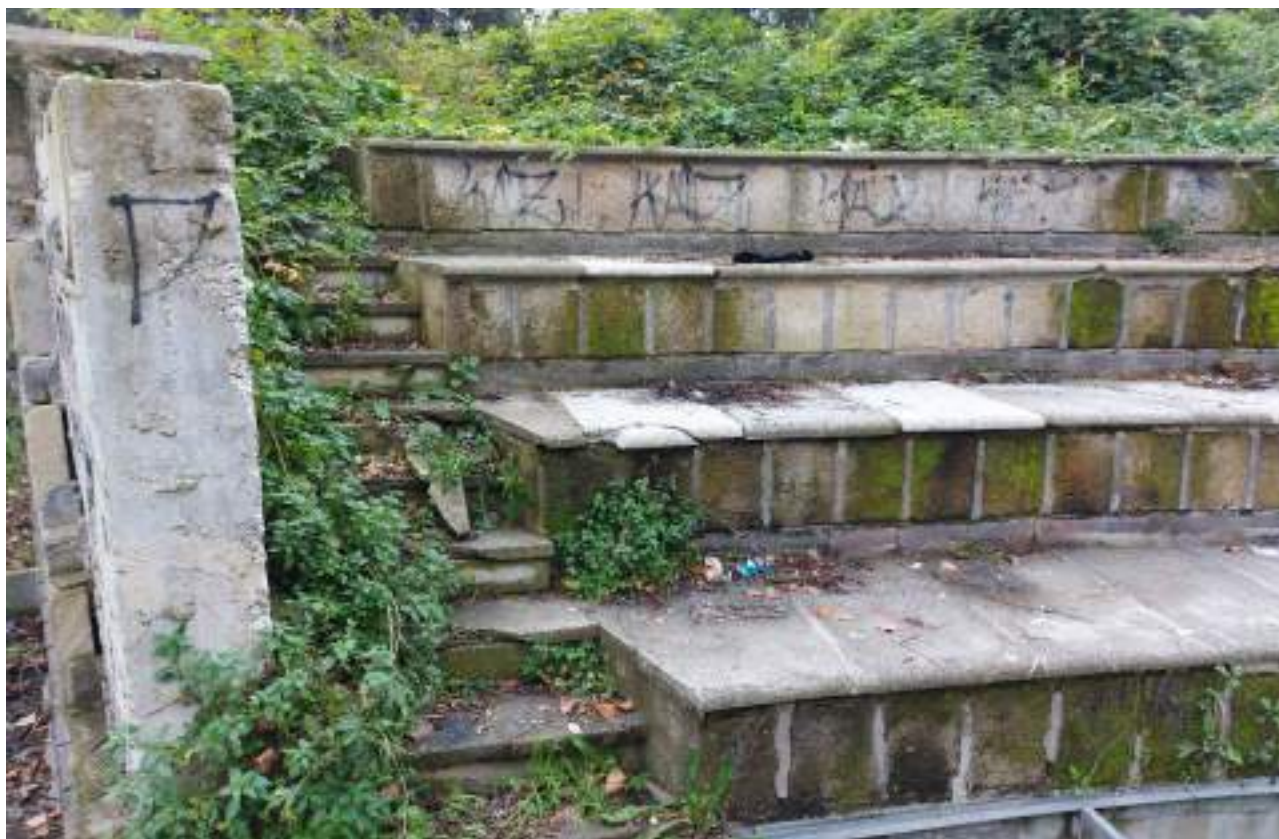
Parco - Cono ottico 6 – Dettaglio danneggiamento rivestimento in pietra