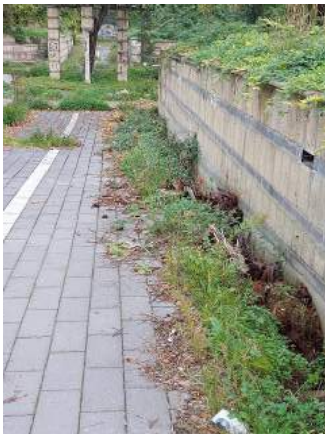
Parco - Cono ottico 3