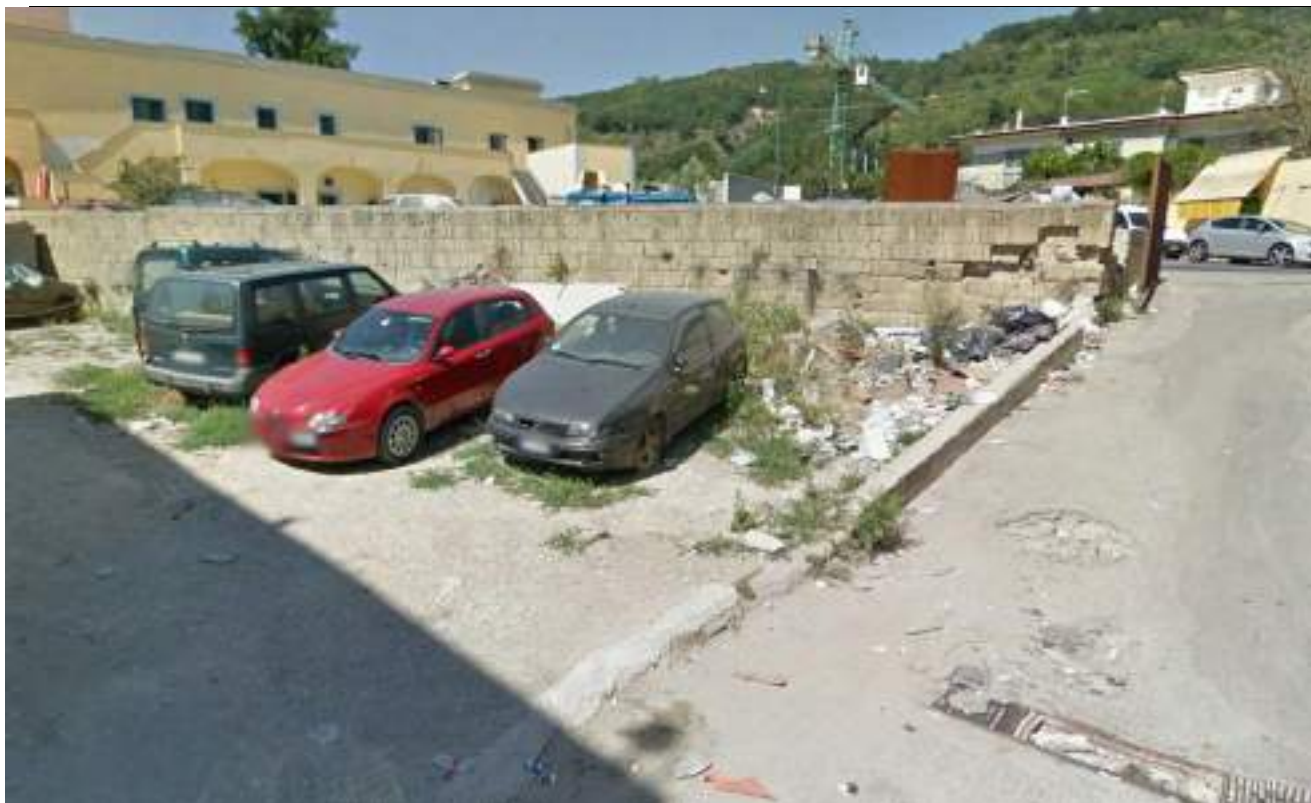
Cono Ottico 17 - Vista tratto finale viabilità est