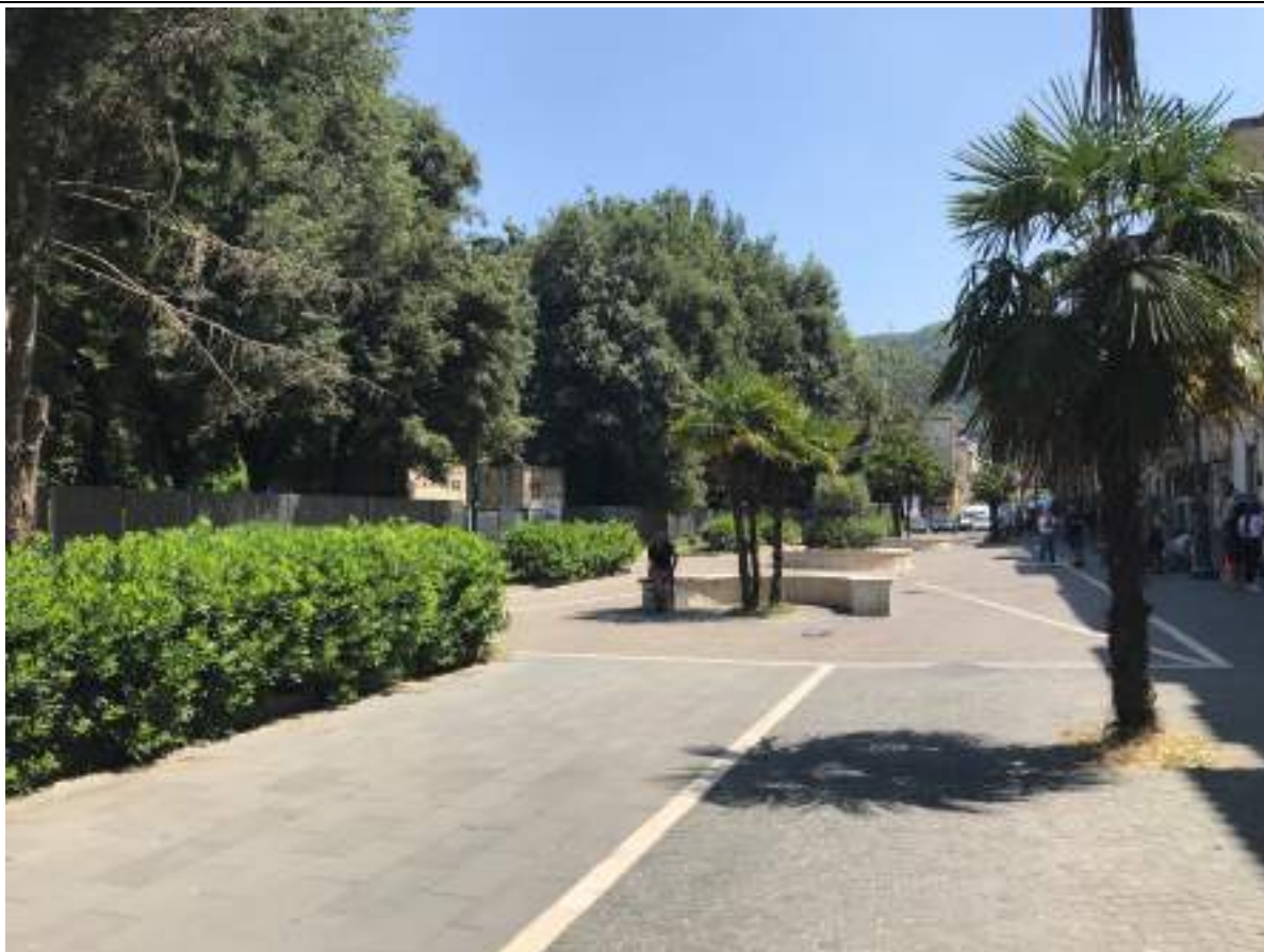
Cono Ottico 21 - Vista piazzetta a sud del Parco