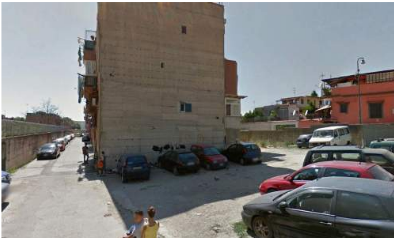
Cono Ottico 17 - Vista tratto finale viabilità est