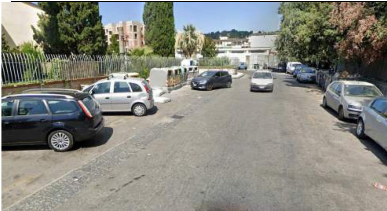
Cono Ottico 1 - Vista fermata bus lato ovest del Parco