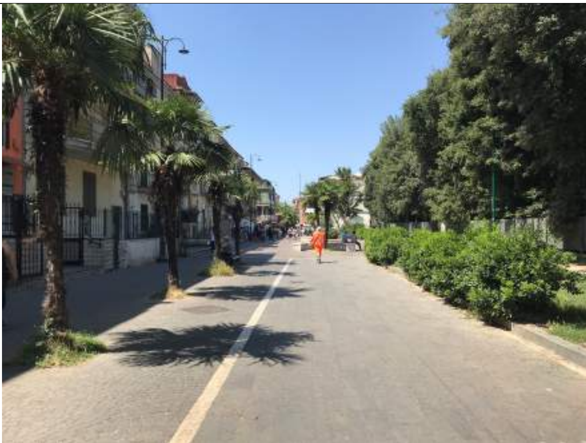
Cono Ottico 19 - Vista piazzetta a sud del Parco