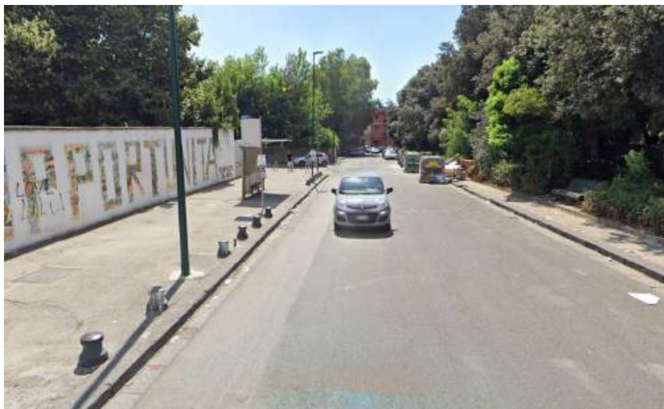
Cono Ottico 8 - Vista fermata bus lato est del Parco