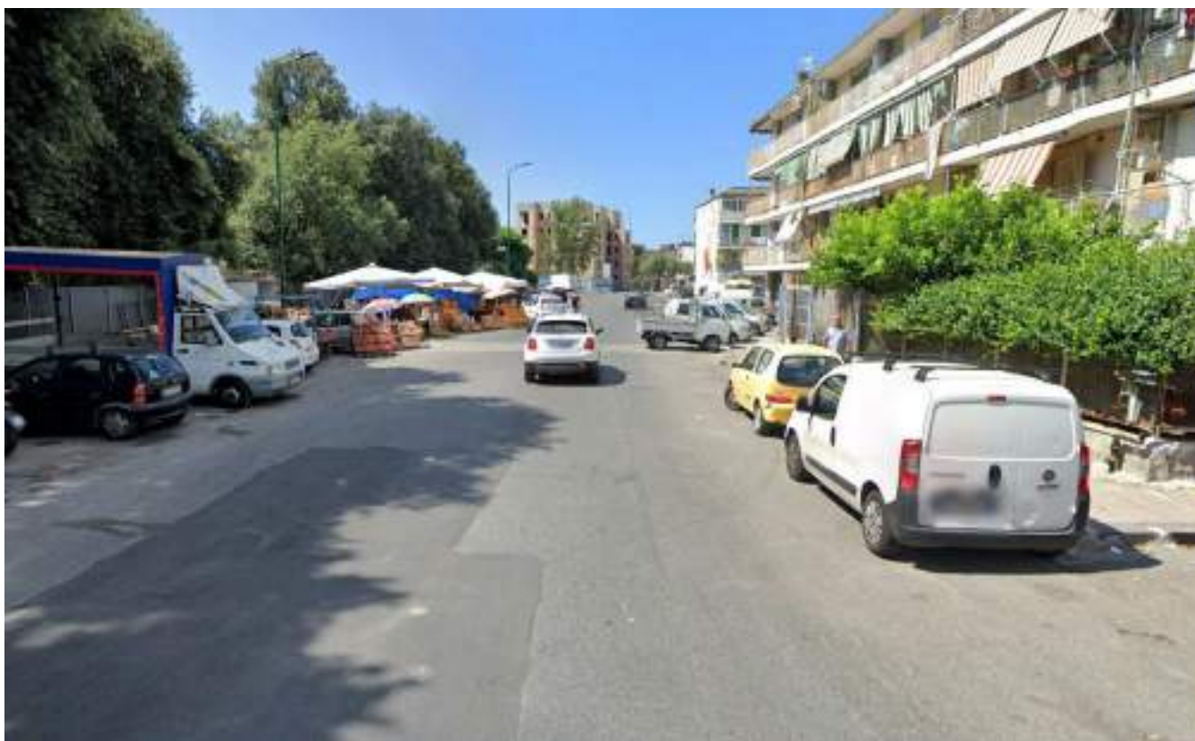
Cono Ottico 6 - Vista strada a nord del Parco