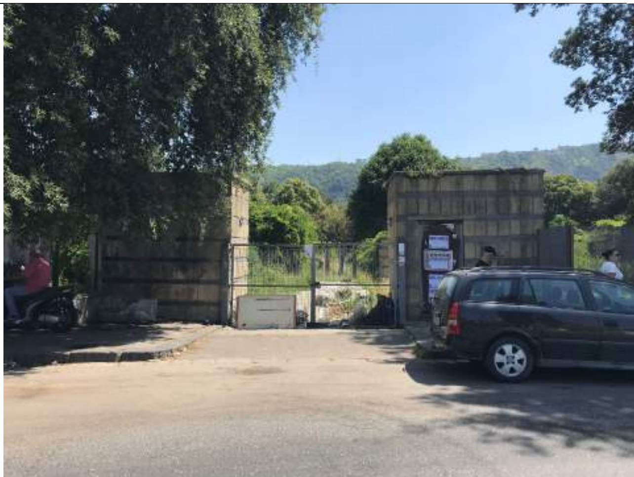
Cono Ottico 11 - Vista ingresso lato est del Parco