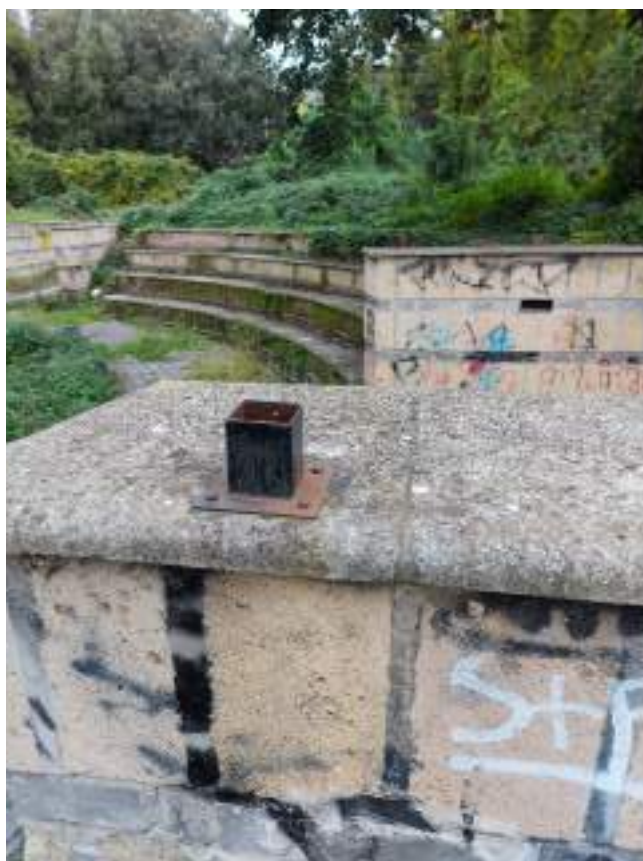
Parco - Cono ottico 4 – Dettaglio basetta di recinzione