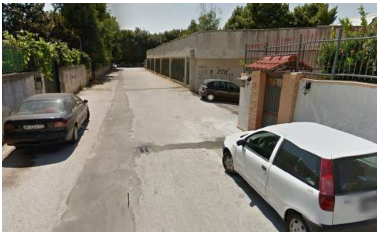
Cono Ottico 12 - Vista primo tratto viabilità est