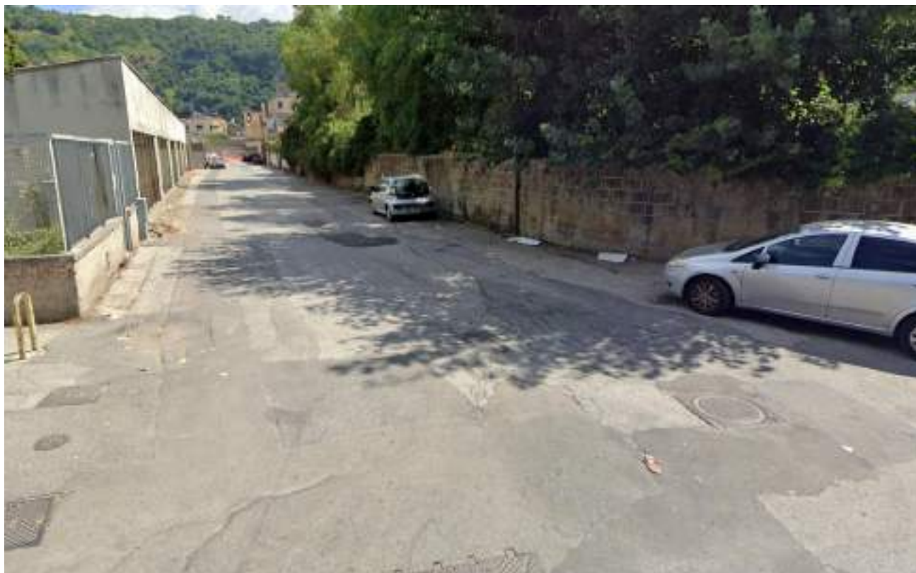
Cono Ottico 10 - Vista viabilità est