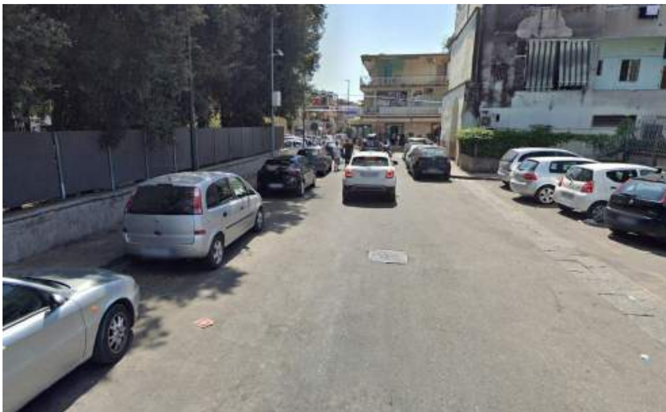
Cono Ottico 2 - Vista fermata bus lato ovest del Parco