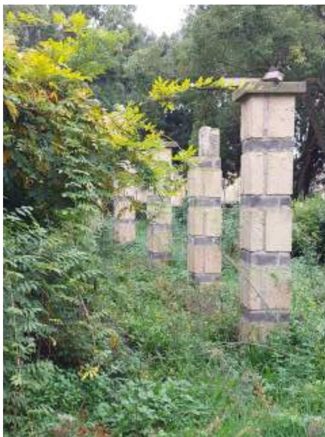
Parco - Cono ottico 2 – Dettaglio sottostruttura pergolato in legno