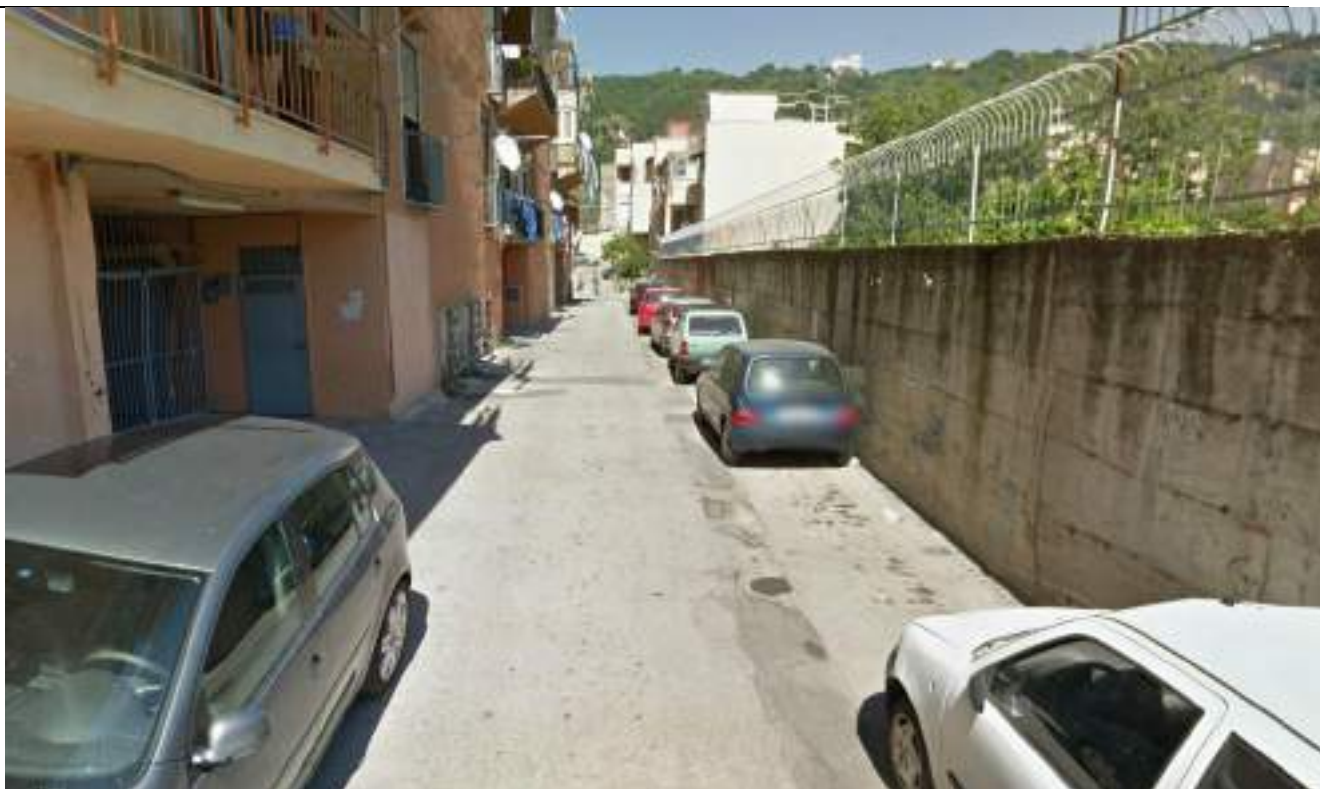
Cono Ottico 15 - Vista terzo tratto viabilità est