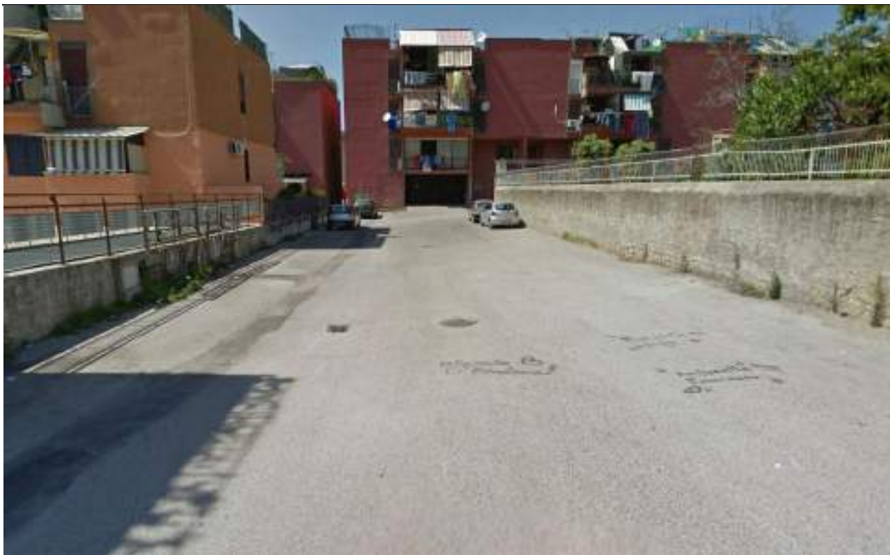
Cono Ottico 13 - Vista secondo tratto viabilità est