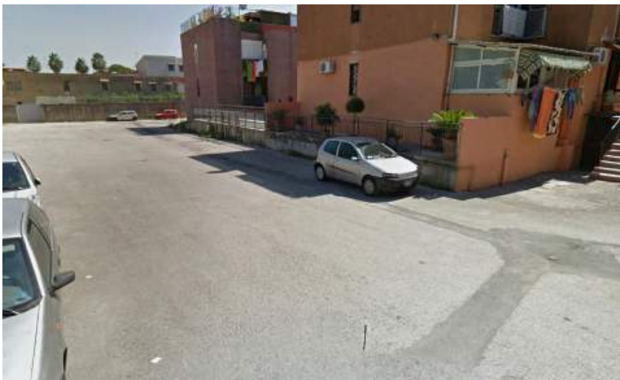
Cono Ottico 14 - Vista secondo tratto viabilità est