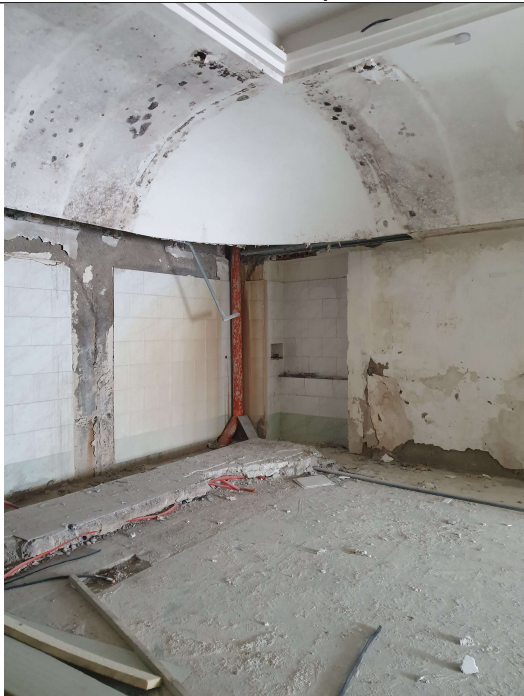
n.3 – Vista camera 1