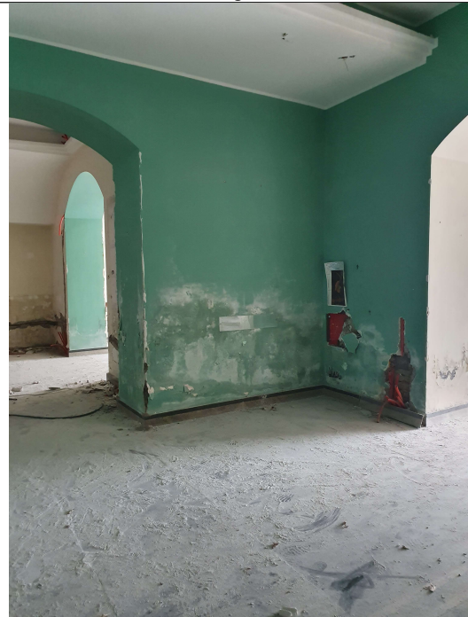
n.4 – Vista Camera 2