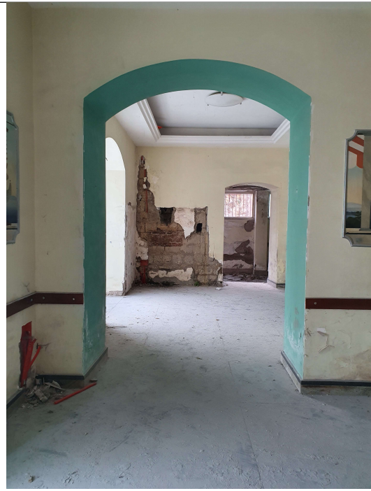
n.6 - Vista verso Camera 2