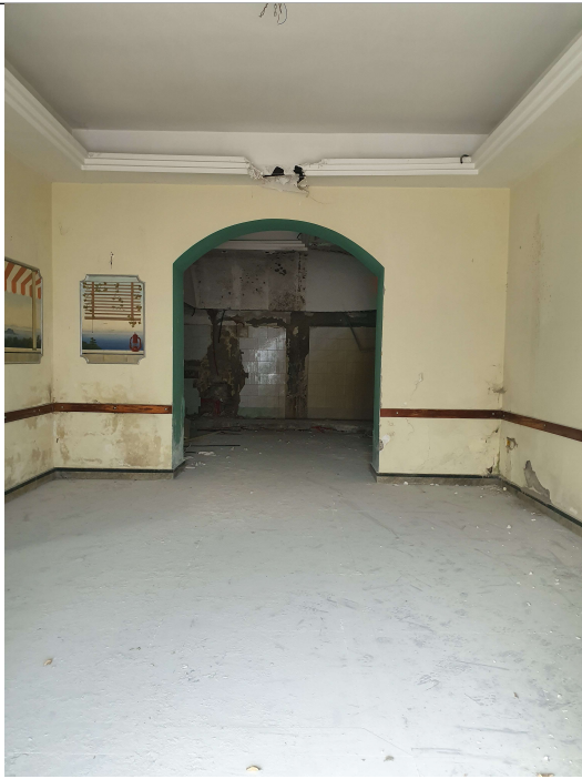
n.5 - Vista Camera 3