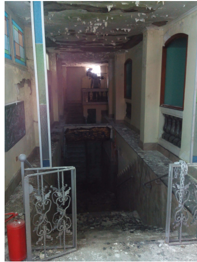
n.2 – Vista ingresso