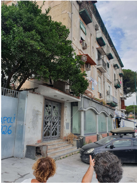
n.1 – Vista dalla via pubblica