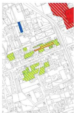
QUARTIERE BARROVA F.17 IMMOBILI DESTINATI AD ISTRUZIONE, INTERESSE COMUNE, PARCHEGGI