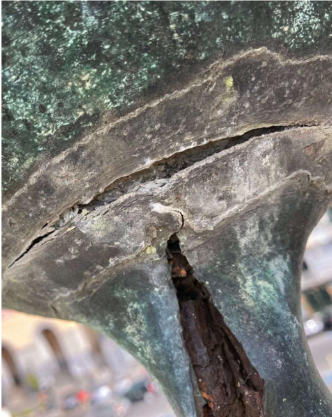
Lesioni presenti sulla sfera bronzea