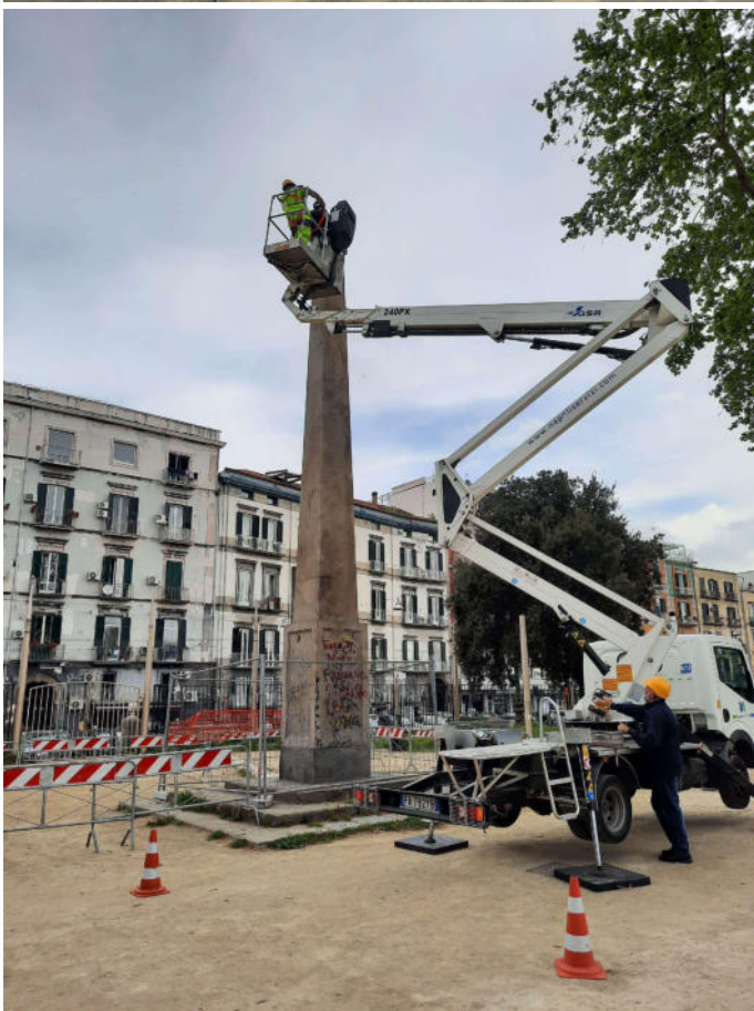
Autocarro con cestello elevatore