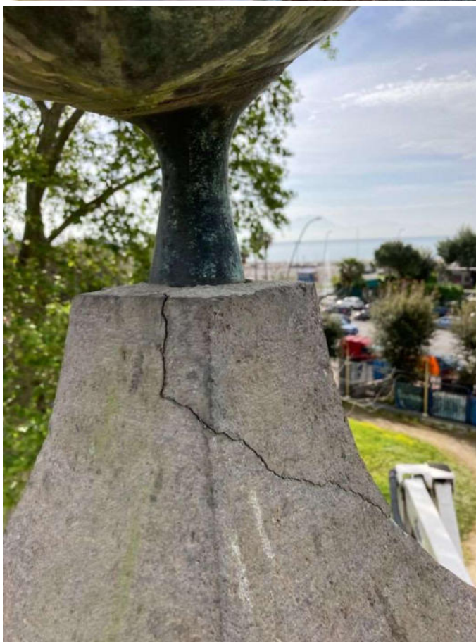
Parti lapidee fessurate