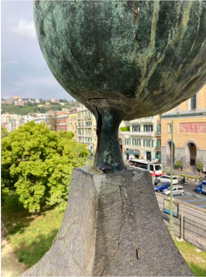
Lesioni presenti sulla sfera bronzea