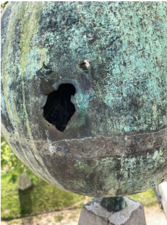
Lesioni presenti sulla sfera bronzea