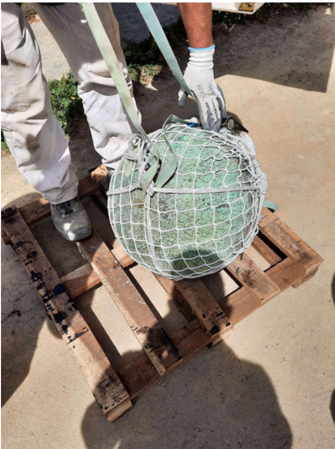
Sfera bronzea rimossa