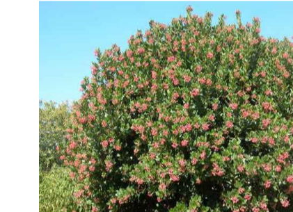
Arbutus Unedo (Corbezzolo)