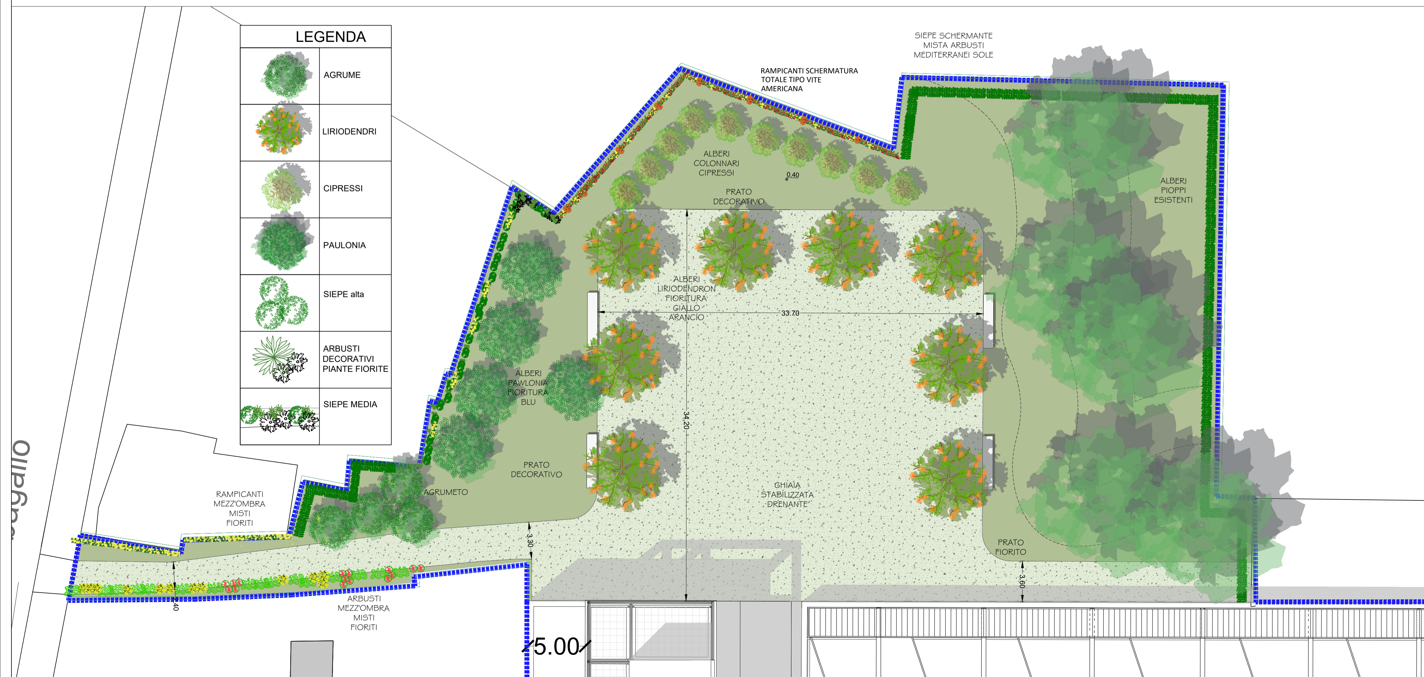
PLANIMETRIA STATO DI PROGETTO