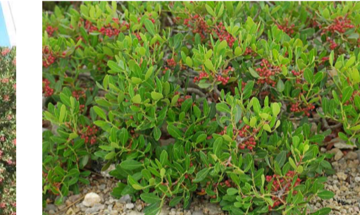
Pistacia Lentiscus (Lentisco)