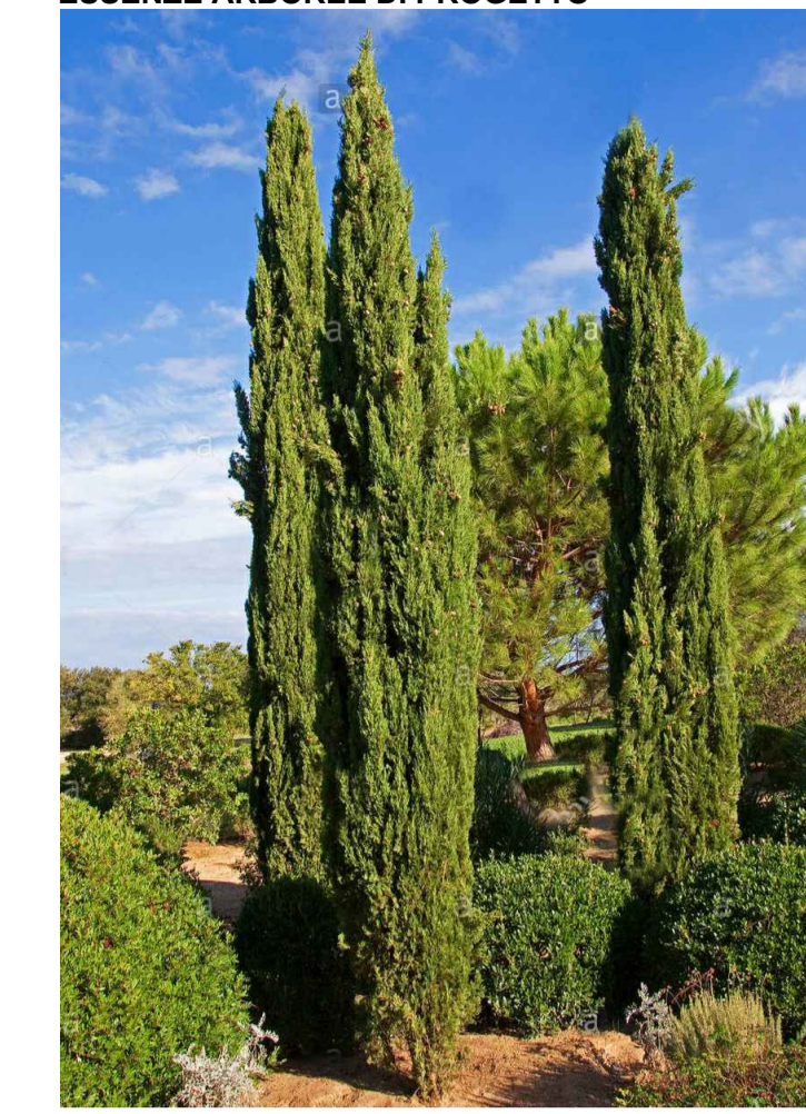
Cupressus sempervirens (Cipressi)