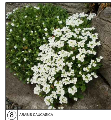
8 ARABIS CAUCASICA