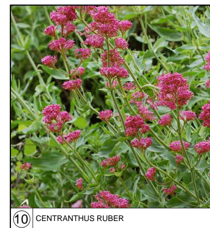
10 CENTRANTHUS RUBER