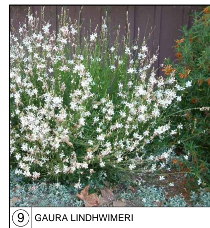
9 GAURA LINDHIMERI