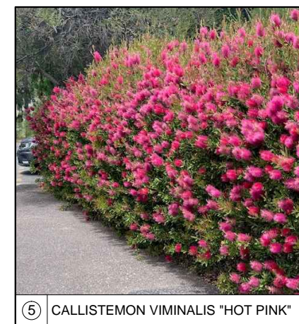
5 CALLISTEMON VIMINALIS "HOT PINK"