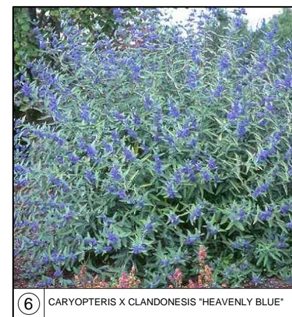
6 CARYOPTERIS X CLANDONENSIS "HEAVENLY BLUE"