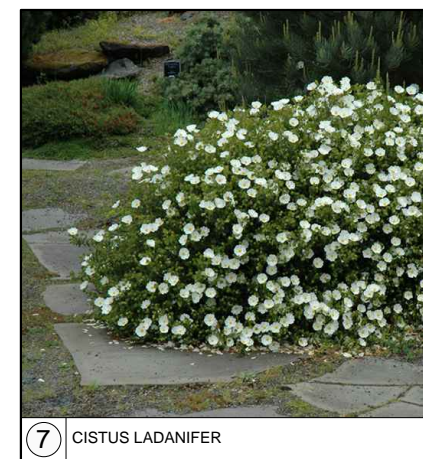
7 CISTUS LADANIFER