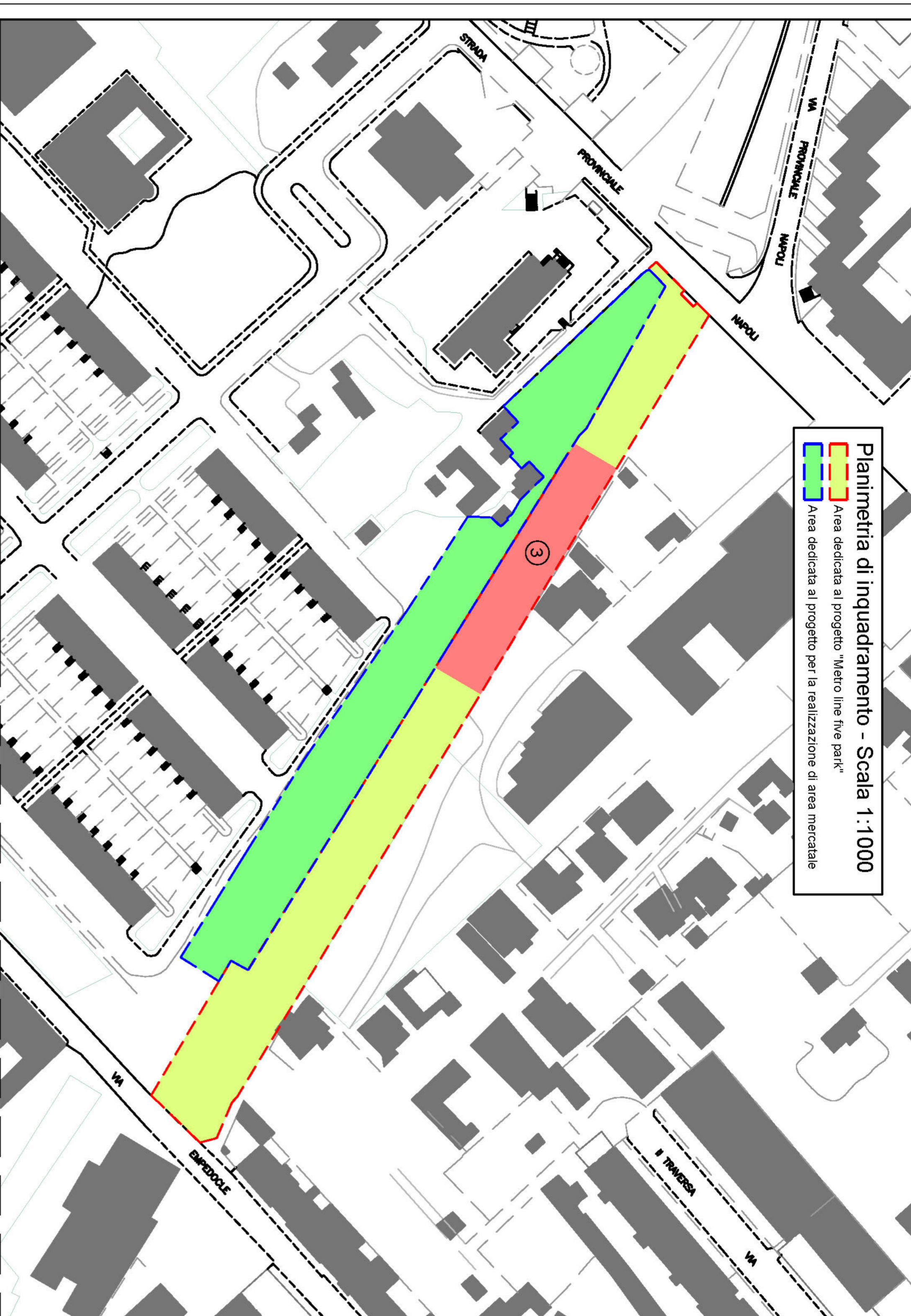
Pianimetria di inquadramento - Scala 1:1000