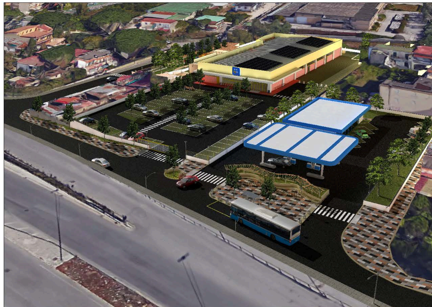
Fotoinserimento nel contesto