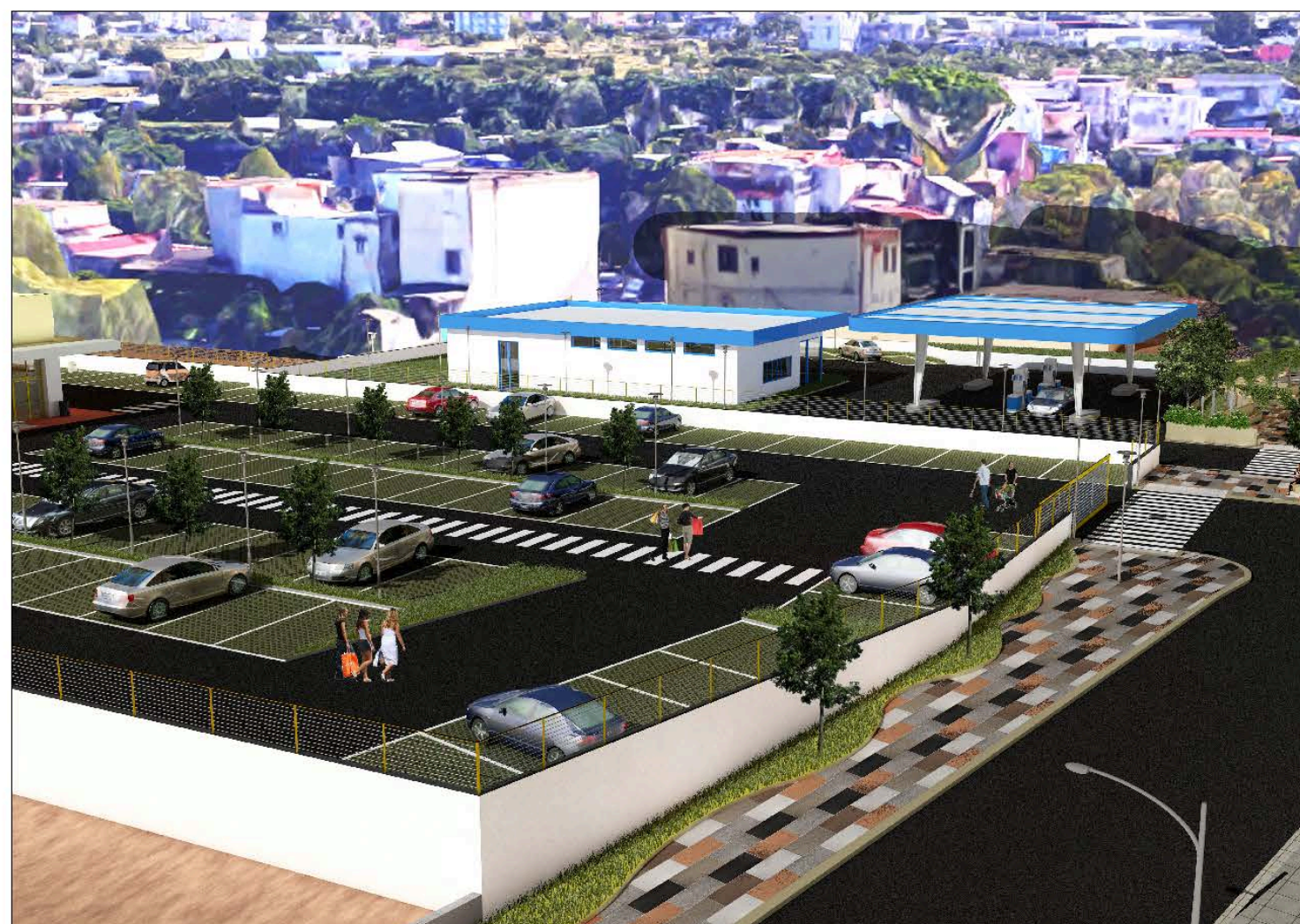
Fotoinserimento del Distributore di Carburante nel contesto