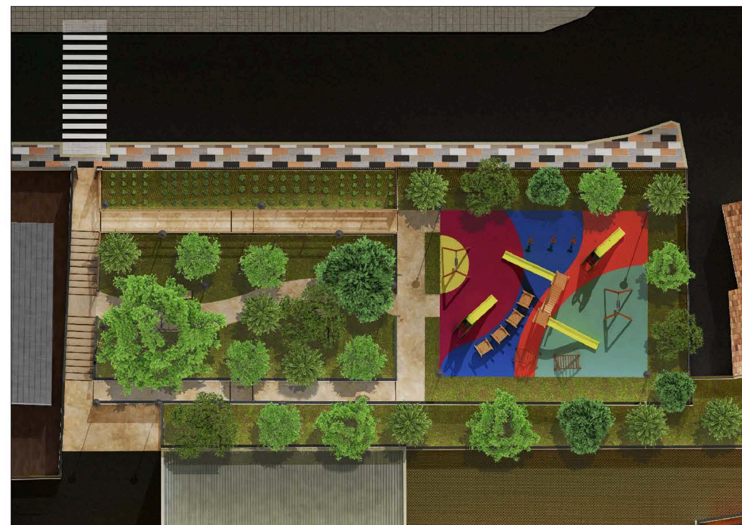
Vista dall'alto del Parco attrezzato