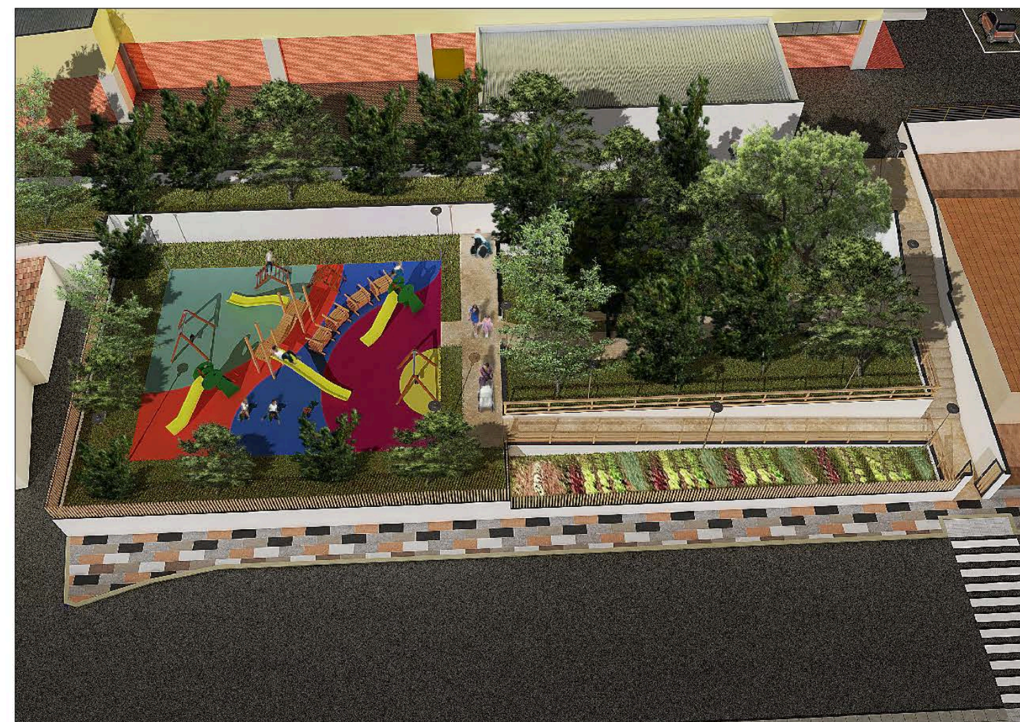
Fotoinserimento del Parco attrezzato nel contesto