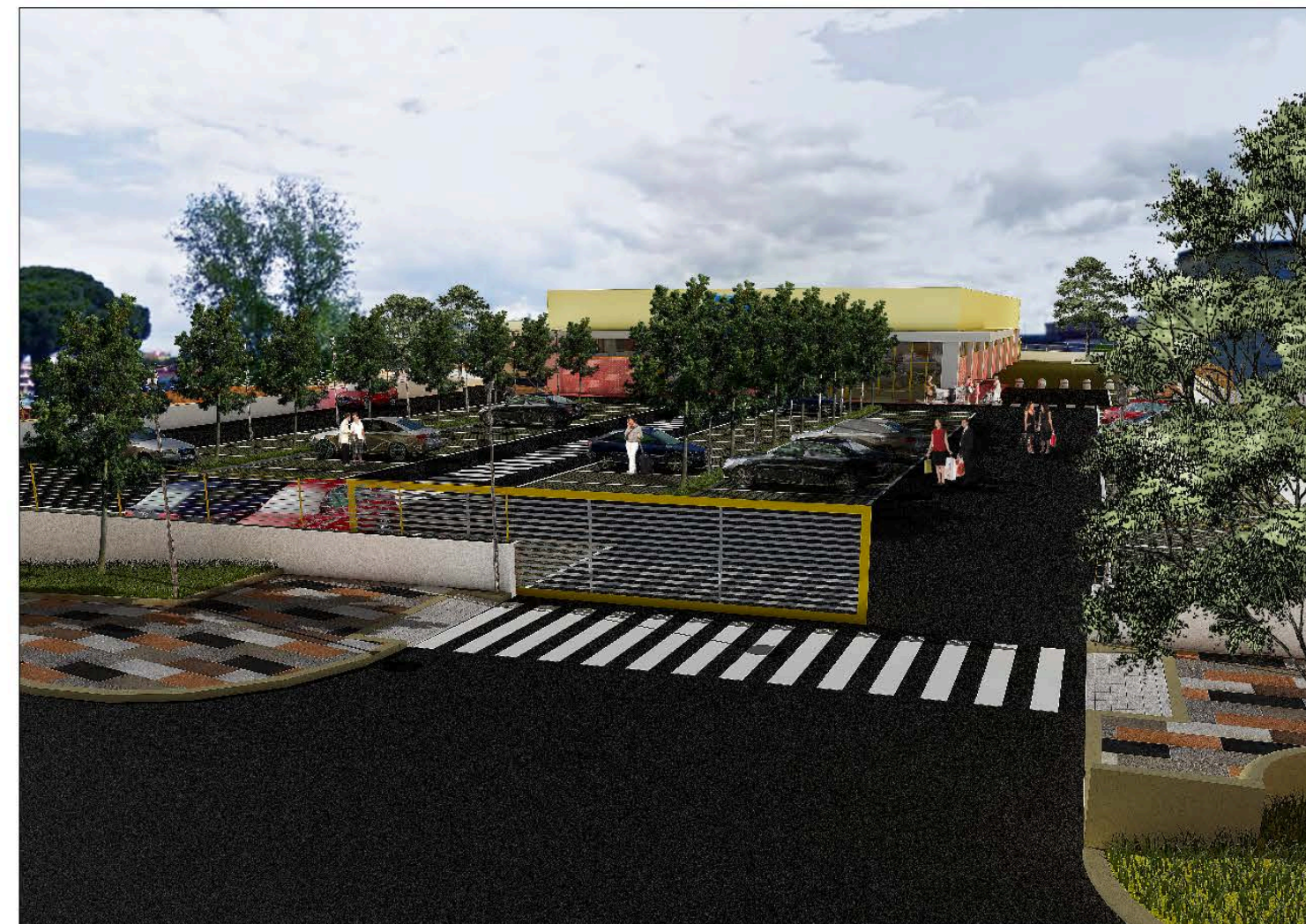
Fotoinserimento nel contesto del Centro Commerciale