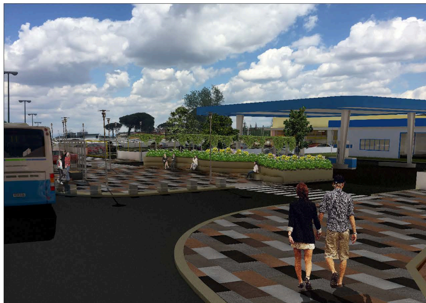
Fotoinserimento del Distributore di Carburante da Via Domenico Rea