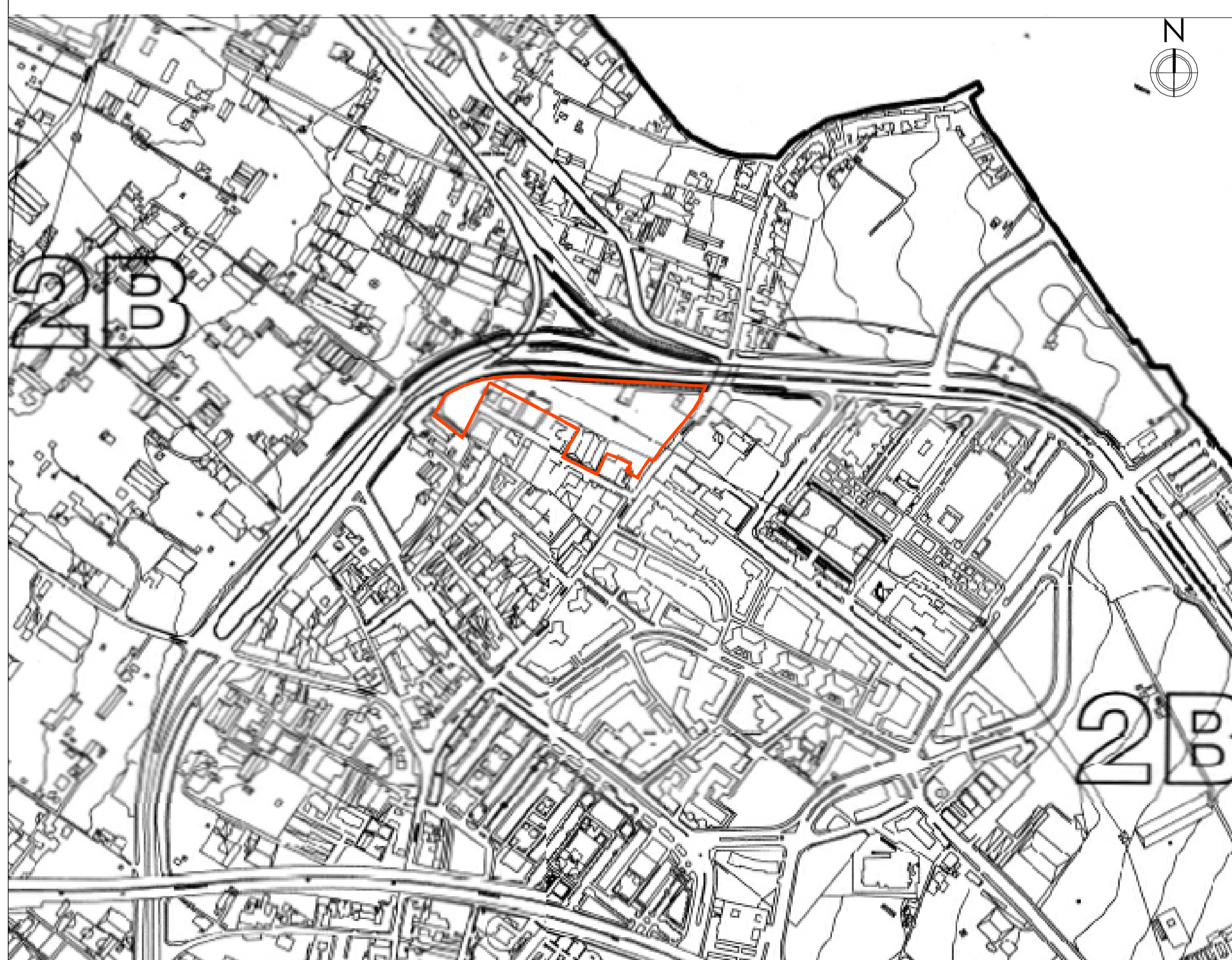
Stralcio della strumentazione urbanistica vigente - Zonizzazione del territorio in prospettiva sismica (tav. 11) - Scala 1:4000