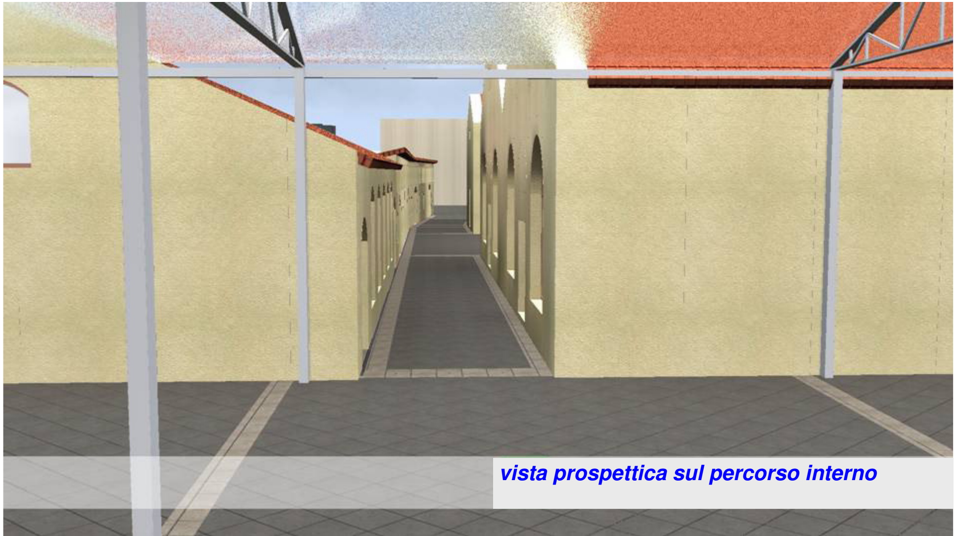
vista prospettica sul percorso interno