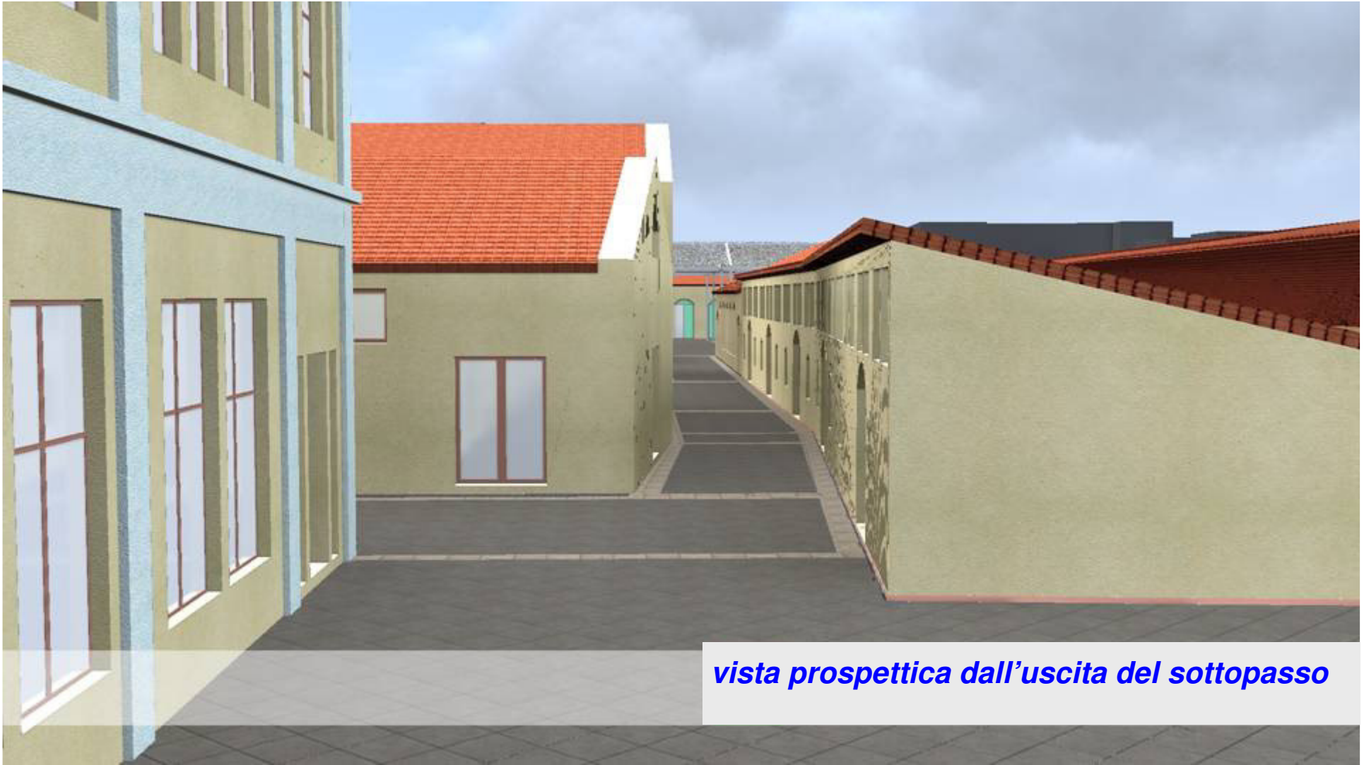
vista prospettica dall'uscita del sottopasso