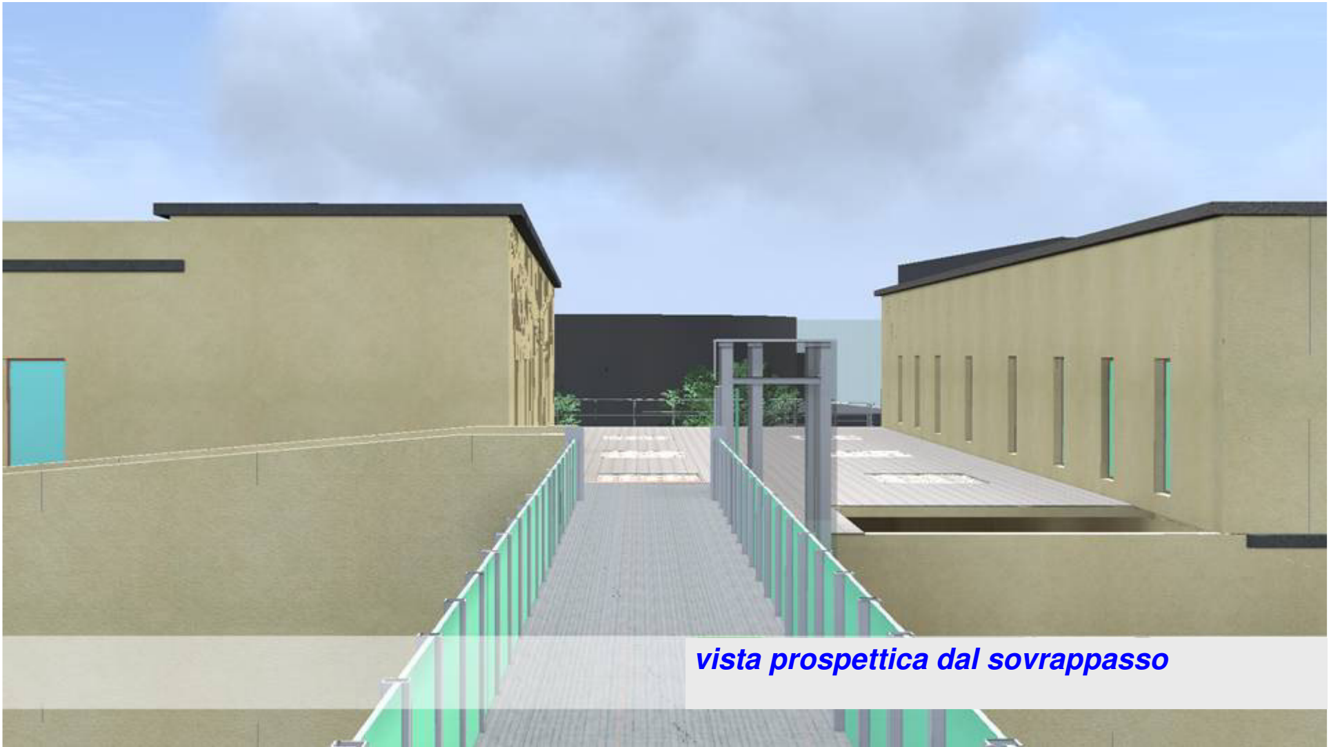
vista prospettica dal sovrappasso