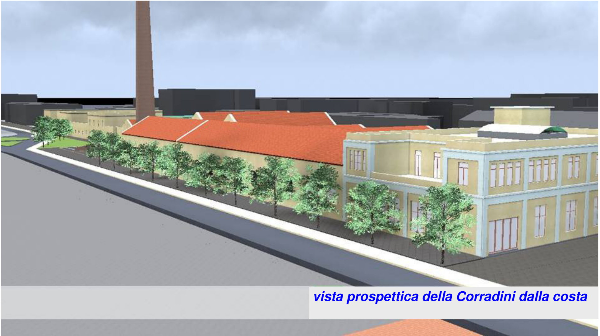
vista prospettica della Corradini dalla costa