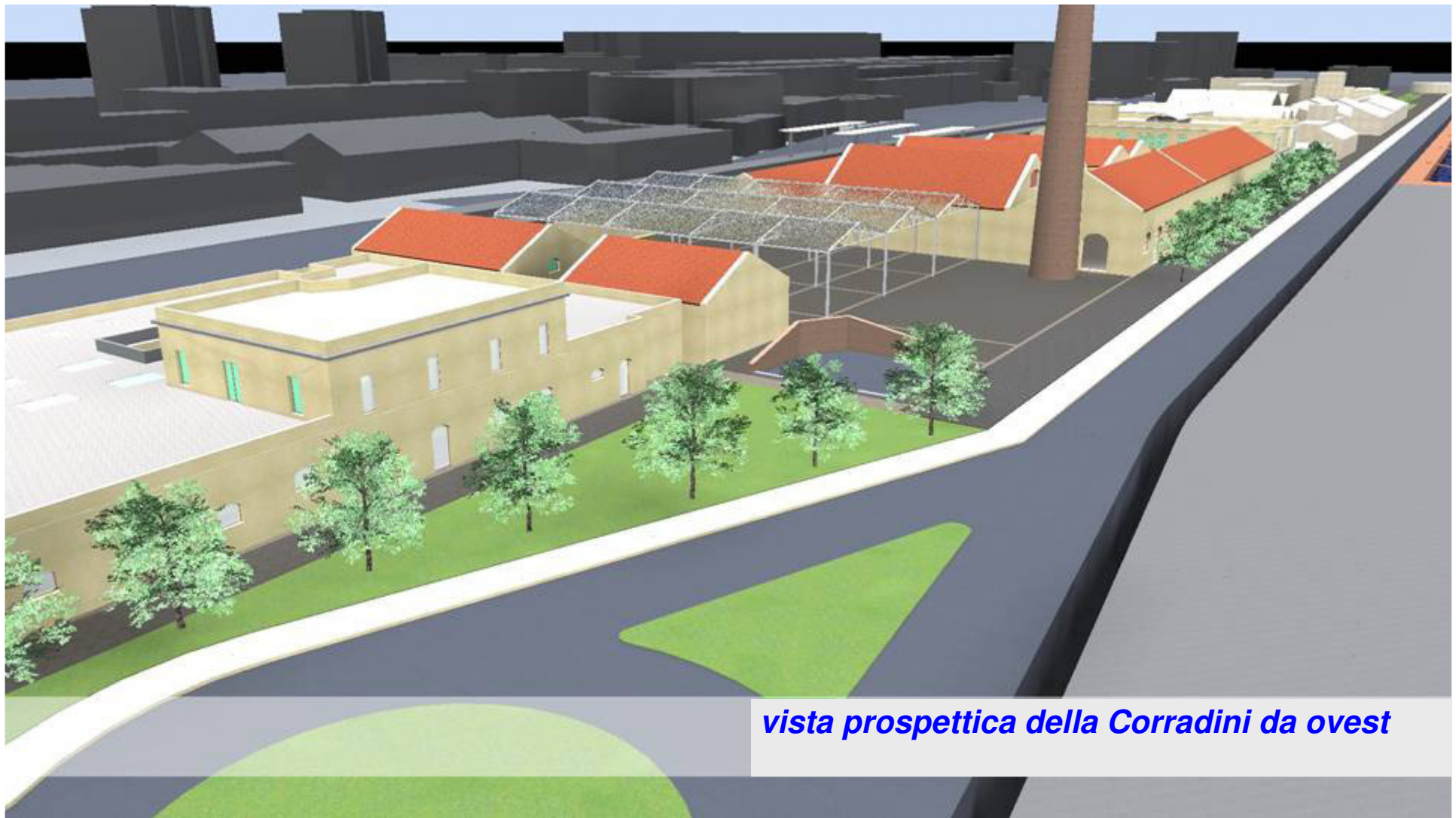
vista prospettica della Corradini da ovest