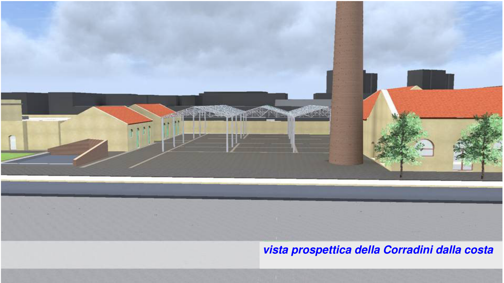
vista prospettica della Corradini dalla costa