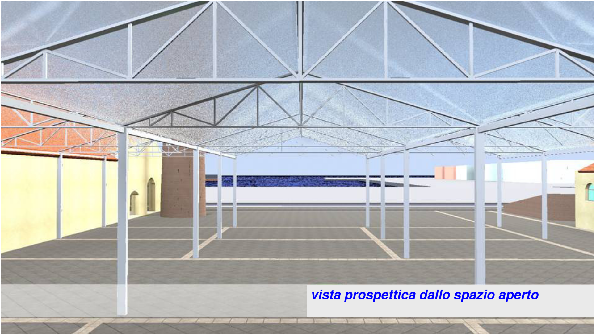
vista prospettica dallo spazio aperto