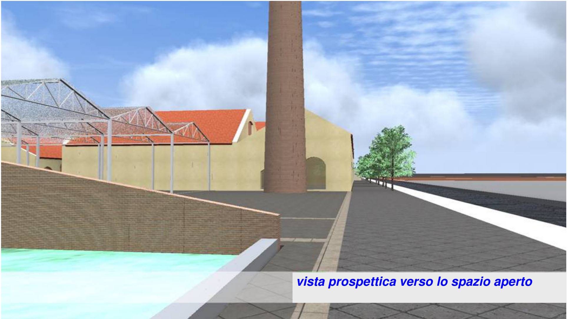
vista prospettica verso lo spazio aperto