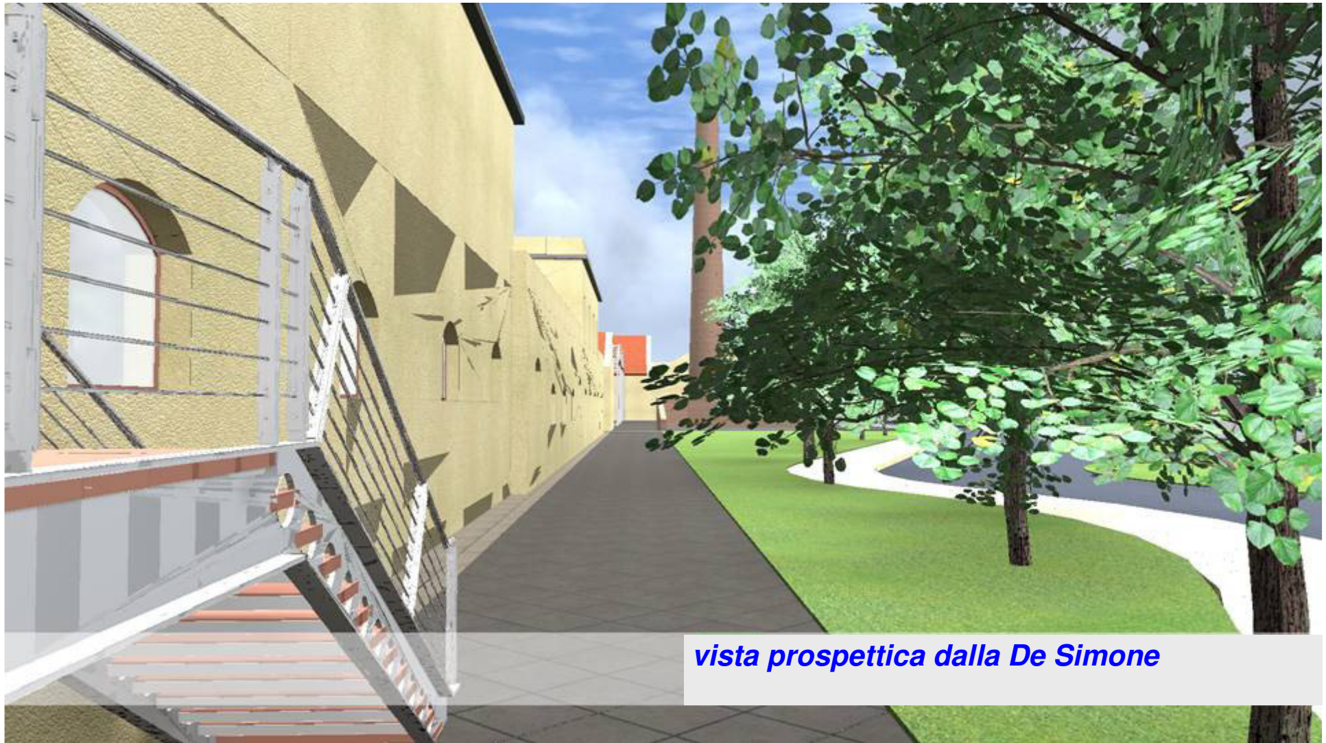
vista prospettica dalla De Simone