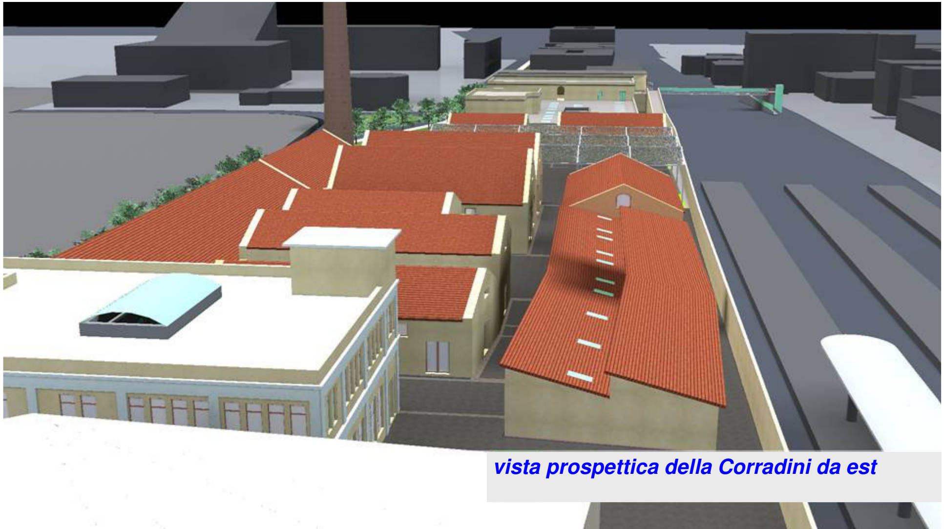
vista prospettica della Corradini da est