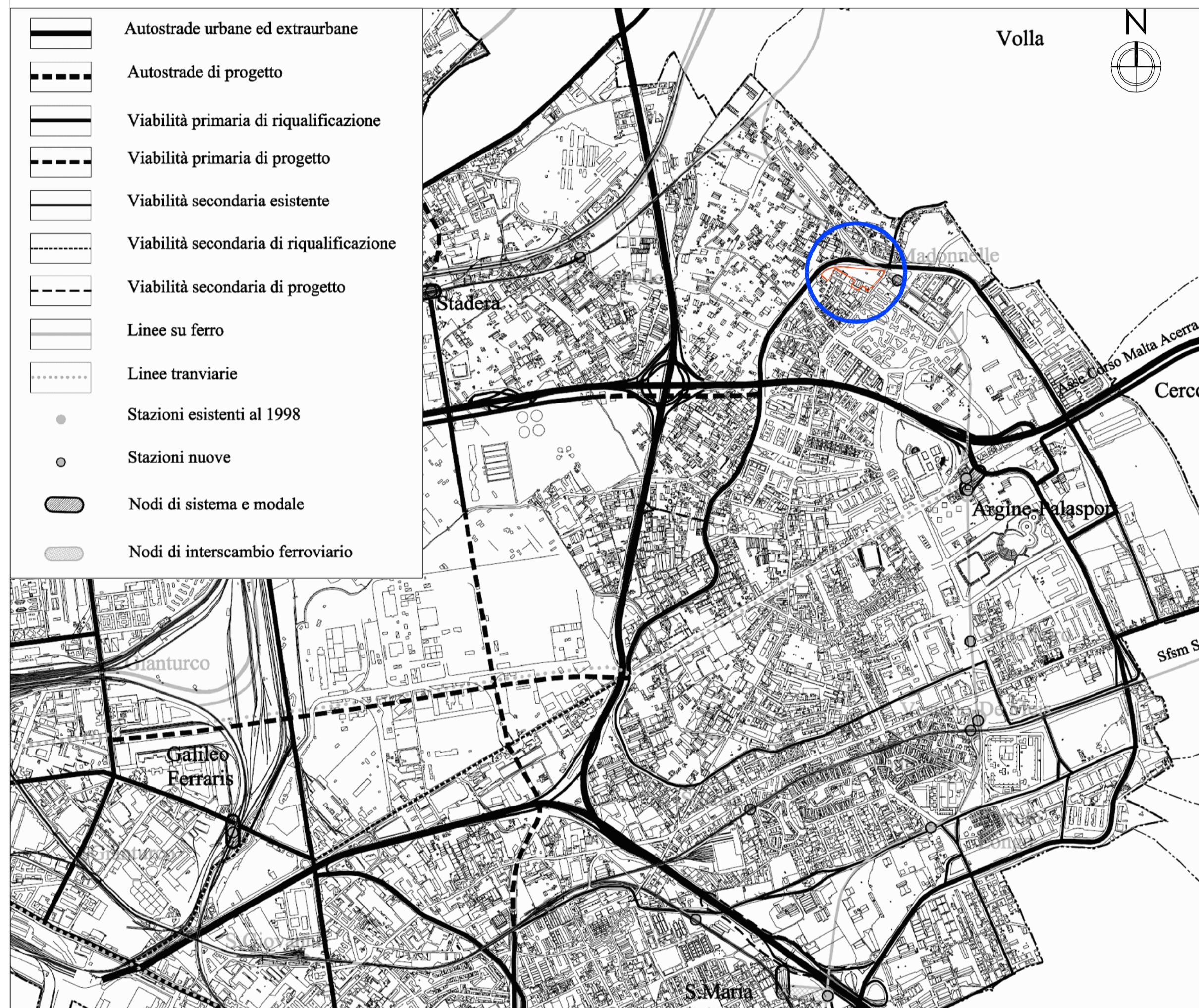
Stralcio della strumentazione urbanistica vigente - Variante PRG: Sistema della viabilità primaria (tav. 10) - Scala 1:18000