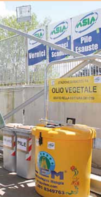
Con il vicesindaco Tommaso Sodano all'inaugurazione dell'isola ecologica di Scampia