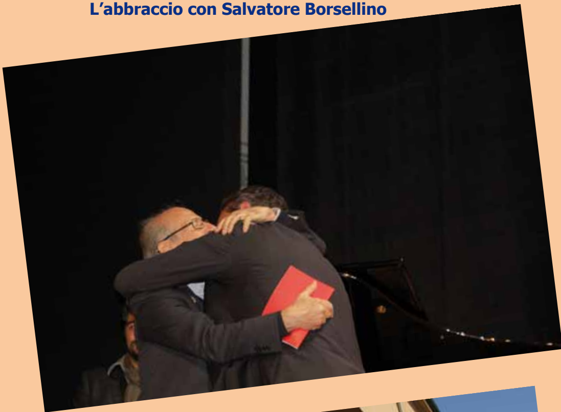
L'abbraccio con Salvatore Borsellino