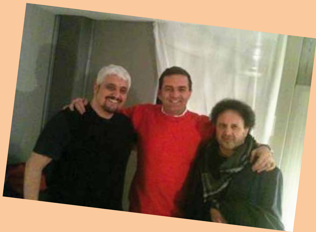
Con Pino Daniele ed Enzo Avitabile