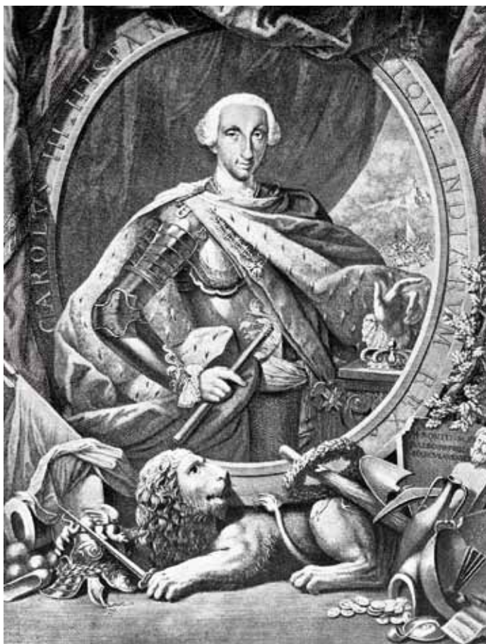
Camillo Paderni e Filippo Morghen, Carlo di Borbone, da: De' bronzi di Ercolano e contorni..., Napoli, 1767 (collezione privata B. Leonardi).

Dopo un po', invece, la questione tornò nuovamente alla ribalta e al governo municipale apparve necessaria e indifferibile l'adozione di misure speciali per individuare e stroncare i tentativi di ricomparsa dell'«orrendo tribunale». Vide la luce la Deputazione contro il Sant'Ufficio , organismo composto da un numero di deputati che variò nel tempo, mentre fu costante l'appartenenza ai Seggi nobili della stragrande maggioranza di essi.