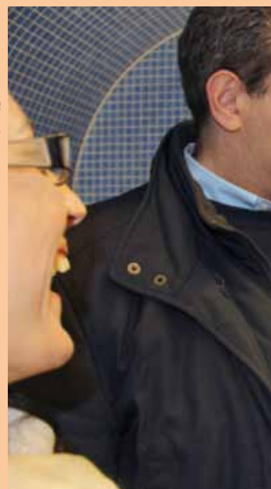
Nella stazione Toledo della Linea 1 della Metropolitana