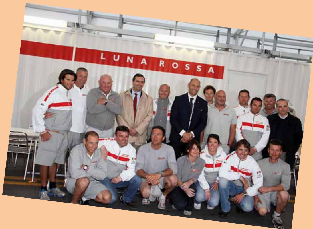
Con il team di Luna Rossa