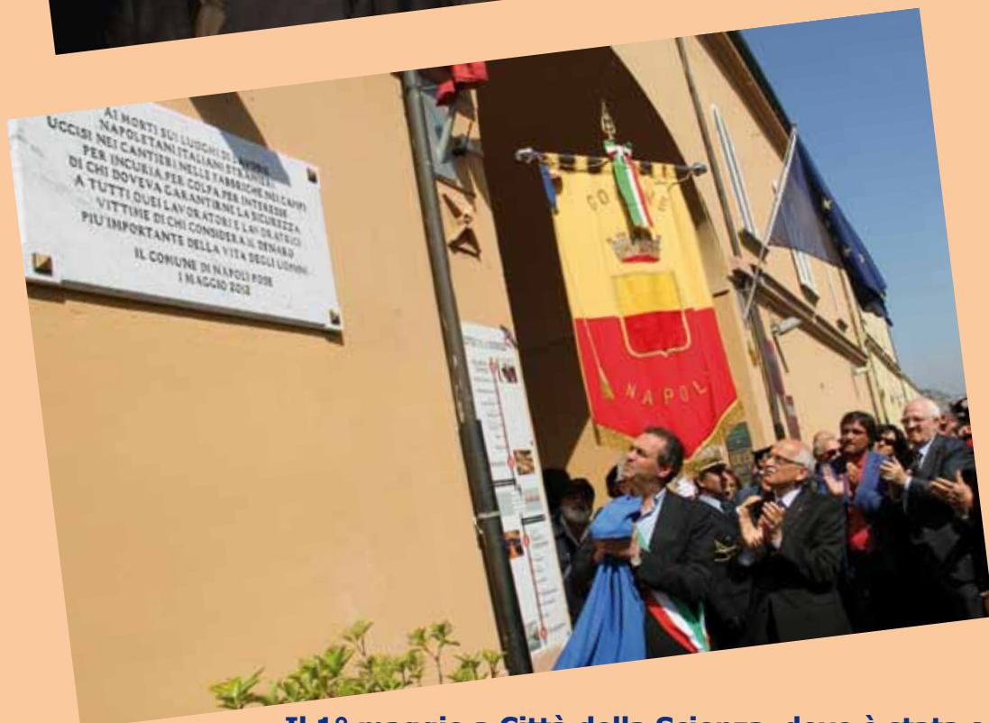
Il 1° maggio a Città della Scienza, dove è stata scoperta una targa dedicata ai caduti sui luoghi di lavoro