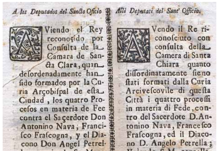
Real risoluzione e comando alli Deputati del Sant'Officio, 29 Dicembre 1746, Archivio Storico Municipale di Napoli, II Serie, Diversi Deputazione del Santo Ufficio.

generale, il governo cittadino decise per l'azione, senza indugi.