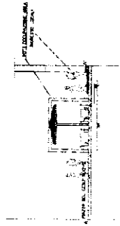
SEZIONE STATO DI PROGETTO SCALA 1/100

PLANIMETRIA STATO DI FATTO OCCUPAZIONE SUOLO IN ESSERE RISTORANTE "MUNACIELLO" PIAZZA DEL GESU' NUOVO N. 26 - 27