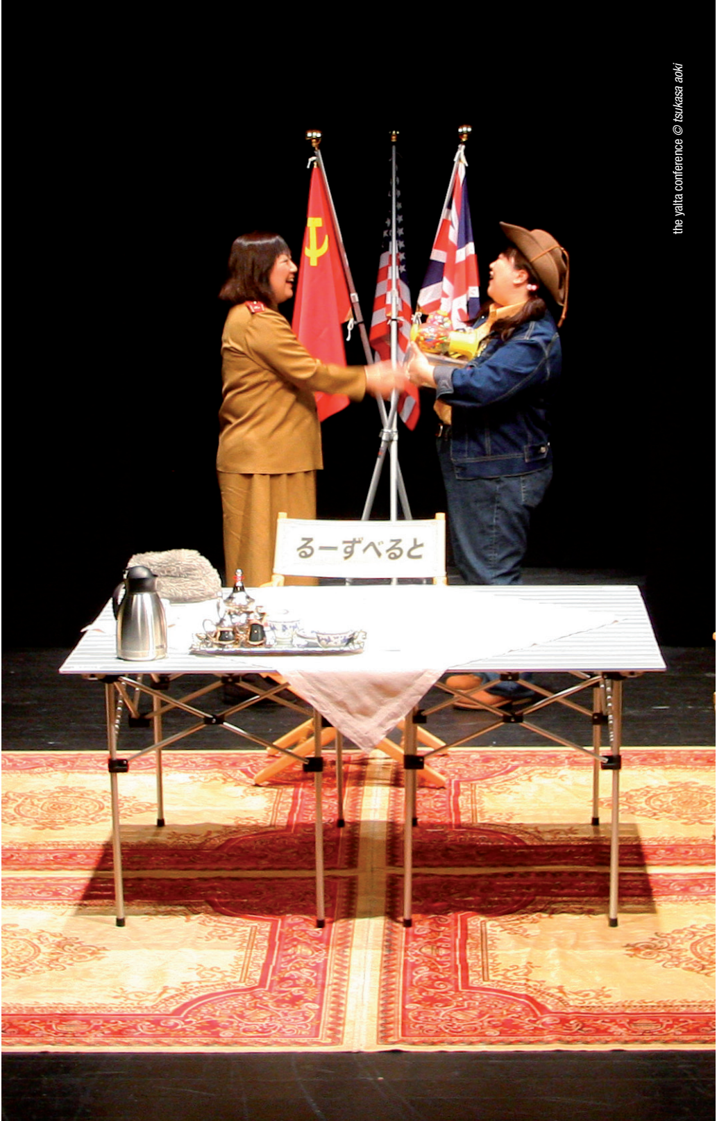
the yalta conference © tsukasa aoki

PAN | Palazzo delle Arti Napoli via dei Mille, 60 Real Albergo dei Poveri piazza Carlo III, 3 Teatro Mercadante piazza Municipio, 1 Teatro Nuovo via Montecalvario, 16 Teatro Politeama via Monte di Dio, 80 Teatro San Ferdinando piazza Eduardo De Filippo, 20