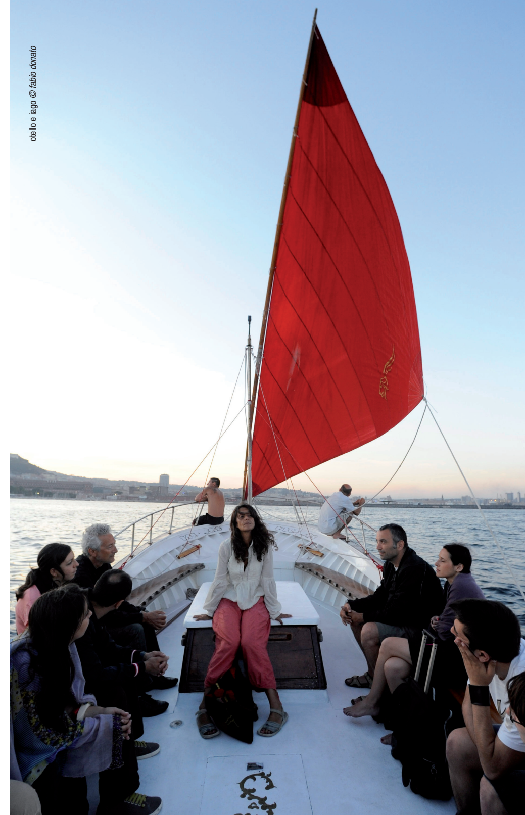
diello e lago