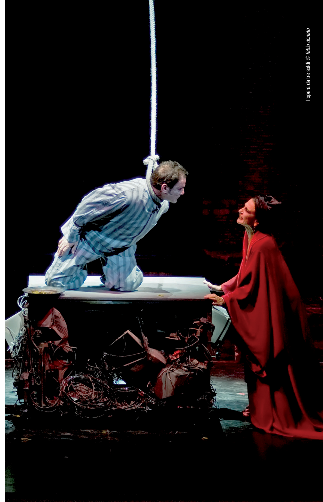
l'opera da tre soldi

La prima parte dell'edizione 2011 del Napoli Teatro Festival Italia ha confermato Napoli come capitale internazionale del teatro. Australia, Brasile, Canada, Francia, Giappone, Inghilterra, Irlanda, Russia, Serbia, Spagna, Stati Uniti, Vietnam sono i paesi che hanno partecipato alla quarta edizione del Festival. In 22 giorni il pubblico ha potuto assistere a 23 spettacoli per un totale di 86 rappresentazioni tra teatro, danza, musica, performance. Sui palcoscenici della città gli oltre 400 artisti coinvolti provenienti da 13 paesi hanno parlato 7 lingue. Il Festival conferma la propria vocazione per l'internazionalità, il confronto produttivo con partner stranieri e l'attenzione alle nuove creatività. 10 spettacoli internazionali 13 fra produzioni e coproduzioni 9 spettacoli site-specific 16 prime assolute 6 prime europee e italiane. E45 Napoli Fringe Festival ha presentato 16 spettacoli per un totale di 32 rappresentazioni. 115 testate accreditate 31 straniere 230 giornalisti presenti in città. 20 luoghi tra cui teatri all'italiana e spazi aperti, musei e monumenti, passaggi sotterranei e strade cittadine hanno accolto la quarta edizione del Festival.