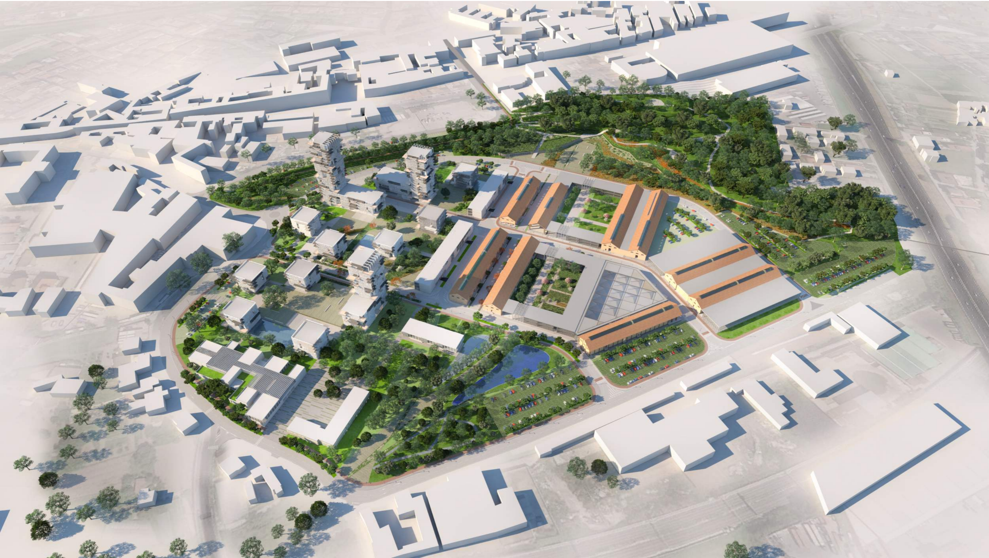
Vista diurna dall'alto