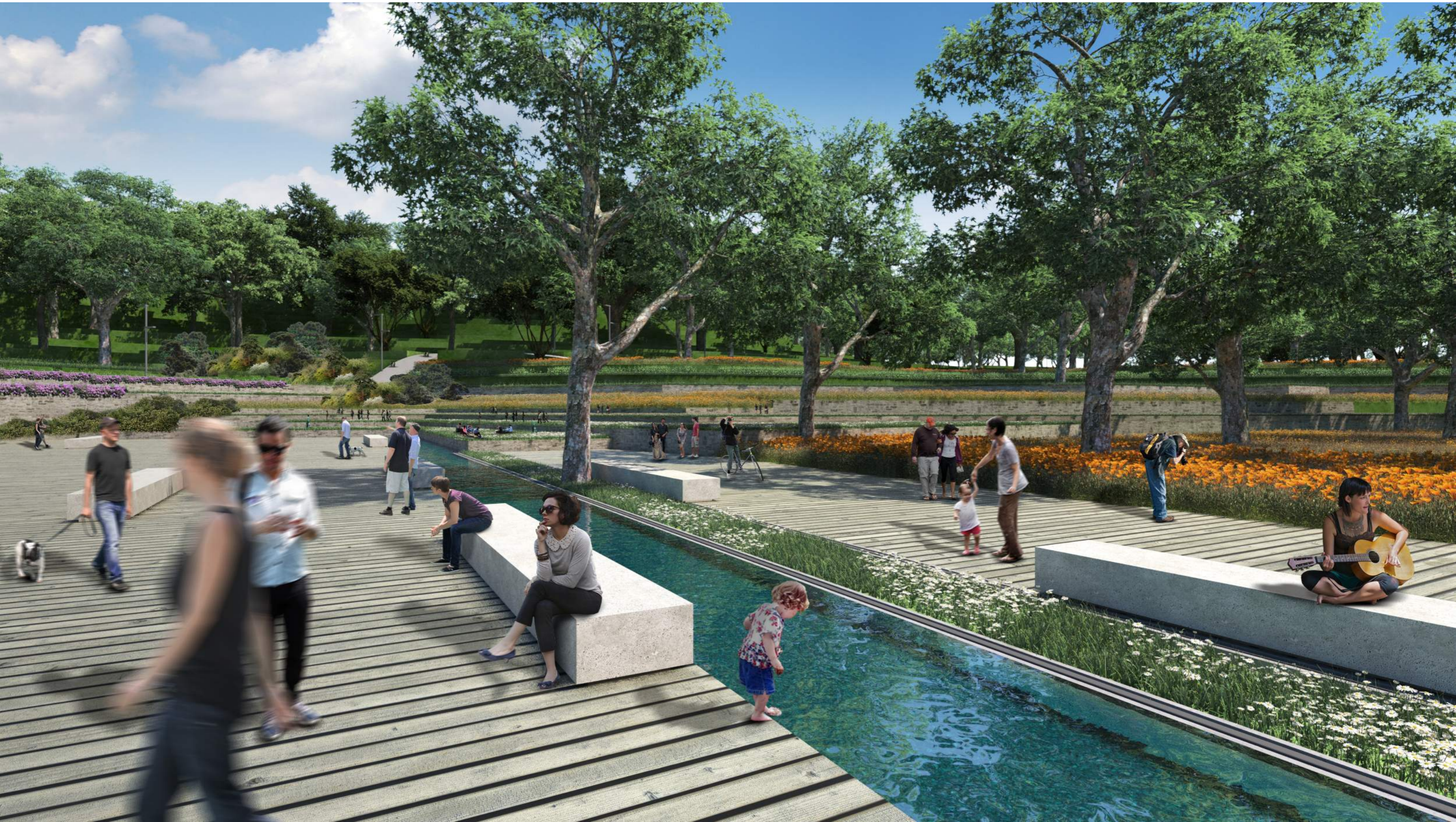
La piazza verso il parco