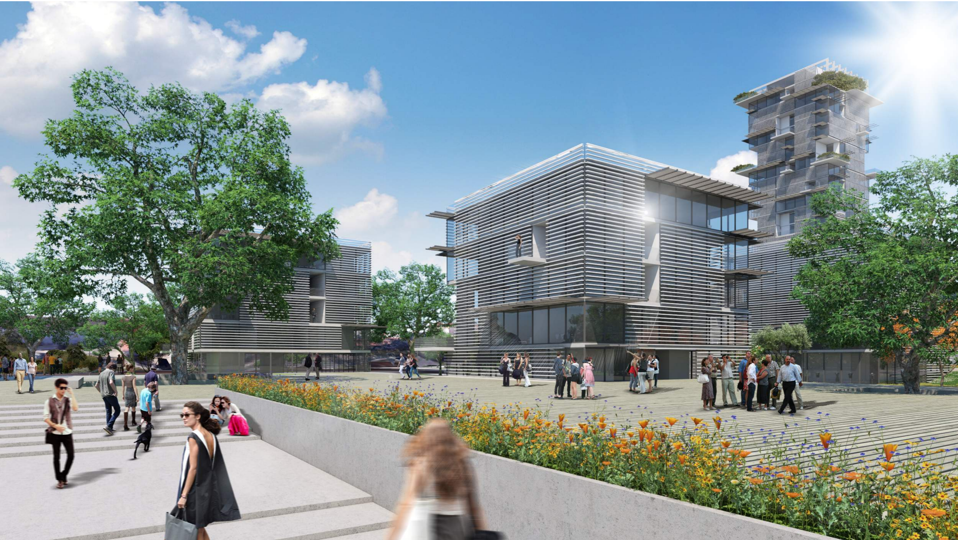
Le piastre tra gli edifici residenziali