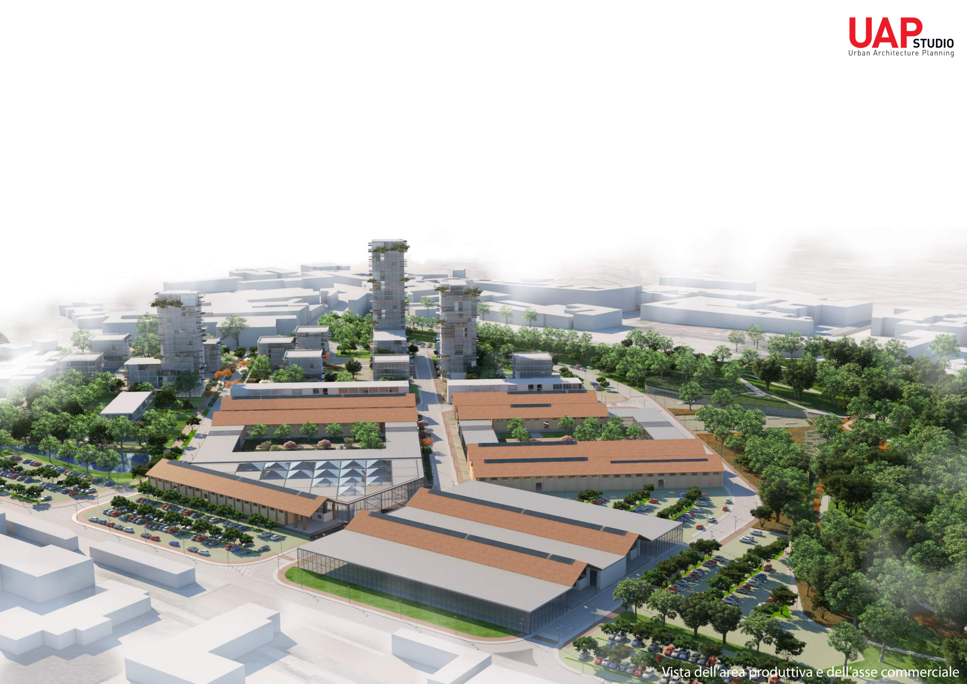
Vista dell'area produttiva e dell'asse commerciale