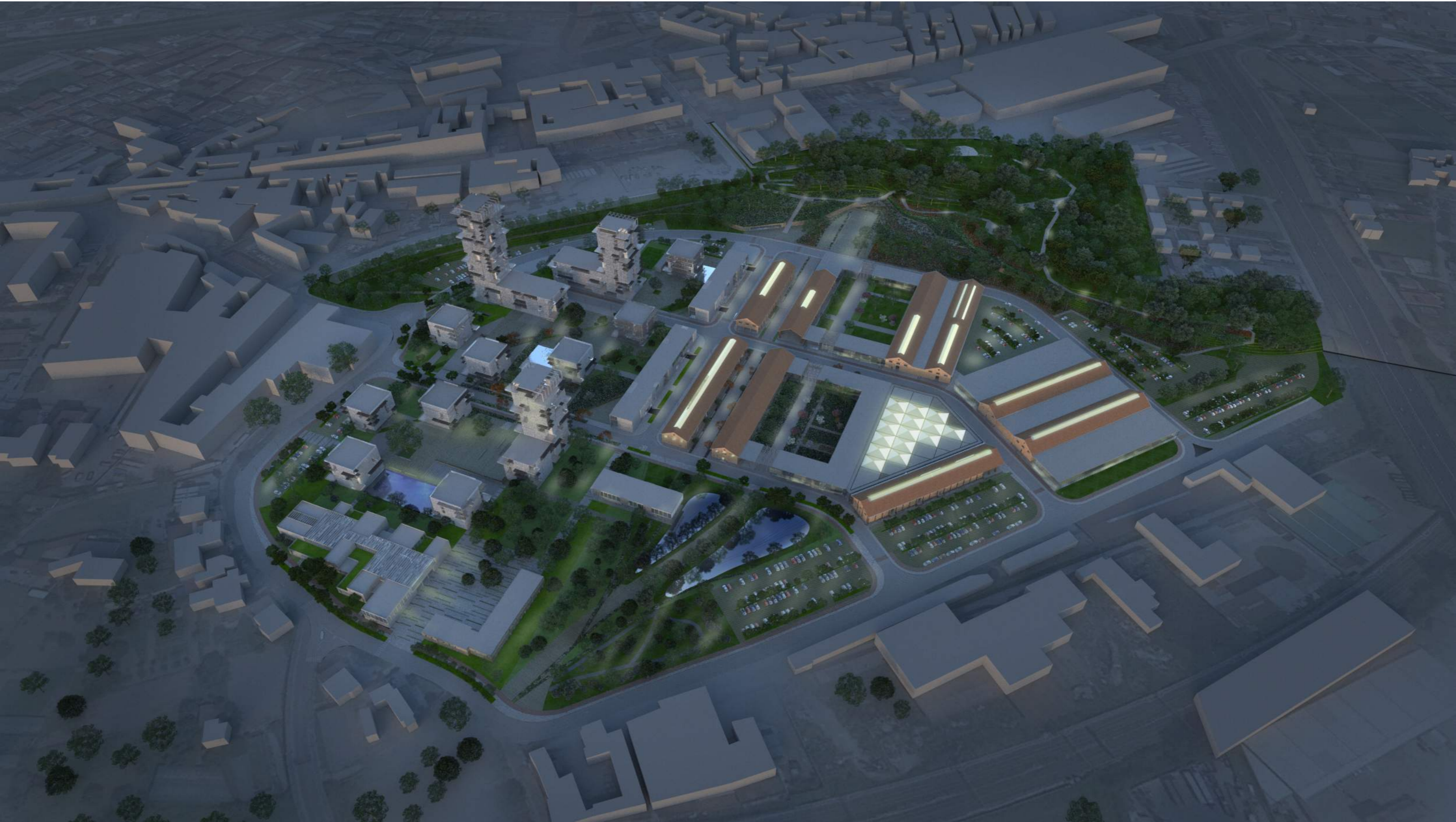
Vista notturna dall'alto