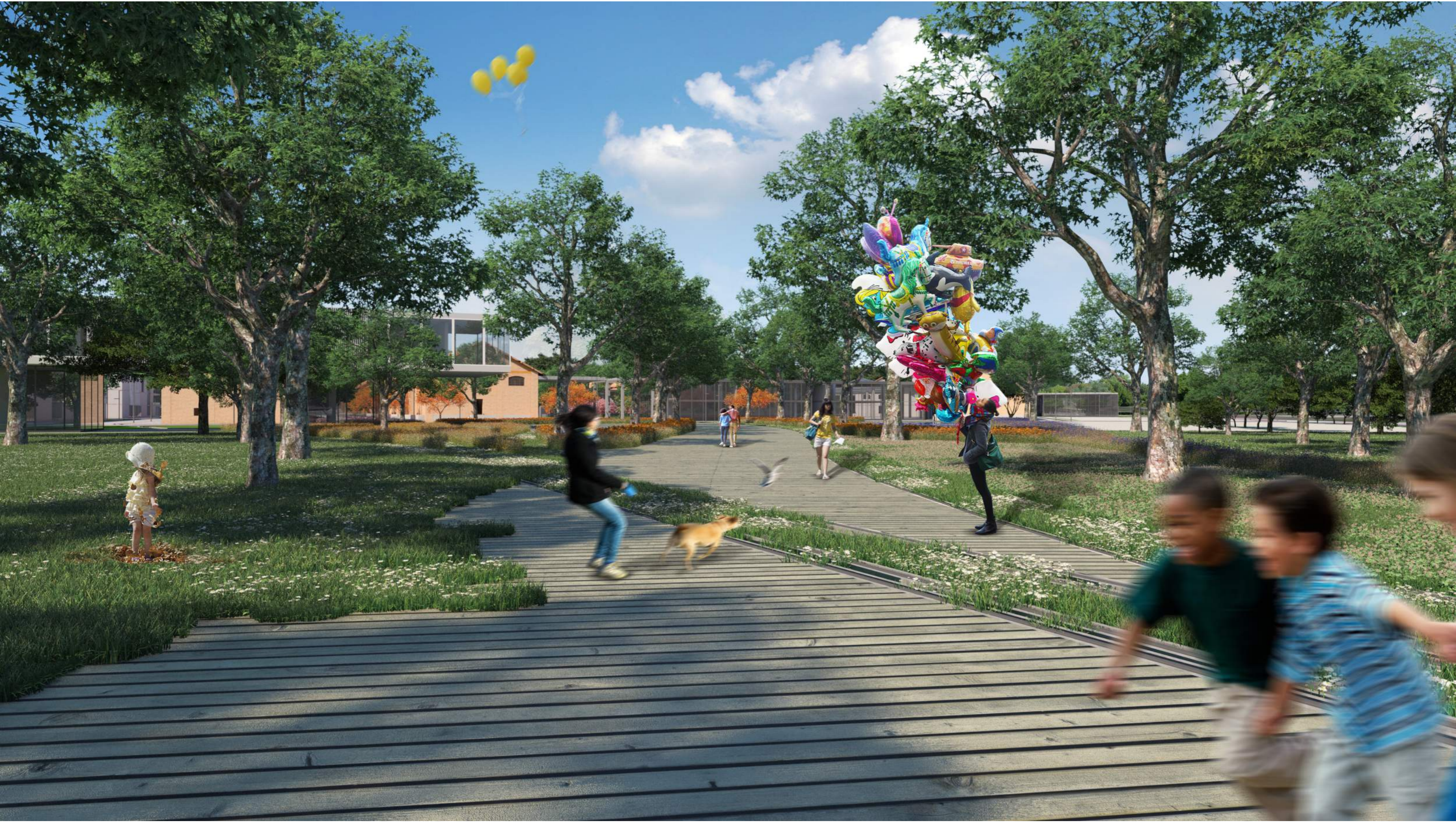
I percorsi pedonali