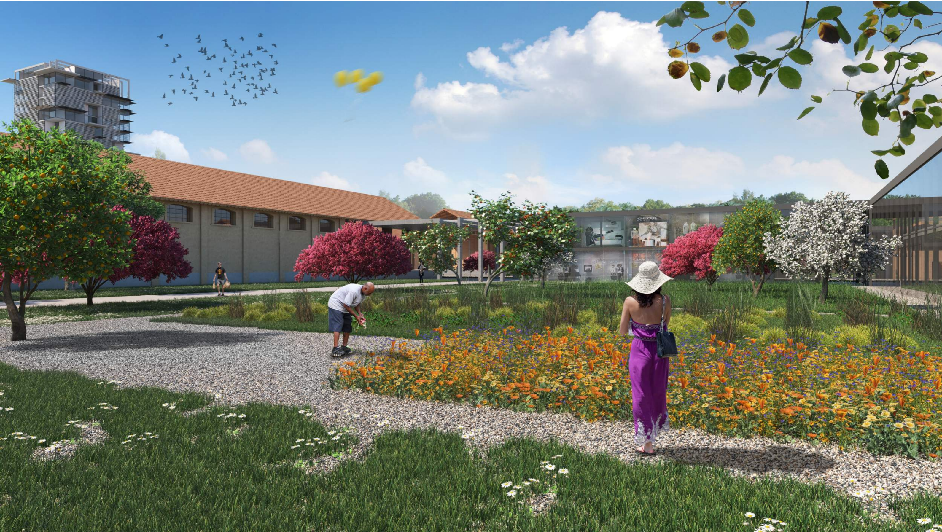
Le corti commerciali