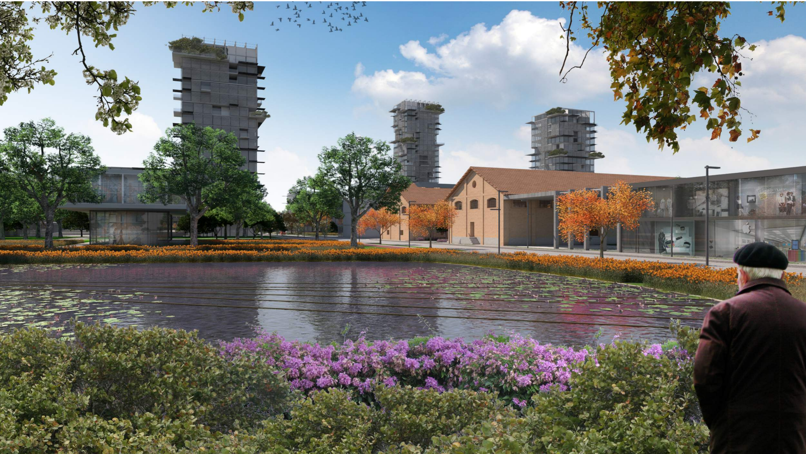
I laghetti tra l'area commerciale e residenziale