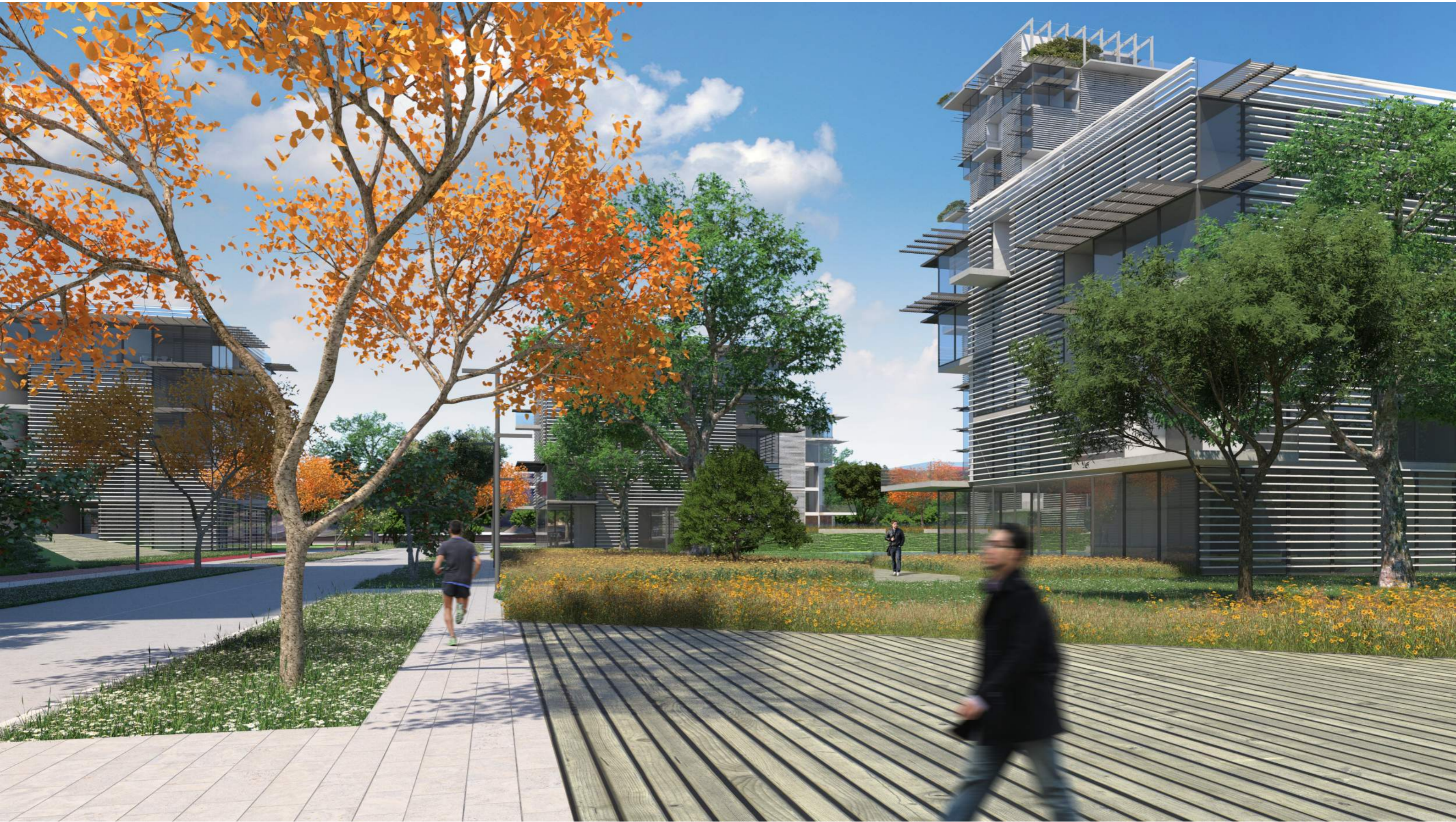
I percorsi che attraversano l'area residenziale