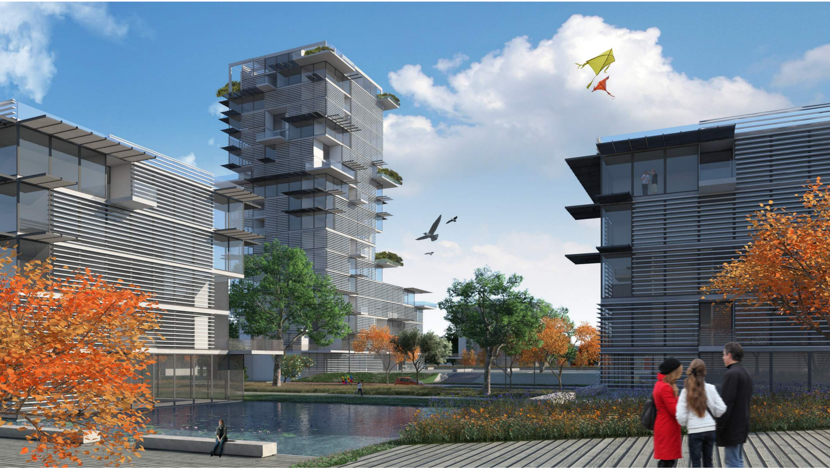
Le piazze e gli specchi d'acqua tra gli edifici residenziali