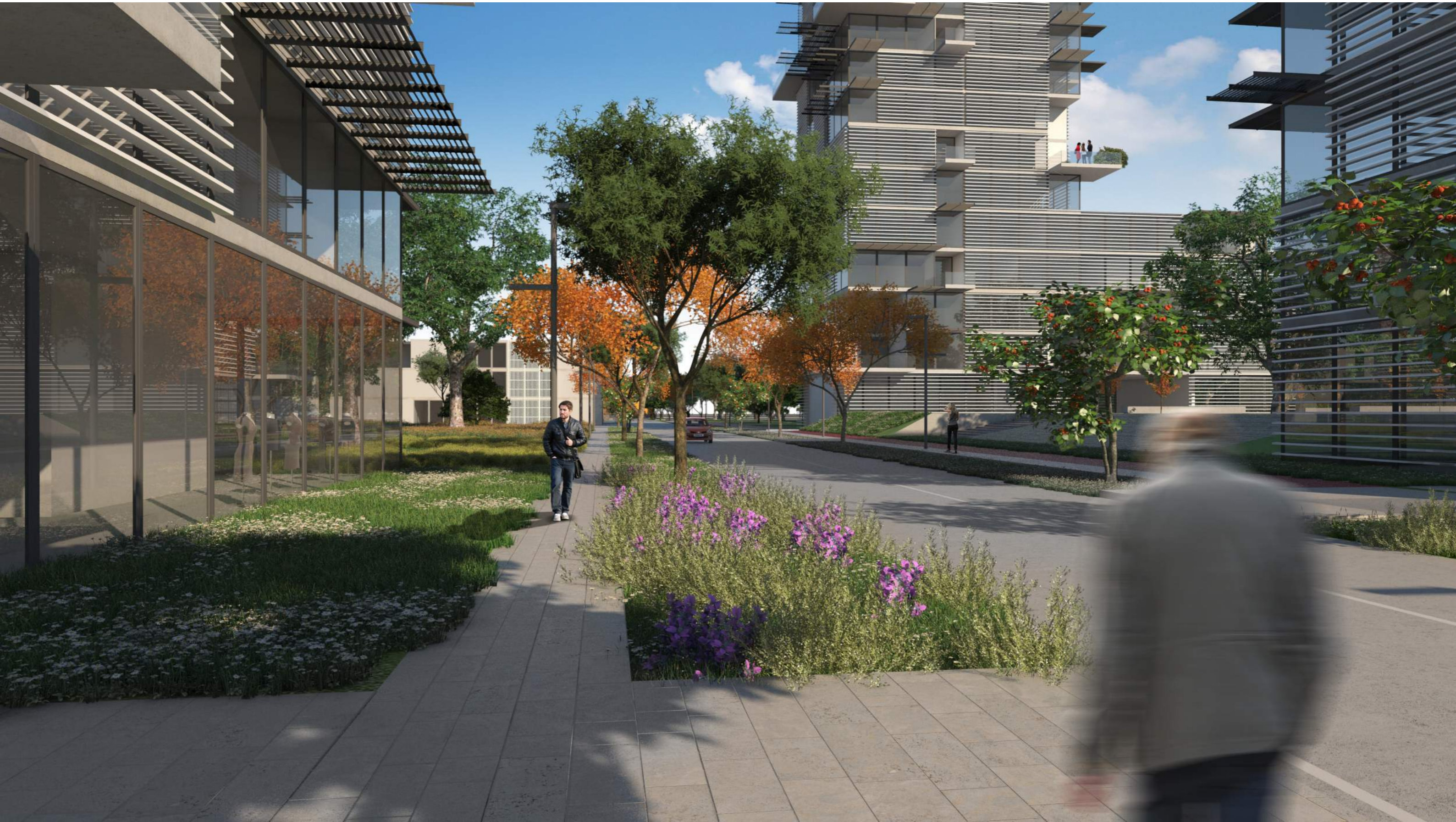
I percorsi che attraversano l'area residenziale