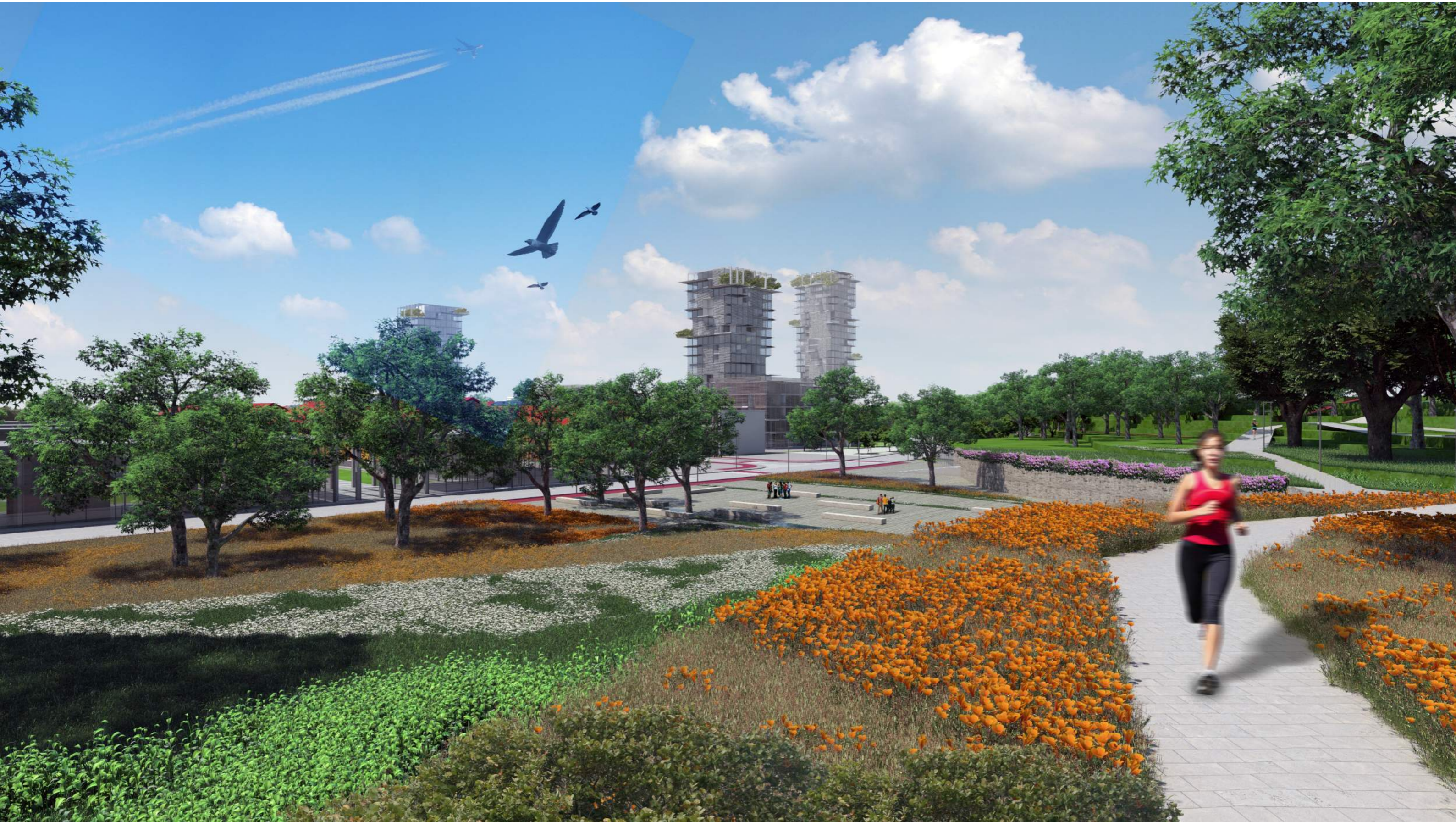
Il percorso naturalistico che attraversa il parco