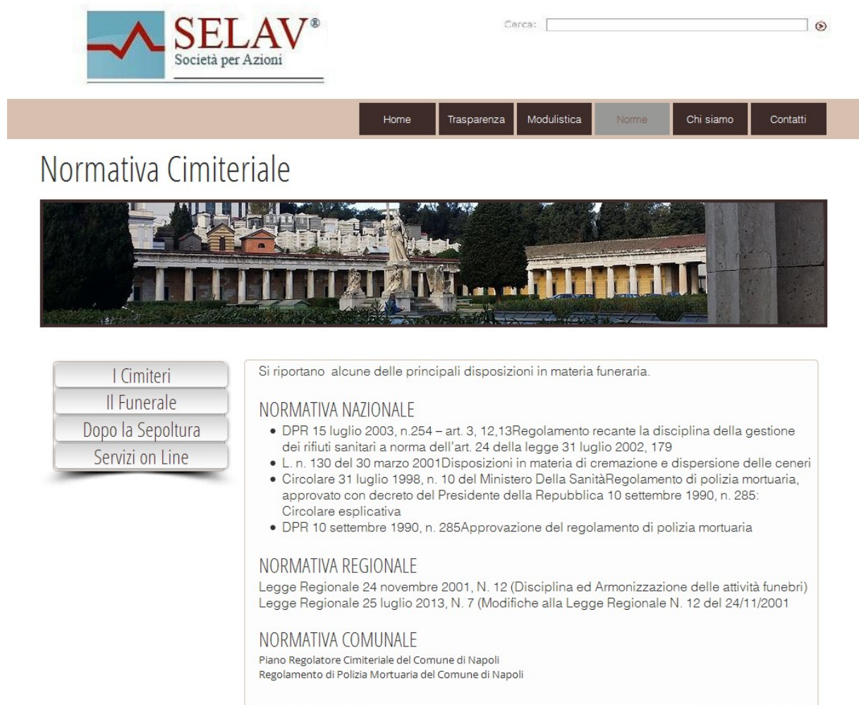
Illustrazione 2: Esempio di portale web - Sezione normativa

I contenuti inseriti nelle seguenti immagini sono puramente esemplificativi e potranno essere usati solo come linee guida per la progettazione e realizzazione futura.