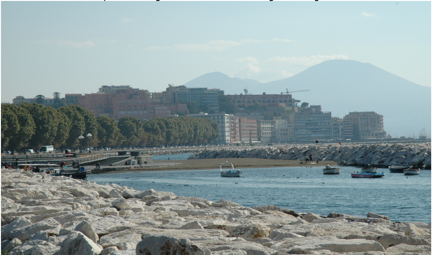
Settembre 2018 - Arenile Rotonda Diaz - Via Caracciolo.

Significativi sono stati i venti negli ultimi giorni del mese ( 24 /27 ) con punte anche di 60 km/h che hanno messo a dura prova la navigazione nel Golfo e creato grossi disagi in città .