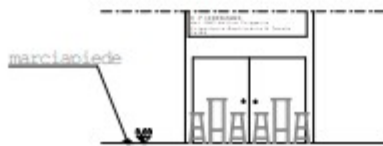
PROGETTO: Prospetto B:B scala 1:100