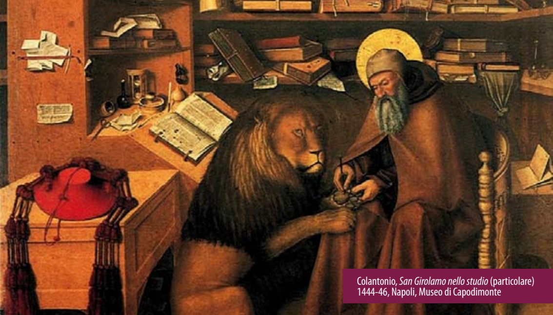
Colantonio, San Girolamo nello studio (particolare) 1444-46, Napoli, Museo di Capodimonte