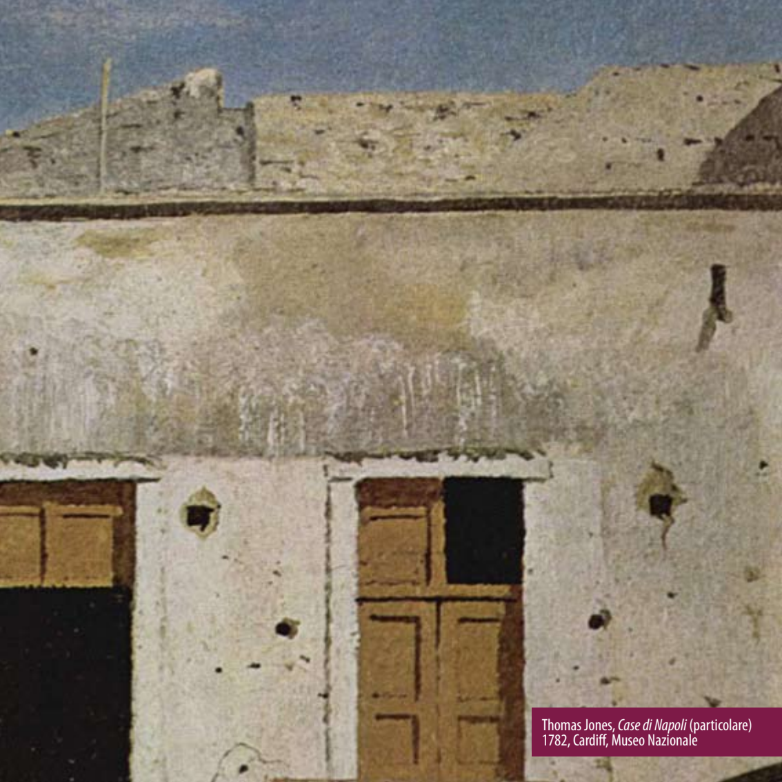
Thomas Jones, Case di Napoli (particolare) 1782, Cardiff, Museo Nazionale