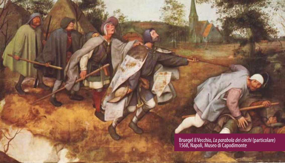
Bruegel il Vecchio, La parabola dei ciechi (particolare) 1568, Napoli, Museo di Capodimonte

E' il guerriero dell'indignazione, il campione del malcontento, il detrattore militante della vita contemporanea che sogna di forgiare una nuova realtà sulle rovine di un mondo andato a rotoli. A differenza di molti della sua razza di antagonisti, non crede nell'azione politica. Non fa capo a nessun movimento o partito, non ha mai parlato in pubblico e non ha desiderio di guidare piazze orde furenti a bruciare edifici e rovesciare governi. E' una posizione puramente personale, ma se vive la sua vita osservando i principi che si è imposto, è sicuro che gli altri seguiranno l'esempio.